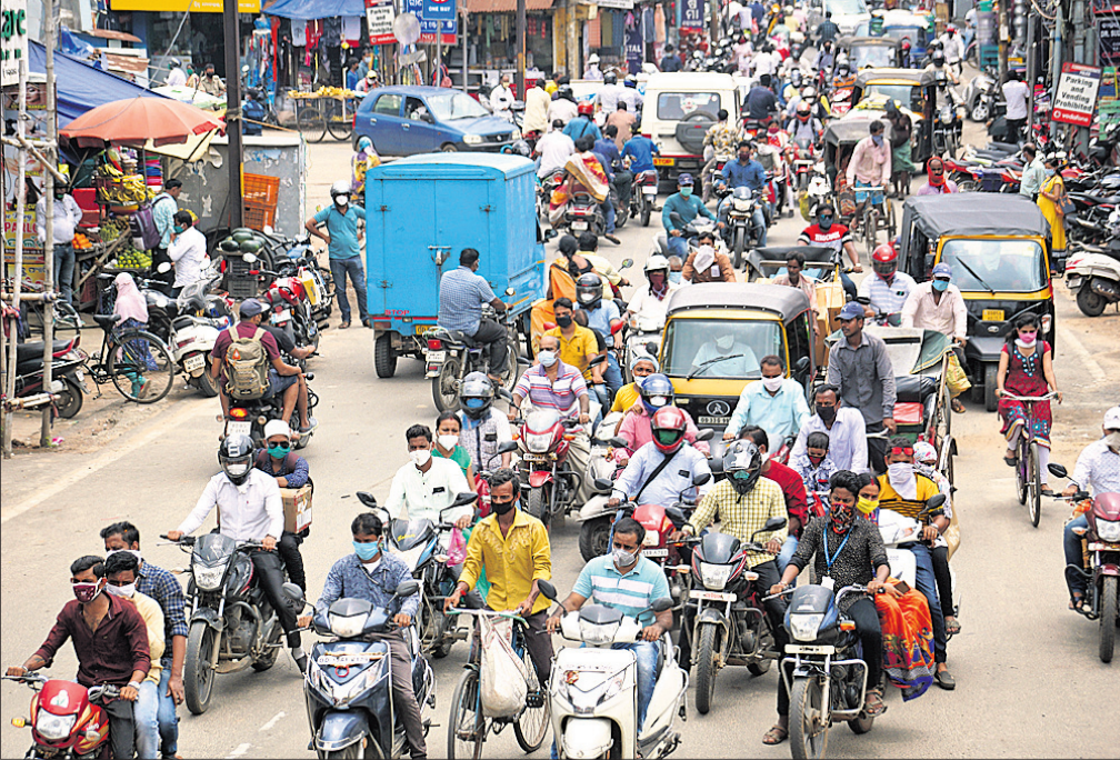
ଲକ୍ଷ୍ମୀନଗର ଷୋଲିଲା ପରେ ଯୋଗଦାନ କଟକ ରାଜ୍ୟାନ୍ତର ଛକ ରାସ୍ତାରେ ପ୍ରବଳ ଗହଳ।