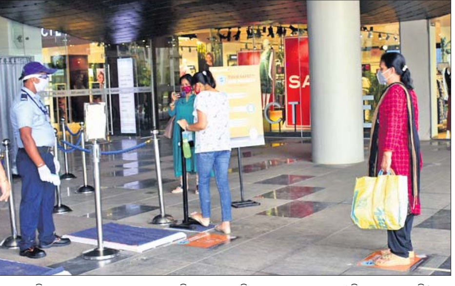
ରସୁଲଗଡ଼ସ୍ଥିତ ଏସ୍‌ପ୍ଲାନେଟ୍ ମଲ୍ ସୋମବାର ଖୋଲିବା ପରେ କୋଭିଡ୍ ଗାଇଡ୍‌ଲାଇନ୍ ଅନୁଯାୟୀ ଭିତରକୁ ଛଡ଼ାଯାଇଛି। ଜଣେ ମହିଳା ଗ୍ରାହକଙ୍କ ଭ୍ୟାନିଟିକୁ ସାମାନ୍ୟତା ଦେଖାଯାଇଛି।