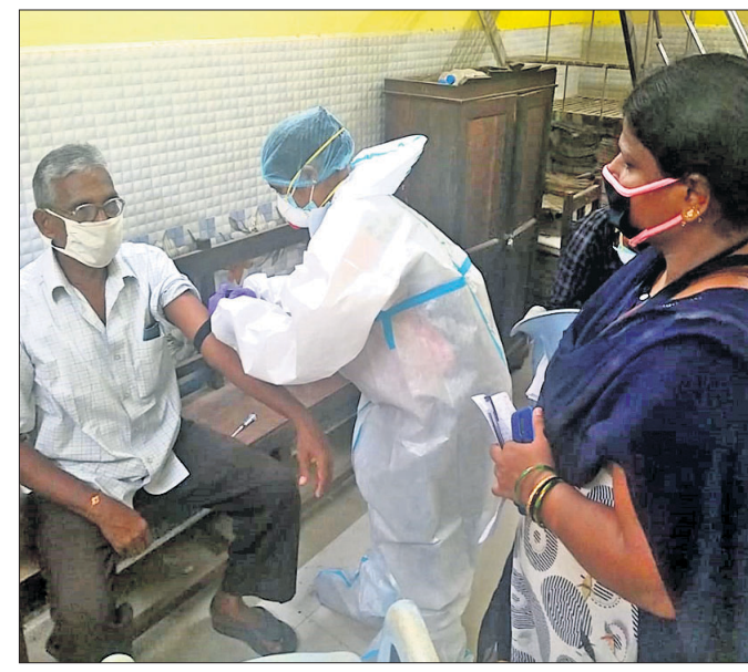
ସେରୋଲୋଜିକାଲ ସର୍ଭେ କରାଯାଇଛି।

୧୪୯ ନଂ. କାଟାରୀ ରାଜପଥର ଡେକୋରାଟିଭ ଜିଲ୍ଲା ମହାବିରୋଧ ଫାଶ୍ଟି ଘାଟଣାପୁଣ୍ୟ ଛକ ନିକଟରେ ଯୋମାବାର ଏକ କାର୍ ଓ ଟ୍ରକ୍ ମଧ୍ୟରେ ଧକ୍କା ହେବାରୁ ୨ ଜଣଙ୍କ ମୃତ୍ୟୁ ହୋଇଛି।