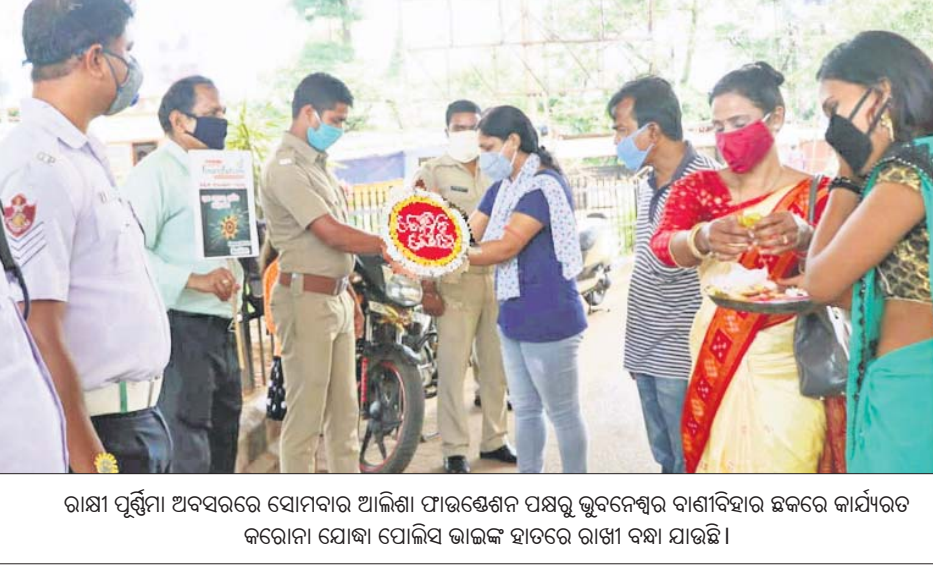
ରାଷ୍ଟ୍ରୀୟ ଅବସରରେ ସୋମବାର ଆଲିଶା ଫାଉଣ୍ଡେସନ ପକ୍ଷରୁ ଭୁବନେଶ୍ୱର ବାଣାବିହାର ଛକରେ କାର୍ଯ୍ୟରତ କରୋନା ଯୋଷା ପୋଲିସ୍ ଭାଇଙ୍କ ହାତରେ ରାଷ୍ଟ୍ରୀୟ ବସା ଯାଇଛି।