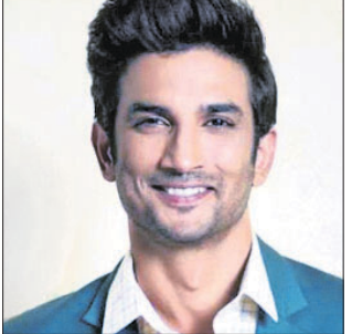
ସୁଶାନ୍ତ ସିଂ ରାଜପୁତ