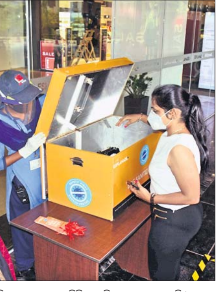
କଟକ ଅଫିସ, ୩୮