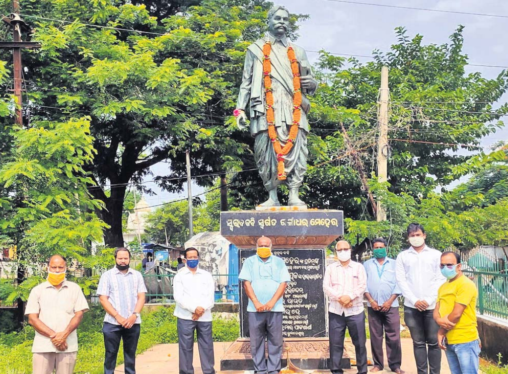
ସ୍ୱଭାବ ବିକଳ ଗଜାଧର ମେହେରଙ୍କ ୧୫୯ତମ ଜୟନ୍ତୀ ପାଳନ ଅବସରରେ ସୋମବାର ଭୁବନେଶ୍ୱର ନାଲକୋଇଲିତ ଡାକ୍ ପ୍ରତିମୂର୍ତ୍ତିରେ ମାଲ୍ୟାପର୍ଣ୍ଣାବେଳେ ଉପସ୍ଥିତ ଉତ୍କଳ ସମ୍ମିଳନୀର ସହଯୋଗୀମାନେ।