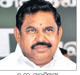
ଇ.କେ. ପାଳାନିସ୍ୱାମୀ ହିନ୍ଦୀଭାଷୀଙ୍କୁ ଲାଗୁ କରିବା ପାଇଁ କେନ୍ଦ୍ରର ଏହା ଏକ କୌଶଳପୂର୍ଣ୍ଣ ଉଦ୍ୟମ ବୋଲି ତାମିଲନାଡୁର ରାଜନୈତିକ ଦଳଗୁଡ଼ିକ ଭାବୁଛନ୍ତି । କେନ୍ଦ୍ର କୌଶଳୀ ତାମିଲନାଡୁର ଆନ୍ଦୋଳନ ହୋଇଥିଲା । ଯଦିଓ ନୂତନ ଶିକ୍ଷାନୀତିରେ ତିନି ଭାଷା ସମ୍ପର୍କରେ ନିଷ୍ପତ୍ତି ରାଜ୍ୟଗୁଡ଼ିକ ଉପରେ ଛାଡ଼ିଦିଆଯାଇଛି, ତେବେ

ନୂତନ ଜାତୀୟ ଶିକ୍ଷାନୀତିରେ ତ୍ରିଭାଷୀ ସୂତ୍ର ଗୁଣ୍ଡାଏତ ଓ ଯନ୍ତ୍ରଣାଦାୟକ ବୋଲି ତାମିଲନାଡୁର ପୁଷ୍ପମମ୍ମା ଇ.କେ. ପାଳାନିସ୍ୱାମୀ କହିବା ସହ ଏହାକୁ କାର୍ଯ୍ୟକାରୀ ହେବାକୁ ବେବେନାହିଁ ବୋଲି କହିଛନ୍ତି । ତାମିଲନାଡୁର ପିଲାମାନଙ୍କ ଉପରେ ହିନ୍ଦୀ ଭାଷାକୁ କୋରକବରଦସ୍ତ ଲାଗୁ କରିବାକୁ ପୂର୍ବତନ ପୁଷ୍ପମମ୍ମା ଆନା ଦୁରାଇ, ଏମ୍‌ଲିଆର ଏବଂ ଜୟଲଲିଆ ବିରୋଧ କରିଆସୁଥିଲେ । ଉକ୍ତ ଆଭିମୁଖ୍ୟକୁ ପାଳାନିସ୍ୱାମୀ ସମର୍ଥନ କରିବା ସହ ତ୍ରିଭାଷୀ ସୂତ୍ରର ପୁନର୍ବିଚାର ପାଇଁ ପ୍ରଧାନମନ୍ତ୍ରୀ ନରେନ୍ଦ୍ର ମୋଦିଙ୍କୁ ଅନୁରୋଧ କରିଛନ୍ତି । ୧୯୬୪ରେ ହିନ୍ଦୀକୁ ସରକାରୀ ଭାଷା କରିବା ପାଇଁ ତତ୍କାଳୀନ କଂଗ୍ରେସ ସରକାର ଉଦ୍ୟମ କରିବାରୁ ତାମିଲନାଡୁର ଆନ୍ଦୋଳନ ହୋଇଥିଲା । ଯଦିଓ ନୂତନ ଶିକ୍ଷାନୀତିରେ ତିନି ଭାଷା ସମ୍ପର୍କରେ ନିଷ୍ପତ୍ତି ରାଜ୍ୟଗୁଡ଼ିକ ଉପରେ ଛାଡ଼ିଦିଆଯାଇଛି, ତେବେ