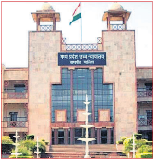
ମଧ୍ୟପ୍ରଦେଶ ହାଇକୋର୍ଟର ୫ ହଜାର ଟଙ୍କାର ପୋଷାକ ଏବଂ ମହିଳାଙ୍କୁ ୧୧ ପିଲାଙ୍କୁ ଉପହାର ଦେଲେ ଜାମିନ

ହାଇକୋର୍ଟ ନିର୍ଦ୍ଦେଶ ଦେଇଛନ୍ତି । ଏପ୍ରକାରେ ଅଭିଯୁକ୍ତ ବିକ୍ରମ ଦାମୋଦର ନାମରେ ଜଣେ ମହିଳାଙ୍କୁ ଅପବାଦରଣ କରିଥିବା ଅଭିଯୋଗ ହୋଇଥିଲା । ମହିଳାଙ୍କ ପରିବାର ପକ୍ଷରୁ ଏନେଇ ମାମଲା ଦାଏର କରାଯାଇଥିଲା । ବିକ୍ରମ ହାଇକୋର୍ଟରେ ଜାମିନ ପାଇଁ ଆବେଦନ କରିଥିଲେ । ତେବେ ହାଇକୋର୍ଟ ଏଭଳି ଏକ ନିଆରା ସର୍ତ୍ତ ରଖିଥିଲେ । ରାଜ୍ୟ ବାନ୍ଧିବାର ଫର୍ଦ୍ଦା ଏବଂ ଉପହାର ରସିଦ୍ ହାଇକୋର୍ଟରେ ଦାଖଲ କରିବା ପରେ ଜାମିନ ଉପରେ ବିଚାର କରାଯିବ ବୋଲି କୋର୍ଟ କହିଛନ୍ତି ।