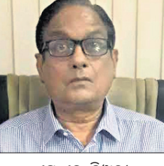
ଏସ୍.ଏସ୍.ଏସ୍. ଡିପାର୍ଟମେଣ୍ଟର ଅଧିକାରୀ