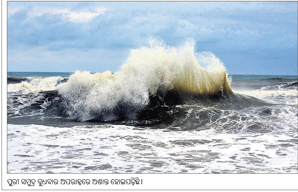
ପୁରୀ ସମୁଦ୍ର ରୁଧିରରେ ଅପରାହ୍ନରେ ଅଶାନ୍ତ ହୋଇପଡ଼ିଛି।