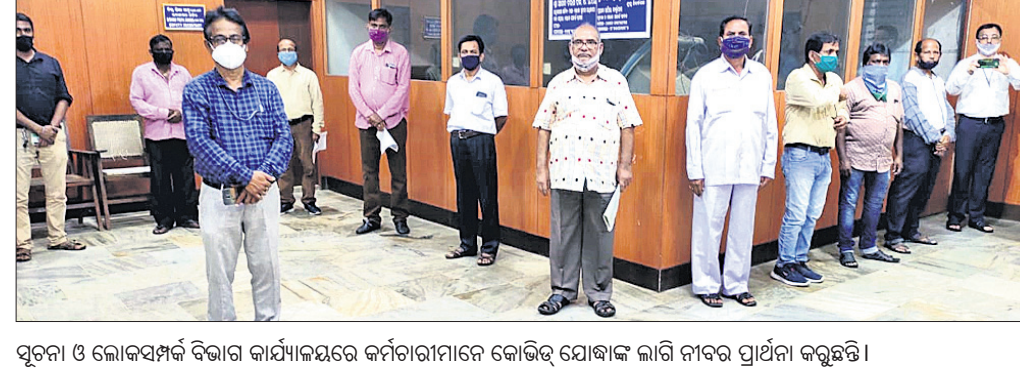
ସୂଚନା ଓ ଲୋକସମ୍ପର୍କ ବିଭାଗ କାର୍ଯ୍ୟାଳୟରେ କର୍ମଚାରୀମାନେ କୋଭିଡ଼ ଯୋଦ୍ଧାଙ୍କ ଲାଗି ନୀରବ ପ୍ରାର୍ଥନା କରୁଛନ୍ତି।

ଭୁବନେଶ୍ୱର, ୫।୮ (ବୁଧ୍ୱାର): କୋଭିଡ଼ ଯୋଦ୍ଧାମାନଙ୍କୁ ଉତ୍ସର୍ଗାକୃତ୍ ସେବା ଓ ସର୍ବଶ୍ରେଷ୍ଠ ତ୍ୟାଗ ପାଇଁ ସେମାନଙ୍କ ପ୍ରତି ଶ୍ରଦ୍ଧାଞ୍ଜଳି ଜଣାଇବା ଏବଂ ଆଗଧାଡ଼ିରେ ରହି ଦିନରାତି ସଂଗ୍ରାମ କରୁଥିବା ସମସ୍ତ କୋଭିଡ଼ ଯୋଦ୍ଧାଙ୍କ ସମ୍ମାନାର୍ଥେ ମୁଖ୍ୟମନ୍ତ୍ରୀ ନବୀନ ପଟ୍ଟନାୟକଙ୍କ ଆହ୍ୱାନ କ୍ରମେ ରୁଧିରର ସମସ୍ତ ୬୦ ଗଣ ସୂଚନା ଓ ଲୋକ ସମ୍ପର୍କ ମୁଖ୍ୟ କାର୍ଯ୍ୟାଳୟରେ ନୀରବ ପ୍ରାର୍ଥନା ଓ ଶପଥ ପାଠ ଅନୁଷ୍ଠିତ ହେବାର ସମ୍ଭାବନା ରହିଛି।