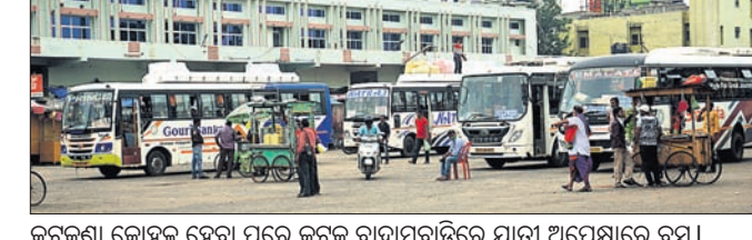
କଟକଟା କୋହଲ ହେବା ପରେ କଟକ ବାସୀମାନଙ୍କୁ ସତ୍ତ୍ୱେ ବସ୍ ଉପେକ୍ଷାରେ ବସ୍।