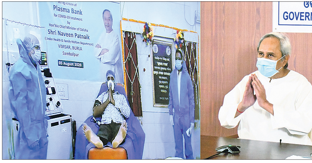
ମୁଖ୍ୟମନ୍ତ୍ରୀ ନବୀନ ପଟ୍ଟନାୟକ ଉଦ୍ଘାଟନ କରିଛନ୍ତି ପ୍ଲାଜ୍ମା ବ୍ୟାଙ୍କ ଉଦ୍ଘାଟନ କରୁଛନ୍ତି।

ରାଜ୍ୟରେ ଆଉ ୨ଟି ପ୍ଲାଜ୍ମା ବ୍ୟାଙ୍କକୁ ମୁଖ୍ୟମନ୍ତ୍ରୀ ନବୀନ ପଟ୍ଟନାୟକ ଉଦ୍ଘାଟନ କରିଛନ୍ତି। ଭିତ୍ତି ଓ କର୍ମଚାରୀଙ୍କୁ ମୁଖ୍ୟମନ୍ତ୍ରୀ ବ୍ରହ୍ମପୁରର ଏମ୍.ଏସ୍.ଏସ୍.ଏସ୍. ହସ୍ପିଟାଲରେ ପ୍ଲାଜ୍ମା ବ୍ୟାଙ୍କର ଶୁଭାରମ୍ଭ କରିଛନ୍ତି।