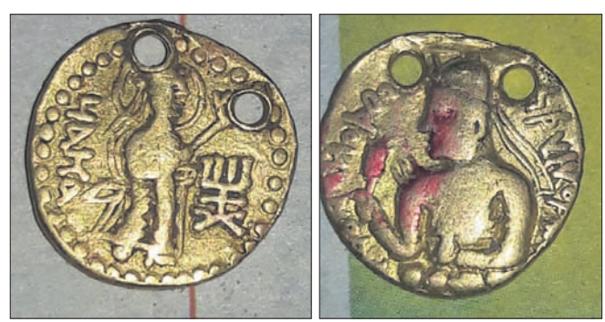
ଖୋଦିତ ହୋଇଛି । ଅନ୍ୟପାର୍ଶ୍ୱରେ ଖୋଦିତ ମୂର୍ତ୍ତି ଶସ୍ତ୍ର ଜଣା ପଡ଼ୁନାହିଁ । ଏହାସହ ମୁଦ୍ରାରେ ଚୀନ ଦେଶର କୌଣସି ରାଜାଙ୍କ ମୂର୍ତ୍ତି ଖୋଦେଇ

ଯାଜପୁର ଜିଲା ଧର୍ମଶାଳା ବ୍ଲକ୍ ଅଧୀନ ରାଧାନଗର ଗ୍ରାମ ନିକଟରୁ ଏକ ପ୍ରାଚୀନ ସ୍ୱର୍ଣ୍ଣମୁଦ୍ରା ମିଳିଛି । ପ୍ରାୟ ଏକ ସପ୍ତାହ ତଳେ ସେହି ଗ୍ରାମର ବେଖୁଆର ନାୟକ ଚାକ୍ ଚାଷ କମିରେ ଚାଷ କରୁଥିବା ବେଳେ ଏହି ସ୍ୱର୍ଣ୍ଣମୁଦ୍ରା ପାଇଥିବା ସୂଚନା ମିଳିଛି । ତେବେ ଏହାକୁ ବେଖୁଆର ଲୋକଙ୍କ ଭିଡ଼ ଲାଗି ରହିଛି । ସ୍ୱର୍ଣ୍ଣ ମୁଦ୍ରାର ଓଜନ ପ୍ରାୟ ୬ ଗ୍ରାମ ହେବ ବୋଲି କୁହାଯାଉଛି । ମୁଦ୍ରାର ଗୋଟିଏ ପାର୍ଶ୍ୱରେ ମଶାଳା ଧରିଥିବା ଜଣେ ରାଜାଙ୍କ ମୂର୍ତ୍ତି