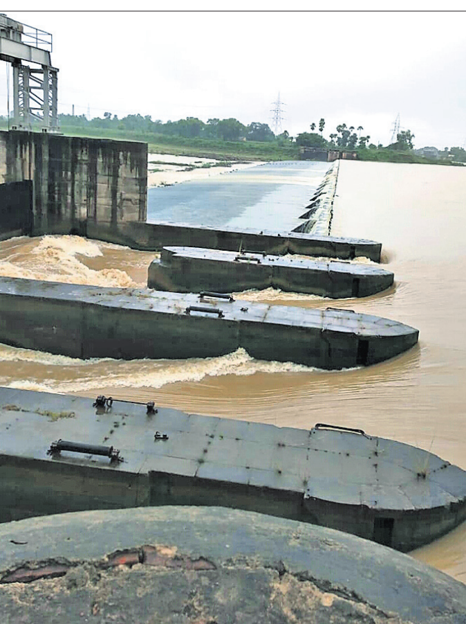
ଆଖୁଆପଦା ଆନିକଟଠାରେ ପ୍ରଥମ ବନ୍ୟା ଜଳ ପ୍ରବାହିତ ।