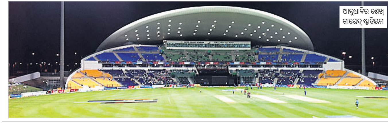
ଆହୁରି ଶେଷ କାର୍ଯ୍ୟକ୍ରମ

କେବଳ ଏକ ପାଇଲଟ୍‌ରେ ହୋଟେଲର ବ୍ୟବସ୍ଥାରେ ହୋଇପାରିବ । ସାମାଜିକ ଦୂରତ୍ଵ ନିୟମ ଅନୁସାରେ ସେହି ସ୍ଥାନକୁ ଏକ ସମୟରେ କେବଳ ୫ ସହସ୍ର ଯାଇ ପାରିବେ ଏବଂ ଫିଜିକାଲ୍ କଣ୍ଟାକ୍ଟକୁ ଦୂରରେ ରହିବାକୁ ହେବ । ଏ ସମ୍ପର୍କରେ ଆଲୋଚନା ପାଇଁ ପ୍ରାୟୋଗ୍ୟକମାନେ ଶୁକ୍ରବାର ଭିଡିଓ କନଫରେନ୍ସ ମାଧ୍ୟମରେ ଆଇପିଏଲ୍ ଗଭର୍ନିଂ କାଉନ୍ସିଲ୍ ସହିତ ଆଲୋଚନା କରିବା ସମ୍ଭାବନା ରହିଛି । ତେନାଲ ସୁପରକିଙ୍ଗ୍ସ ଦଳ ଅଗଷ୍ଟ ଦ୍ଵିତୀୟ ସପ୍ତାହରେ ଯୁଏଇରେ ପହଞ୍ଚିବାକୁ ଯୋଜନା କରିଥିଲା । ମାତ୍ର ଆନୁଷ୍ଠାନିକଭାବେ ଏସ୍ପିସି ଆସି ନ ଥିବାରୁ ସେମାନେ ଏହାକୁ ବାଟଲ କରିଛନ୍ତି । ଆଇପିଏଲ୍ ପକ୍ଷରୁ ଏସ୍ପିସି କାରି କରାଯିବା ପରେ ଯାଇ ବେନାଲରେ ପହଞ୍ଚିବାକୁ ଭାରତୀୟ ହେବ । ଇଲଣ୍ଡ ଓ ଅଷ୍ଟ୍ରେଲିଆ ମଧ୍ୟରେ କୋଲକାତା ନାଜର ରାଜତର୍ଥ ଏହାର ଶେଷ ହେବ । ଏହା ପରେ ଯାଇ ଏହି ଦୁଇ ଖେଳାଳି ଯୁଏଇ ଆସିପାରିବେ । ସେତେବେଳେ ଆଇପିଏଲ୍ ସିକନ ଆରମ୍ଭ ହେବାକୁ ମାତ୍ର ୪ ଦିନ ସମୟ ଥିବ । ଏହା ସ୍ଵତନ୍ତ୍ର ପ୍ରକାଶ କରାଯାଇଛି । ଆଇପିଏଲ୍ ପାଇଁ ଖେଳାଳି ଓ ସପୋର୍ଟ ଷ୍ଟାଫ୍‌ମାନଙ୍କୁ ପ୍ରଥମେ କ୍ଵାରାଣ୍ଟାଇନ୍‌ରେ ରହିବାକୁ ପଡ଼ିବ । ଏହା ବ୍ୟତୀତ ସମସ୍ତଙ୍କର ୪ ଥର କୋଭିଡ୍-୧୯ ଟେଷ୍ଟ ହେବ । ତା' ପରେ ଯାଇ ଯୁଏଇରେ ସେମାନେ