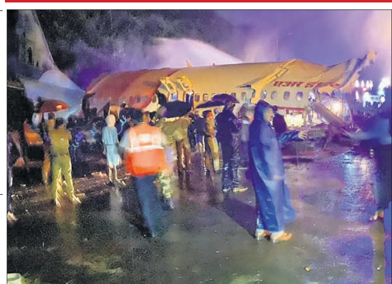
କେରଳର କୋଡିକୋଡ ଅନ୍ତର୍ଜାତୀୟ ବିମାନବନ୍ଦରରେ ଦୁର୍ଘଟଣାଗ୍ରସ୍ତ ବିମାନ ।

କୋଡିକୋଡ, ୭।୮ କେରଳର କୋଡିକୋଡ ଅନ୍ତର୍ଜାତୀୟ ବିମାନ ବନ୍ଦରରେ ଏୟାର ଇଣ୍ଡିଆ ଏକ୍ସପ୍ରେସ୍‌ର ଏକ ବିମାନ ଶୁକ୍ରବାର ରାତି ୭ଟା ୪୦ରେ ଅବତରଣ ବେଳେ ଦୁର୍ଘଟଣାଗ୍ରସ୍ତ ହୋଇଛି । ବିମାନଟି ରତ୍ନଝେରୀ ବାହାରକୁ ଚାଲିଯାଇ ୩୦ ଫୁଟ ଗଭୀର ଗର୍ତ୍ତରେ ଖସିପଡ଼ିବାକୁ ଦୁଇଖଣ୍ଡ ହୋଇଯାଇଛି । ଦୁର୍ଘଟଣାରେ ଦୁଇ ପାଇଲଟଙ୍କ ସମେତ ୧୬ ଜଣଙ୍କ ମୃତ୍ୟୁ ଘଟିଛି । ଆହତ ୫୦ ଯାତ୍ରୀଙ୍କୁ ହସ୍ପିଟାଲରେ ଭର୍ତ୍ତି କରାଯାଇଛି । ସେମାନଙ୍କ ମଧ୍ୟରୁ ୧୫ ଜଣଙ୍କ ଅବସ୍ଥା ସଙ୍କଟାପନ୍ନ ରହିଛି ।