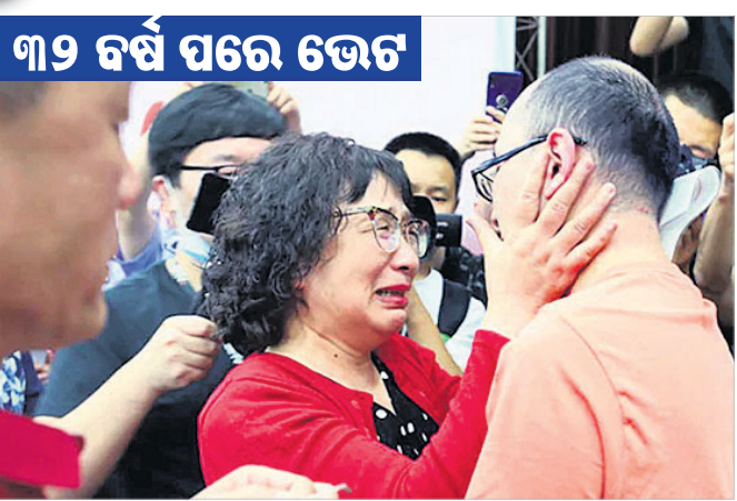
୩୨ ବର୍ଷ ପରେ ଭେଟ

ବେଳି: ୩୨ ବର୍ଷ ପରେ ପୁଅକୁ ଫେରି ପାଇଥିବା ଜଣେ ମା'ର ବାସନ୍ତ୍ୟ ମନତା ସୋସିଆଲ ମିଡିଆରେ ଭାଇରାଲ ହେବାରେ ଲାଗିଛି। ପ୍ରାୟ ତିନି ଦଶନ୍ଧି ଧରି ପୁଅକୁ ଖୋଜିବା ପରେ, ମା' ପ୍ରାୟ ଆଶା ହରାଇଥିଲେ। ତେବେ ୩୨ ବର୍ଷ ପରେ ପୁଅକୁ ଭେଟିବା ପୂର୍ବରୁ ମା' ମଧ୍ୟ ଭୟ କରୁଥିଲେ ଯେ, କାଳେ ତାଙ୍କ ପୁଅ ତାଙ୍କୁ ଚିହ୍ନି ପାରିବନି। ତାଙ୍କୁ ଗ୍ରହଣ କରିବନି। ମାତ୍ର ପୁଅ ମଧ୍ୟ ମାଆଙ୍କୁ ଦେଖି ଆନନ୍ଦର ଅଶ୍ରୁ ବୁହାଇଥିବା ଫଟୋ ଏବେ ସୋସିଆଲ ମିଡିଆରେ ବେଶ୍ ଭାଇରାଲ ହେବାରେ ଲାଗିଛି।