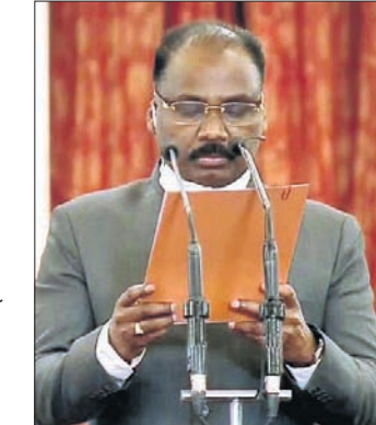
ରାଜ୍ୟ ସରକାରରୁ ଚିକିତ୍ସା ଅଧିକାରୀ ଭାବେ ଅଧିକାରୀ ହୋଇଥିଲେ। ସିଏଜି ଭାବେ ଶପଥ ନେଇ ଗିରୀଶ ମୁର୍ମୁ ପକ୍ଷରୁ କୁହାଯାଇଛି। ସାମ୍ବିଧାନିକ ପଦାଧିକାରୀ ସିଏଜି କେନ୍ଦ୍ର ଓ

ଓଡ଼ିଆ ଆଲବଏସ୍ ଅଫିସର ଗିରୀଶ ଚନ୍ଦ୍ର ମୁର୍ମୁ ଭାରତର କମ୍ପ୍ୟୁଟର ଆଣ୍ଡ ଅଡିଟର ଜେନେରାଲ (ସିଏଜି) ଭାବେ ଶପଥ ନେଇ ଶପଥ ଗ୍ରହଣ କରିଛନ୍ତି। ରାଷ୍ଟ୍ରପତି ଭବନର ଅଶୋକା ହଲରେ ରାଷ୍ଟ୍ରପତି ରାମନାଥ କୋବିନ୍ଦ ତାଙ୍କୁ ଶପଥ ପାଠ କରାଇଥିଲେ। ଜଷ୍ଟି-କମ୍ପାନର ପୂର୍ବତନ ଉପରାଜ୍ୟପାଳ ଗିରୀଶ ୧୯୮୫ ବ୍ୟାଚର ଗୁଜରାଟ କ୍ୟାଡର ଆଲବଏସ୍ ଅଫିସର। ସିଏଜି ପଦରେ ସେ ୨୦୧୪ ନଭେମ୍ବର ୨୦ ରମ୍ୟ ସରକାରରୁ ଚିକିତ୍ସା ଅଧିକାରୀ ଭାବେ ଅଧିକାରୀ ହୋଇଥିଲେ। ସିଏଜି ଭାବେ ଶପଥ ନେଇ ଗିରୀଶ ମୁର୍ମୁ ପକ୍ଷରୁ କୁହାଯାଇଛି। ସାମ୍ବିଧାନିକ ପଦାଧିକାରୀ ସିଏଜି କେନ୍ଦ୍ର ଓ