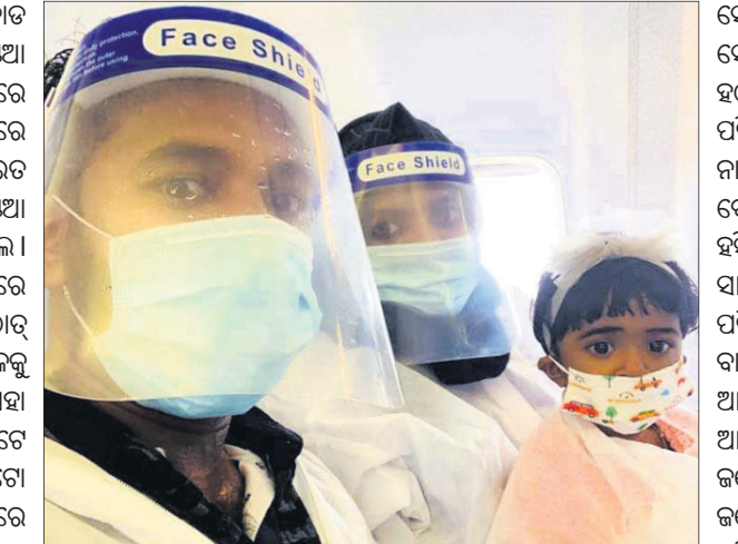
ଦୁଃଖ ନିକ ଝିଅ ଓ ପଢ଼ାକ ସହ ବିମାନରେ ନେଇଥିବା ସେଲି ଦେଖିବାକୁ ମିଳିଛି। ଏହି ୨ଟି ଫଟୋ ଏବେ ଆଣିଦେଇଛି। କାରଣ ଦୁର୍ଘଟଣା ପୂର୍ବରୁ ଜଣେ ବ୍ୟକ୍ତି ତାଙ୍କ ପାଇଁ ଶେଷ ସେଲି ହୋଇଯାଇଛି। ଉକ୍ତ ଫଟୋରେ ସୋସିଆଲ ମିଡିଆରେ ଭାଇରାଲ ହେବାରେ ଲାଗିଛି।

କୋଝିକୋଡ଼: କେରଳର କୋଝିକୋଡ଼ ଅନ୍ତର୍ଜାତୀୟ ବିମାନବନ୍ଦରରେ ଏୟାର ଇଣ୍ଡିଆ ଏକ୍ସପ୍ରେସ୍ ବିମାନ ଶୁକ୍ରବାର ସନ୍ଧ୍ୟାରେ ଦୁର୍ଘଟଣାଗ୍ରସ୍ତ ହୋଇଥିଲା। ଏହି ଦୁର୍ଘଟଣାରେ ୧୮ ଜଣଙ୍କ ମୃତ୍ୟୁ ଘଟିଥିଲା। ବନ୍ଦେ ଭାରତ ମିଶନରେ ବୁବାଇରୁ ଆସୁଥିବା ଏୟାର ଇଣ୍ଡିଆ ଏକ୍ସପ୍ରେସ୍ ବିମାନରେ ୧୭୪ଜଣ ଯାତ୍ରୀ ଥିଲେ। କେରଳର କୋଝିକୋଡ଼ ବିମାନବନ୍ଦରରେ ଲ୍ୟାଣ୍ଡିଂ କରୁଥିବା ସମୟରେ ବିମାନଟି ହଠାତ୍ ଉଡ଼ିବା ବାହାରକୁ ଚାଲିଯାଇ ୩୦ ଫୁଟ ଚଳି ଖସିପଡ଼ିବାକୁ ଦୁଇଖଣ୍ଡ ହୋଇଯାଇଥିଲା। ଯାହା ଅତ୍ୟନ୍ତ ହୃଦୟ ବିଦାରକ ଦୃଶ୍ୟ ଥିଲା। ଅନ୍ୟପଟେ ବିମାନ ଦୁର୍ଘଟଣା ପରେ ଏବେ ୨ଟି ଫଟୋ ସୋସିଆଲ ମିଡିଆରେ ଭାଇରାଲ ହେବାରେ ଲାଗିଛି। ବିମାନରେ ବୁବାଇରୁ ଆସୁଥିବା ଏକ ପରିବାରର ଏହି ଫଟୋ ଅନେକଙ୍କ ମନରେ ଦୁଃଖ ନିକ ଝିଅ ଓ ପଢ଼ାକ ସହ ବିମାନରେ ନେଇଥିବା ସେଲି ଦେଖିବାକୁ ମିଳିଛି। ଏହି ୨ଟି ଫଟୋ ଏବେ ଆଣିଦେଇଛି। କାରଣ ଦୁର୍ଘଟଣା ପୂର୍ବରୁ ଜଣେ ବ୍ୟକ୍ତି ତାଙ୍କ ପାଇଁ ଶେଷ ସେଲି ହୋଇଯାଇଛି। ଉକ୍ତ ଫଟୋରେ ସୋସିଆଲ ମିଡିଆରେ ଭାଇରାଲ ହେବାରେ ଲାଗିଛି।