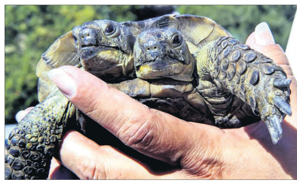
ସିକରଲାଣ୍ଡର ଜେନେରାଲିଟି 'ସୁଧିକରଣ' ଅଫ ନାୟୁରାଲ ହିଷ୍ଟ୍ରିରେ ଜଣେ କର୍ମଚାରୀ ଦୁଇମୁଣ୍ଡିଆ କଇଁଛ 'କାନ୍ଦୁ'କୁ ଦେଖାଉଛନ୍ତି।

ପ୍ରଧାନମନ୍ତ୍ରୀ ନରେନ୍ଦ୍ରମୋଦିଶନିବାରଠାରୁ ସପ୍ତାହବ୍ୟାପୀ ଆବର୍ଜନାମୁକ୍ତ ଭାରତ ଅଭିଯାନର ଶୁଭାରମ୍ଭ କରିଛନ୍ତି। ଏଥିସହିତ ସେ ରାଜସ୍ୱାଚାର୍ଯ୍ୟ ଚଳାଣି ଚଳିତ ଓ ଦର୍ଶନ ସମିତିରେ ରାଷ୍ଟ୍ରୀୟ ସ୍ୱଚ୍ଛତା କେନ୍ଦ୍ରର ଶୁଭାରମ୍ଭ କରିଛନ୍ତି। କରୋନା ମହାମାରୀରୁ ରକ୍ଷା ପାଇବା ପାଇଁ ସାମାଜିକ ଦୂରତା ନିୟମ ପାଳନ କରିବା ସହ ମାସ୍କ ପରିଧାନ କରିବାକୁ ମୋଦି କାର୍ଯ୍ୟକ୍ରମରେ ଯୋଗଦେଇଥିବା ପିଲାମାନଙ୍କୁ ପରାମର୍ଶ ଦେଇଥିଲେ। ସ୍ୱଚ୍ଛତା ଓ ପରିମଳ ଅଭିଯାନକୁ ସୁଦୃଢ଼ କରିବା ପାଇଁ ସ୍ୱାଧୀନତା ଦିବସ ପର୍ଯ୍ୟନ୍ତ ଆବର୍ଜନାମୁକ୍ତ ଭାରତ ଅଭିଯାନ ଚାଲିବ। କରୋନା ମୁକ୍ତିଲାଭରେ ସ୍ୱଚ୍ଛ ଭାରତ ଅଭିଯାନ ସହାୟକ ହୋଇଥିବା ପ୍ରଧାନମନ୍ତ୍ରୀ କହିଛନ୍ତି। ୨୦୧୪ ପୂର୍ବରୁ ଦେଶରେ ପାଇଲଟାନ୍ତର ଘୋର ଅଭାବ ଥିଲା। ସେତେବେଳେ କରୋନା ମହାମାରୀ ଆସିଥିଲେ ଲକ୍ଷ୍ମଣର ସମ୍ଭବ ହୋଇ ନ ଥାନ୍ତା ବୋଲି ପ୍ରଧାନମନ୍ତ୍ରୀ କହିଥିଲେ।