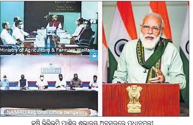
କୃଷି ଭିଡ଼ିଓମି ପାଣ୍ଠିର ଶୁଭାରମ୍ଭ ଅବସରରେ ପ୍ରଧାନମନ୍ତ୍ରୀ ନରେନ୍ଦ୍ର ମୋଦି ଭିଡ଼ିଓ କନ୍ସପ୍ଟରେନ୍ସରେ ସମ୍ବୋଧନ କରୁଛନ୍ତି।

ନୂଆଦିଲ୍ଲୀ, ୯।୮ (ପି.ଟି.) ଦେଶର କୃଷକମାନଙ୍କ ପାଇଁ କେନ୍ଦ୍ର ସରକାର ରବିବାର ଏକ ବଡ଼ ଘୋଷଣା କରିଛନ୍ତି। ପ୍ରଧାନମନ୍ତ୍ରୀ ନରେନ୍ଦ୍ର ମୋଦି କୃଷି କ୍ଷେତ୍ରରେ ସଂସ୍କାର ଆଣିବାକୁ ଯାଇ ୧ ଲକ୍ଷ କୋଟି ଟଙ୍କାର କୃଷି ଭିଡ଼ିଓମି ପାଣ୍ଠି ଶୁଭାରମ୍ଭ କରିଛନ୍ତି। ଏହା କ୍ଷୁଦ୍ରଚାଷୀମାନଙ୍କୁ ସଶକ୍ତ କରିବ। ଏହାସହ ଅମଳ ପରବର୍ତ୍ତୀ ଭିଡ଼ିଓମିକୁ ପୁରୁତ କରିବା ସହ ନିମ୍ନସ୍ତରୀୟ କ୍ଷେତ୍ରରେ ସହାୟକ ହେବ ବୋଲି ପ୍ରଧାନମନ୍ତ୍ରୀ ଆଶାବାଦୀ କରିଛନ୍ତି।