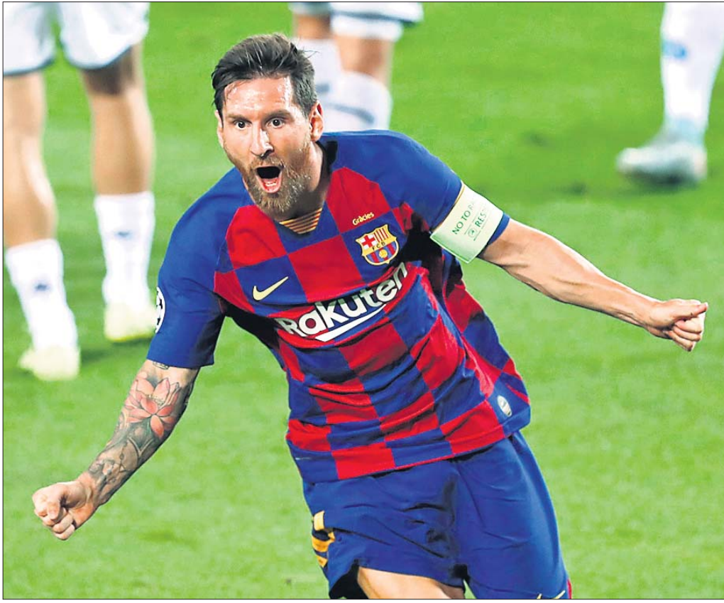
ଡାମ୍ପିୟନ୍ ଲିଗ୍ ଫୁଟବଲ ଚୁନାମେଣ୍ଟ ନାପୋଲି ବିପକ୍ଷ ମ୍ୟାଚ୍‌ରେ ଗୋଲ୍ ଦେବାପରେ ବାର୍ସିଲୋନା ଲିଓନେଲ୍ ମେସି।

ଯଥାକ୍ରମେ ୨୫, ୧୯, ୧୫, ୧୨, ୧୦, ୮, ୬, ୪, ୨ ଓ ୧ ପଏଣ୍ଟ ମିଳିଛି। ଭାର୍ଷ୍ମୀୟେନଙ୍କ ପାଇଁ ୮ ରେସ୍‌କୁ ସହାୟକ। ୭ମ ପୋଡିୟମ ଫିନିଶ୍। ଏହା ପୂର୍ବରୁ ସେ ଶେଷଥର ପାଇଁ ୨୦୧୯ରେ ବ୍ରାଜିଲ ଗ୍ରାଁ ପ୍ରି ଜିତିଥିଲେ। ଫେରାରୀର ସେବାଷ୍ଟିଆନ ଭେଟେଲ, ମ୍ୟାକ୍‌ଲରେନର କାର୍ଲୋସ ସିନ୍ତିନ୍‌ୟର, ରେନଲ୍ଡର ତାନିଏଲ ରିକୋର୍ଡୋ, ଆଲ୍‌ଫା ରୋମିଓର କିମି ରାଇକୋନେନ, ହାସ୍‌ବର ରୋମାଲ୍‌ନ ଗ୍ରାସଜେନ ପ୍ରମୁଖ ଯଥାକ୍ରମେ ୧୨ରୁ ୧୭ତମ ସ୍ଥାନରେ ସନ୍ତୁଷ୍ଟ ରହିଥିଲେ। ଆନିଭର୍ସାରୀ ରେସ୍ ପରେ ଲୁଇସ ହାମିଲଟନ ୧୦୭ ପଏଣ୍ଟ ସହିତ ଦ୍ରାଭଜର୍‌ଙ୍କ ସ୍ଫ୍ଟିଂରେ ଶୀର୍ଷସ୍ଥାନ ବଜାୟ ରଖିଛନ୍ତି। ଭାର୍ଷ୍ମୀୟେନ ୭୭ ଓ ବୋଟାସ୍ ୭୩ ପଏଣ୍ଟ ସହିତ ପରବର୍ତ୍ତୀ ୨ ସ୍ଥାନରେ ରହିଛନ୍ତି। କନସ୍‌ପ୍ଲ୍‌ସ୍ ଷ୍ଟିଂରେ ମର୍ସିଡିଜ୍ ୧୮୦ ଓ ରେଡ୍‌ବୁଲ୍ ୧୧୩ ପଏଣ୍ଟ ପାଇ ପ୍ରଥମ ୨ ସ୍ଥାନ ଅଧିକାର କରିଛନ୍ତି।