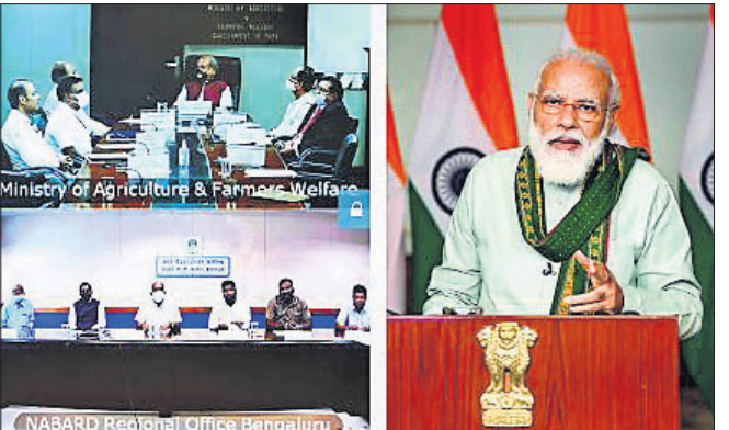
କୃଷି ଭିତ୍ତିଭୂମି ପାଣ୍ଠିର ଶୁଭାରମ୍ଭ ଅବସରରେ ପ୍ରଧାନମନ୍ତ୍ରୀ ନରେନ୍ଦ୍ର ମୋଦି ଭିଡ଼ିଓ କନ୍ଫରେନ୍ସରେ ସମ୍ବୋଧନ କରୁଛନ୍ତି।

ନୂଆଦିଲ୍ଲୀ, ୯।୮ (ପି.ଟି.) ଦେଶର କୃଷକମାନଙ୍କ ପାଇଁ କେନ୍ଦ୍ର ସରକାର ରବିବାର ଏକ ବଡ଼ ଘୋଷଣା କରିଛନ୍ତି। ପ୍ରଧାନମନ୍ତ୍ରୀ ନରେନ୍ଦ୍ର ମୋଦି କୃଷି କ୍ଷେତ୍ରରେ ସଂସ୍କାର ଆଣିବାକୁ ଯାଇ ୧ ଲକ୍ଷ କୋଟି ଟଙ୍କାର କୃଷି ଭିତ୍ତିଭୂମି ପାଣ୍ଠିର ଶୁଭାରମ୍ଭ କରିଛନ୍ତି। ଏହା କ୍ଷୁଦ୍ରଚାଷୀମାନଙ୍କୁ ସଶକ୍ତ କରିବ। ଏହାସହ ଅମଳ ପରବର୍ତ୍ତୀ ଭିତ୍ତିଭୂମିକୁ ସୁଦୃଢ଼ କରିବା ସହ ନିମ୍ନସ୍ତରୀୟ କ୍ଷେତ୍ରରେ ସହାୟକ ହେବ ବୋଲି ପ୍ରଧାନମନ୍ତ୍ରୀ ଆଶାବ୍ୟକ୍ତ କରିଛନ୍ତି।