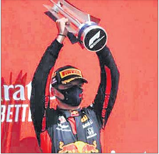
ରେସ୍ ଜିତିବା ପରେ ଟ୍ରଫି ସହ ମ୍ୟାକ୍ ଭାର୍ଷ୍ମୀୟେନ।

ସିଲଭରଷ୍ଟେନ, ୯। ରେଡ୍‌ବୁଲ୍ ଦ୍ରାଭଜର ନେବରଲାଣ୍ଡର ମ୍ୟାକ୍ ଭାର୍ଷ୍ମୀୟେନ ରବିବାର ଏଠାରେ ଅନୁଷ୍ଠିତ ଫର୍ମୁଲାଓନରେ ୭୦ତମ ଆନିଭର୍ସାରୀ ଗ୍ରାଁ ପ୍ରି ଉପରେ ପ୍ରଥମସ୍ଥାନ ଅଧିକାର କରିଛନ୍ତି। ରାଷ୍ଟ୍ରୀୟନଶ୍ଚିପ୍ ଲିଡର ମର୍ସିଡିଜ୍‌ର ଲୁଇସ ହାମିଲଟନ ଦ୍ୱିତୀୟ ଏବଂ ତାଙ୍କ ବିପକ୍ଷରେ ଭାଲଟେରି ବୋଟାସ୍ ଦ୍ୱିତୀୟ ସ୍ଥାନ ଅଧିକାର କରିଛନ୍ତି। ଅନ୍ୟମାନଙ୍କ ମଧ୍ୟରେ ଫେରାରୀର ଚାର୍ଲ୍ସ ଲେକ୍ଲେଙ୍କ୍, ରେଡ୍‌ବୁଲ୍‌ର ଆଲେକ୍ସାଣ୍ଡର ଆଲଭନ୍, ରେସିଂ ପଏଣ୍ଟର ଲାନ୍ସ ଷ୍ଟୋଲ, ନିକୋ ହକେନବର୍ଗ, ରେନଲ୍ଡର ଏଡେବନ ଓକନ, ମ୍ୟାକ୍‌ଲରେନର ଲାନଡୋ ନଦିସ୍ ଓ ଆଲ୍‌ଫା ଟୋରାର ତାନିଏଲ କ୍ୟାଟ୍ ଯଥାକ୍ରମେ ୪ର୍ଥରୁ ୧୦ମ ସ୍ଥାନ ଅଧିକାର କରିଛନ୍ତି। ୧୯-୧୦ ଫିନିଶ୍ କରିଥିବା ଦ୍ରାଭଜର ମାନଙ୍କୁ