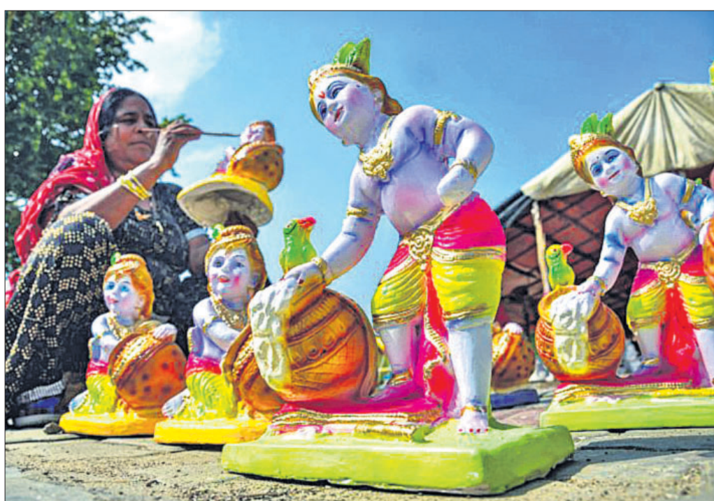
କର୍ମାଣ୍ଡୁ ପୂର୍ବରୁ ଅନୁସରରେ ଭଗବାନ ଶ୍ରୀକୃଷ୍ଣଙ୍କ ମୂର୍ତ୍ତିରେ ଶେଷସର୍ଗ ଦେଉଛନ୍ତି ମହିଳା କାରିଗର।