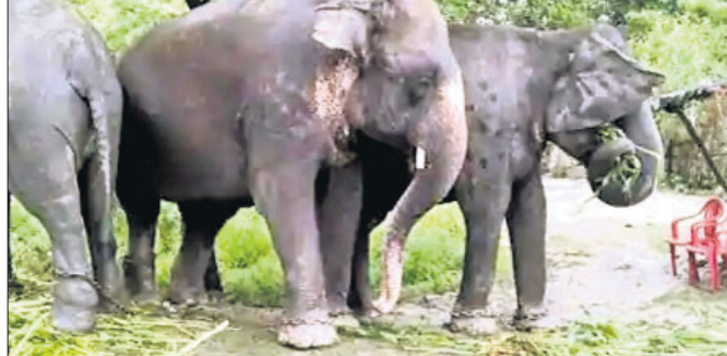
କରାଇବା ଲାଗି କାର୍ଯ୍ୟକ୍ରମ ଗ୍ରହଣ କରାଯାଇଛି। ଆସନ୍ତାବର୍ଷ ପୁଣ୍ୟ ଏହାର ଫଳାଫଳ ମିଳିଯିବ ବୋଲି ମନ୍ତ୍ରୀ କହିଛନ୍ତି। ଗତ ମେ' ୨୭ରେ କେରଳରେ ସଂଘର୍ଷ ଘଟଣା ଘଟିଥିଲା। ହାତୀମାନଙ୍କୁ ଖାଦ୍ୟ ଓ ଜଳ ଉପଲବ୍ଧ

କେନ୍ଦ୍ର ପରିବେଶ ରାଷ୍ଟ୍ରମନ୍ତ୍ରୀ ବାବୁଲ ସୁପ୍ରିୟୋ ନିନ୍ଦା କରିଛନ୍ତି। ହାତୀମାନଙ୍କୁ ସୁରକ୍ଷା ଦେବାକୁ ହେବ। କେରଳ ଘଟଣା ଅମାନବିକାର ପରିଚୟ। ଏଭଳି ଅପରାଧ ବିରୋଧରେ କଠୋର ଓ ଦୃଷ୍ଟାନ୍ତମୂଳକ କାର୍ଯ୍ୟାନୁଷ୍ଠାନ ଗ୍ରହଣ