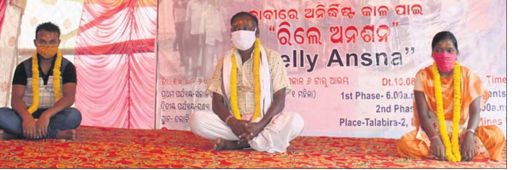
କମ୍ପାନୀ ପାଟକ ସମ୍ମୁଖରେ ଅନଶନ କରାଯାଇଛି।

ରେଙ୍ଗାଲି, ୧୦।୮ (ଡି.ଏନ୍.ଏ.) ସମ୍ବଲପୁର ଜିଲ୍ଲା ରେଙ୍ଗାଲି ବ୍ଲକ୍ ତଳାବିରା ୨ ଓ ୩ କୋଇଲା ଖଣି ଖନନ କାର୍ଯ୍ୟ କରୁଥିବା ଏନ୍-ଏଲସି କମ୍ପାନୀରେ ସ୍ଥାନୀୟ ନିୟୁକ୍ତି ଦାବିରେ କର୍ମଚାରୀ ସଙ୍ଗଠନ ପକ୍ଷରୁ ରିଲେ ଅନଶନ ଆରମ୍ଭ କରାଯାଇଛି। ସୋମବାର