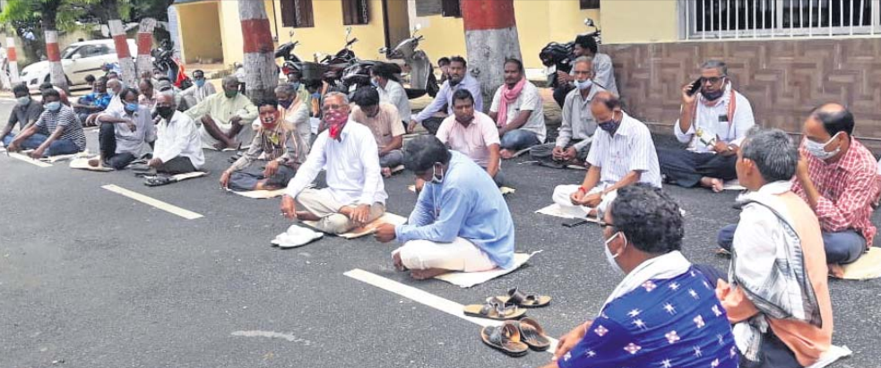
ଜିଲ୍ଲାପାଳଙ୍କ ଅଫିସ୍ ସମ୍ମୁଖରେ ଚାଷୀଙ୍କ ଧାରଣା।

ବରଗଡ଼ ଜିଲ୍ଲାରେ ବର୍ତ୍ତମାନ ୨୦୨୦ ଖରିଫ ଚାଷକାରୀଙ୍କ କୋର୍ଡ଼ ଧରିଛି। ମାତ୍ର ଏପର୍ଯ୍ୟନ୍ତ ଜିଲ୍ଲାର ପଞ୍ଚୁପୁର ଉପଖଣ୍ଡ ଅନ୍ତର୍ଗତ ସୋହେଲା, ଗାଜସିଲେଟ୍ ଏବଂ ଝାରବନ୍ଧୁ ବ୍ଲକ୍ ଚାଷୀମାନେ ୨୦୧୯ ଖରିଫ ଫସଲକ୍ଷତିର ବୀମାପାଲି ପାଇ ପାରି ନାହାନ୍ତି। ଫଳରେ ଚାଷୀ ଅସହାୟ ଚେତନାରେ ଲାଗିଛି। ଏହାର ପ୍ରତିବାଦରେ ସୋମବାର ବରଗଡ଼ ଜିଲ୍ଲା ଚାଷୀ ସଙ୍ଗଠନ ସମନ୍ୱୟ ସମିତି ପକ୍ଷରୁ ଜିଲ୍ଲାପାଳଙ୍କ ଅଫିସ୍ ଆଗରେ ଧାରଣା ଦିଆଯାଇଥିଲା। ପରେ ପ୍ରଶାସନିକ ଅଧିକାରୀ, ବୀମା ଅଧିକାରୀମାନେ ଧାରଣାକୁ ପହଞ୍ଚି ଏ ନେଇ ବିଚାର କରାଯିବ ବୋଲି ପ୍ରତିଶ୍ରୁତି ଦେଇଥିଲେ। ଏହାପରେ ଅପରାହ୍ଣ ପ୍ରାୟ ୩ଟାରେ ଚାଷୀମାନେ ଧାରଣାକୁ ଉତ୍ତରୁଥିଲେ। ପ୍ରକାଶ ସହ ବୁଝିପାତ ଯୋଗୁ ଗତ ୨୦୧୯ ଖରିଫ ଋତୁରେ ପଞ୍ଚୁପୁର ଉପଖଣ୍ଡରେ ବ୍ୟାପକ ଫସଲକ୍ଷତି ହୋଇଥିଲା। ଚାଷୀମାନେ ଚାଷ ପୂର୍ବରୁ ପ୍ରଧାନମନ୍ତ୍ରୀ ଫସଲବୀମା ଯୋଜନାରେ ବୀମା ପ୍ରିମିୟମ ରାଶି ଜମା କରିଥିଲେ। ସୁଦ୍ଧା ବିଭିନ୍ନ ବ୍ଲକ୍ ଅତିରିକ୍ତ ଚାଷୀଙ୍କୁ ବୀମାପାଲି ମିଳିଥିବାବେଳେ ସୋହେଲା, ଗାଜସିଲେଟ୍ ଏବଂ