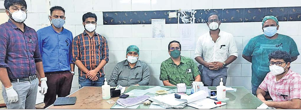
ବଲାଙ୍ଗୀର ଭାମ ଭୋଇ ମେଡିକାଲ କଲେଜ ଓ ହସ୍ପିଟାଲର ଜଣେ ଡାକ୍ତରଙ୍କୁ ଆକ୍ରମଣର ପ୍ରତିବାଦରେ କଟକ ବଡ଼ ମେଡିକାଲର ତାତ୍ତ୍ୱର ଛାତ୍ରମାନେ ସୋମବାର କଳାବ୍ୟାଜ ପରିଧାନ କରିଛନ୍ତି।