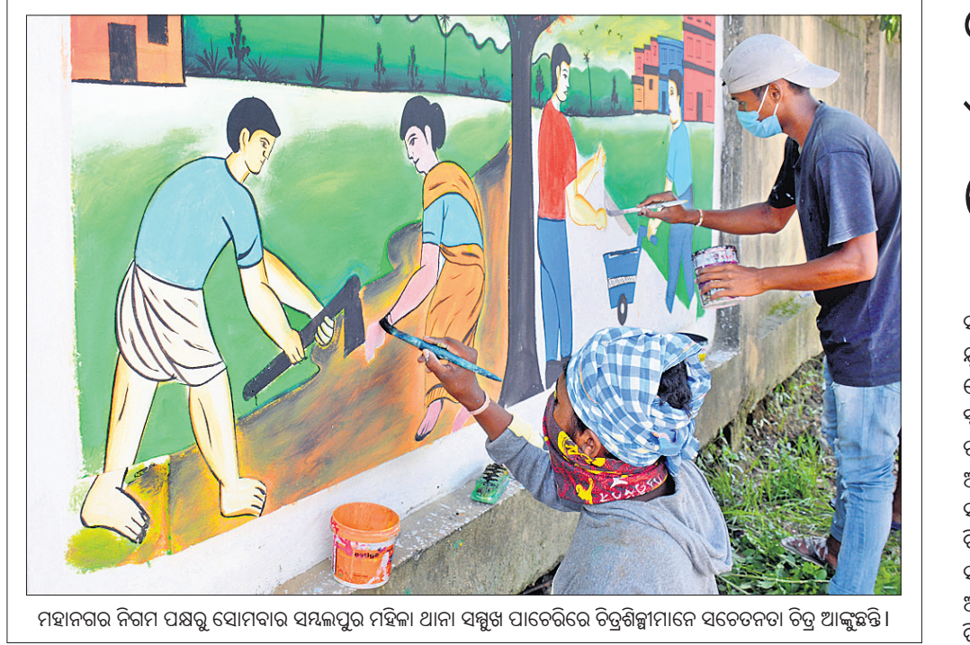
ମହାନଗର ନିଗମ ପକ୍ଷରୁ ସୋମବାର ସମ୍ବଲପୁର ମହିଳା ଥାନା ସମ୍ମୁଖ ପାଟେରିରେ ଚିତ୍ରଶିଳ୍ପାମାନେ ସଚେତନତା ଚିତ୍ର ଆଙ୍କୁଛନ୍ତି।