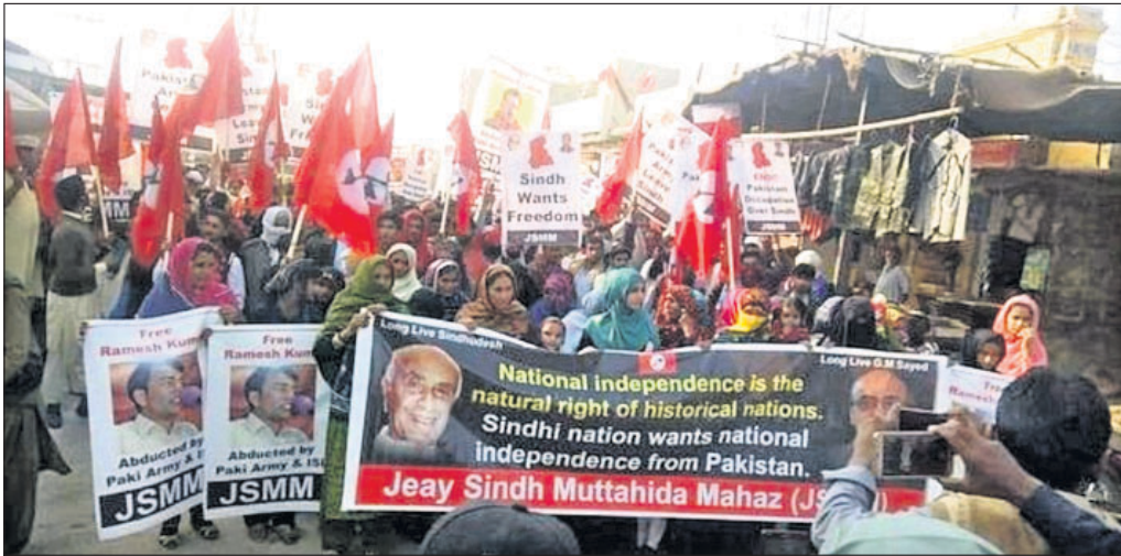
ପାକିସ୍ତାନରୁ ଅଲଗା ହୋଇ ସାଧାରଣ ବେଲୁଚିସ୍ତାନ ଦାବିରେ ବିରୋଧୀ।