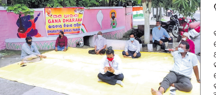
ଆରତିସିଙ୍କ ଅଫିସ ଆଗରେ ବିକାଶ ପରିଷଦ କର୍ମକର୍ମୀମାନେ ଧାରଣା ଦେଇଛନ୍ତି ।

ଗଞ୍ଜାମ ଜିଲାରେ କରୋନା ପରିଚାଳନାରେ ପ୍ରଶାସନିକ ଅବହେଳା ପ୍ରତିବାଦରେ ସୋମବାର ଭାରତୀୟ ବିକାଶ ପରିଷଦ ପକ୍ଷରୁ ଛତ୍ରପୁର ଆରତିସିଙ୍କ କାର୍ଯ୍ୟାଳୟ ଆଗରେ ବିରୋଧ ସହ ଧାରଣା ଦିଆଯାଇଥିଲା । ଅନିୟମିତତା ହୋଇଥିବା ପରିଷଦ ଅଭିଯୋଗ କରିଥିଲା । ଜିଲାରେ ଆର୍ଥିକନେତ୍ର ଓ ସର୍ବ ଟେଷ୍ଟ ରୋପୋର୍ଟରେ ବିଳମ୍ବ ଯୋଗୁ ସଂକ୍ରମଣ ବୃଦ୍ଧି ପାଇଥିବା ପରିଷଦ ଅଭିଯୋଗ କରିଥିଲା । ୨୪ ଘଣ୍ଟା ମଧ୍ୟରେ ସ୍ୱାଦ ନମୁନା ଓ ଆର୍ଥିକନେତ୍ର ଟେଷ୍ଟ ରିପୋର୍ଟ ପ୍ରଦାନ କରାଯିବା ସହ ଏମ୍ବେଡିମେଣ୍ଟ ନେତିକାଳ ଓପିଡି ତୁରନ୍ତ ଖୋଲିବା, ଟାଟା କୋଭିଡ୍ ହସ୍ପିଟାଲ ଚିକିତ୍ସା ଅବହେଳା ଅଭିଯୋଗରେ