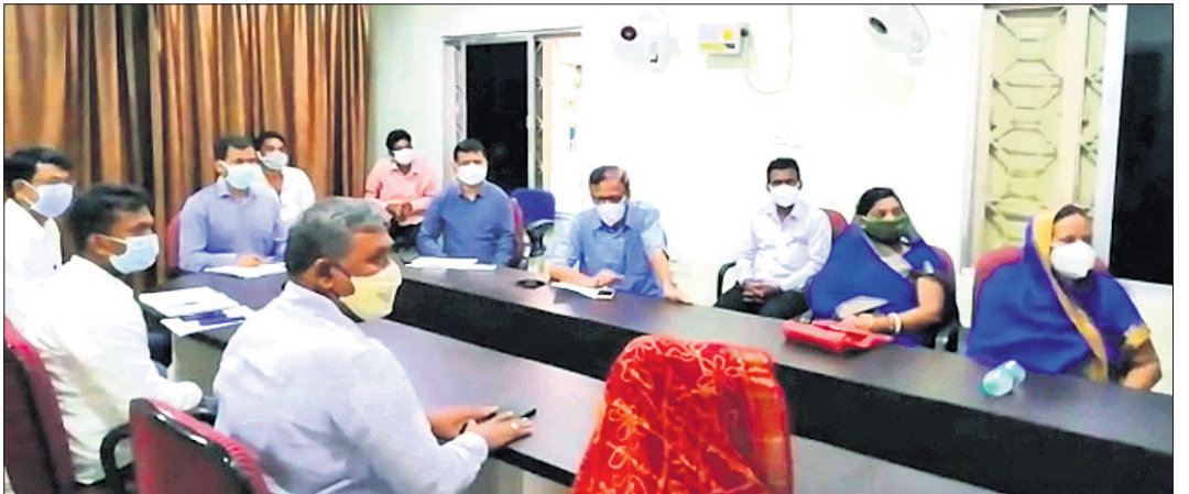
ଭିଡ଼ିଓ କନ୍ଫରେନ୍ସରେ ଭଞ୍ଜନଗରରେ ଉପସ୍ଥିତ ପ୍ରତିନିଧି ।