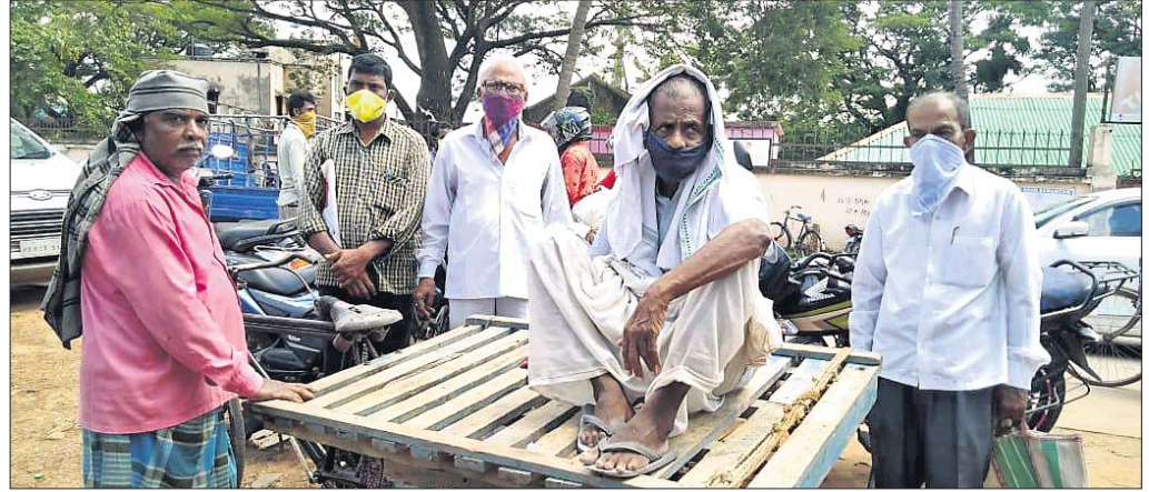
ଗ୍ରାମରେ ବୃଦ୍ଧ ବ୍ୟାକ୍ ଯାଉଛନ୍ତି।

ମୟୂରଭଞ୍ଜ ଜିଲ୍ଲା ଖୁଣ୍ଟା ବ୍ଲକ୍ରେ ଜଣେ କରୋନା ଆକ୍ରାନ୍ତଙ୍କ ରବିବାର ମୃତ୍ୟୁ ଘଟିଛି। ବ୍ଲକ୍ରେ ପ୍ରଥମ କରୋନା ଜନିତ ମୃତ୍ୟୁ ବୋଲି ସୂଚନା ଦିଆଯାଇଛି। ମୃତକ ୫୮ ବର୍ଷୀୟ ପୁରୁଷ। ଗତ ୧ ତାରିଖରେ ତାଙ୍କୁ ଉଦଳା ଉପଖଣ୍ଡ ସ୍ୱାସ୍ଥ୍ୟକେନ୍ଦ୍ରରେ ଭର୍ତ୍ତି କରାଯାଇ କରୋନା ଚେଷ୍ଟା କରାଯାଇଥିଲା। ୪ରେ ପରିଚିତ୍ତ ରିପୋର୍ଟ ଆସିବା ପରେ ତାଙ୍କୁ ବାରିପଦା ବାଳାଶୋକସ୍ଥିତ ଜିଲ୍ଲା କୋଭିଡ୍ ହସ୍ପିଟାଲକୁ ପଠାଯାଇଥିଲା। ୫ରେ ଭୁବନେଶ୍ୱରସ୍ଥିତ ଏକ କୋଭିଡ୍ ହସ୍ପିଟାଲକୁ ସ୍ଥାନାନ୍ତର କରାଯାଇଥିଲା। ୯ତାରିଖରେ ତାଙ୍କର ମୃତ୍ୟୁ ଘଟିଥିଲା।