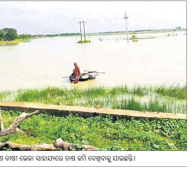
ଜଣେ ବାଷ୍ପୀ ଭେଟା ସାହାଯ୍ୟରେ ବାସ ଜମି ଦେଖିବାକୁ ଯାଉଛନ୍ତି।

ଗମ୍ଭୀର ହେବା ସହ ବାସ ଜମି ସମ୍ପୂର୍ଣ୍ଣ ରୁ ୪ ଦିନ ବର୍ଷା ହେବାର ସମ୍ଭାବନା ରହିଛି। ଅଧିକ ବର୍ଷା ଲାଗି ରହିଲେ ପରିସ୍ଥିତି ଅଧିକ ଗମ୍ଭୀର ହେବା ସହ ବାସ ଜମି ସମ୍ପୂର୍ଣ୍ଣ ରୁ ୪ ଦିନ ବର୍ଷା ହେବାର ସମ୍ଭାବନା ରହିଛି। ଏଥିପ୍ରତି ପ୍ରଶାସନ ଦୃଷ୍ଟି ଦେବାକୁ ଦାବି ହୋଇଛି।