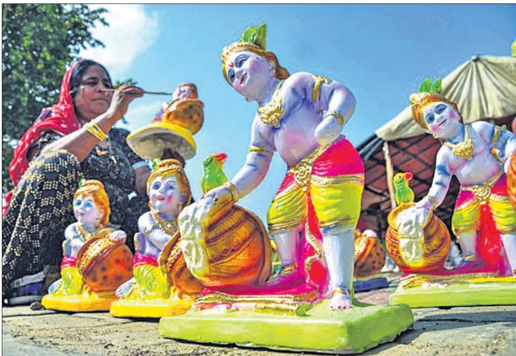
କନ୍ୟାସୁମୀ ପୂର୍ବରୁ ଅମୃତସରରେ ଭଗବାନ ଶ୍ରୀକୃଷ୍ଣଙ୍କ ମୂର୍ତ୍ତିରେ ଶେଷସର୍ଗ ଦେଉଛନ୍ତି ମହିଳା କାରିଗର।

ଓ ଆଶ୍ୱତୋଷ ଭାକ୍ତେ ଆମ୍ବୁତ୍ୟା କରିଥିଲେ ବି ମିଡିଆରେ ଏନେଇ ସେଭଳି ଚର୍ଚ୍ଚା କରାଯାଇନାହିଁ। ବିହାର ନିର୍ବାଚନ ପୂର୍ବରୁ ପୁଣି ମୃତ୍ୟୁ ଘଟଣାକୁ ଅସ୍ୱାଭାବେ ବ୍ୟବହାର କରାଯାଇଛି ଓ ମିଡିଆ ଏହାକୁ ଅତିରଞ୍ଜିତ କରୁଛି ବୋଲି ସେ ଅଭିଯୋଗ କରିଛନ୍ତି। ମାମଲାର ଶୁଣାଣି ପୂର୍ବରୁ ରିଆ ସୁପ୍ରିମକୋର୍ଟ ଯିବା ସହ ତାଙ୍କ ବିରୋଧରେ ଥିବା ମାମଲା ପାଟନାକୁ ମୁ୍ୟାଇକୁ ସ୍ଥାନାନ୍ତର କରିବା ଲାଗି ଅନୁରୋଧ କରିଛନ୍ତି। ଏଥିସହ ବିହାରରେ ରାଜନୈତିକ ଉନ୍ନତୀ ବୃଦ୍ଧି ପାଇଥିବାରୁ ପୁରୁଣା ଯୋଗାଇ ଦେବାକୁ ରିଆ ସୁପ୍ରିମକୋର୍ଟରେ ଅନୁରୋଧ କରିଛନ୍ତି। ପ୍ରକାଶଥାଉ କି, ରିଆଙ୍କ ସମେତ ଏକାଧିକ ବ୍ୟକ୍ତିଙ୍କୁ ସୋମବାର ଜେରା କରାଯାଇଛି।