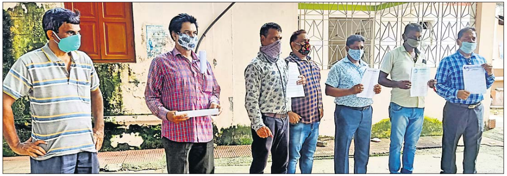
ଜିଲ୍ଲାପାଳଙ୍କ ଅଫିସ୍ ସମ୍ମୁଖରେ ବିଭିନ୍ନ ଶ୍ରମିକ ସଙ୍ଗଠନର ନେତୃବର୍ଗ।