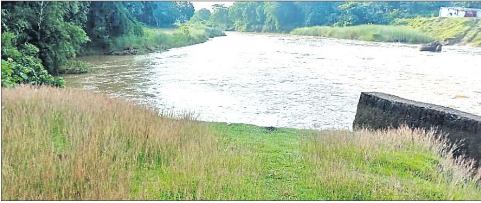
ଖଡ଼ିକାପଦାସ୍ଥିତ ଦୁଇମୁହାଣୀ ନଦୀ।