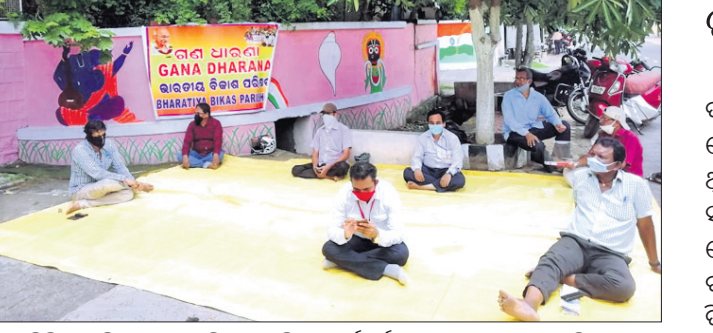
ଆରତିସିଙ୍କ ଅଫିସ୍ ଆଗରେ ବିକାଶ ପରିଷଦ୍ କର୍ମକର୍ମୀମାନେ ଧାରଣା ଦେଇଛନ୍ତି ।

ଆରତିସିଙ୍କ ଅଫିସ୍ ଆଗରେ ଧାରଣା ଗଞ୍ଜାମ ଜିଲାରେ କିରୋନା ପରିଚାଳନାରେ ପ୍ରଶ୍ନାସନ ଅନୁମତି ଦେଇଛି । ଆଜି ଶ୍ରୀକୃଷ୍ଣାଙ୍କୁ ଦୃଷ୍ଟିରେ ରଖି ସ୍ୱାମୀଜୀଙ୍କ ବକାପାତ ଓ ବୁଦ୍ଧିବଳ ନିଶ୍ଚଳପତା ଆଗ୍ରମ ଅଞ୍ଚଳରେ ୫ ଘୁଞ୍ଚନ ପୋଲିସ୍ ଫୋର୍ସ୍ ମୁତୟନ କରାଯାଇଛି । ଜିଲାର ସମସ୍ତ ଥାନାକୁ ଆଇଡି ରହିବାକୁ ନିର୍ଦ୍ଦେଶ ଦିଆଯାଇଥିବା ଏସପି ଦିନି ଥିବାକୁ ସୂଚନା ଦେଇଛନ୍ତି । ସୂଚନାଯୋଗ୍ୟ, ୨୦୦୮ ଅଗଷ୍ଟ ୨୩ କରୁଣାକାଣ୍ଡରେ ବୁଦ୍ଧିବଳ ନିଶ୍ଚଳପତା ଆଗ୍ରମରେ କରୁଣାକାଣ୍ଡର ଉତ୍ତର ପାର୍ଶ୍ୱକୁ ଗୁଲିକରି ହତ୍ୟା କରିଥିଲେ । ଏହି ଘଟଣାକୁ ନେଇ ସେ ସମୟରେ କଟକରେ ପଞ୍ଜାବୀ ପାଠ୍ୟ ପଢ଼ା ଓ ଖାଦ୍ୟ ସେବା ଯୋଜନା ପ୍ରକଳ୍ପ ପାଇଁ ଅନୁମତି ପ୍ରଦାନ କରାଯାଇଥିଲା । କଟକରେ କର୍ମୀ ସୃଷ୍ଟି ହୋଇଥିଲା ।