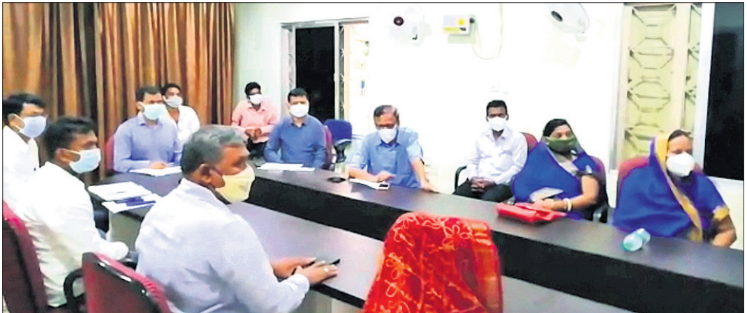
ଭିଡ଼ିଓ କନ୍ଫରେନ୍ସରେ ଭଞ୍ଜନଗରରେ ଉପସ୍ଥିତ ପ୍ରତିନିଧି ।