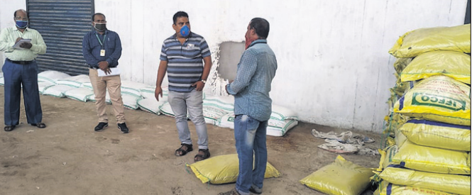
ରୁଗ୍ ପୁର ଲ୍ୟାମ୍ପସ ଗୋଦାମରେ ଷ୍ଟକ୍ ଯାଞ୍ଚ କରାଯାଇଛି।