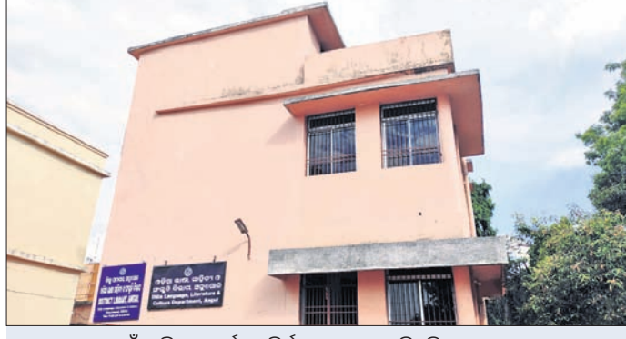
ସଂଗ୍ରହାଳୟ ପାଇଁ ଆସିଥିବା ଅର୍ଥରେ ନିର୍ମାଣ ହୋଇଥିବା ବିଲ୍ଡିଂ।

ପୁରାତନ ସଭ୍ୟତା, ଏହାର ସଂସ୍କୃତି, ଭାଷା, ଲିପି, ପୁସ୍ତକ ଆଦି ସମ୍ପର୍କରେ ଡେଇଁ ଖାନ୍ ଦେଇଥାଏ ସଂଗ୍ରହାଳୟ। ନୂତନ ଶିକ୍ଷା, ଗବେଷଣା ଦିଗରେ ଏହା ବେଶ୍ ଉପଯୋଗୀ ସାବ୍ୟସ୍ତ ହୋଇଥାଏ। ଖାସ୍ ଏହି କାରଣରୁ ପ୍ରତି ଜିଲ୍ଲାରେ ଗୋଟିଏ ଲେଖାଏ ସଂଗ୍ରହାଳୟ ଖୋଲିବା ପାଇଁ ୨୦୦୫ରେ ରାଜ୍ୟ ସରକାର ନିଷ୍ପତ୍ତି ନେଇଥିଲେ। ଏଥିରେ ଅନୁଗୋଳ ଜିଲ୍ଲା ମଧ୍ୟ ସାମିଲ ଥିଲା। ଏଥିପାଇଁ ଜିଲ୍ଲାକୁ ୨୦ ଲକ୍ଷ ଟଙ୍କାର ଅନୁଦାନ ଆସିଥିଲା। ୨୦୦୯-୧୦ରେ ଉକ୍ତ ଅର୍ଥରେ ଜିଲ୍ଲା ସୂଚନା ଓ ଲୋକ ସମ୍ପର୍କ ଭବନ ନିକଟରେ ଏକ ବିଲ୍ଡିଂ ନିର୍ମାଣ କରାଯାଇଥିଲା। ହେଲେ ୧୦ ବର୍ଷ ପରେ ବି ସେଠାରେ ସଂଗ୍ରହାଳୟଟି ପ୍ରସ୍ତୁତ କରାଯାଇପାରି ନାହିଁ। ଫଳରେ ଜିଲ୍ଲାର ମାଟିତଳୁ ମିଳିଥିବା ଓ ତାଳଚେର ରାଜବାଟିରେ