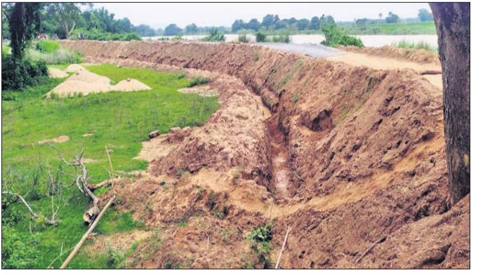
ନଦୀ ଘେରିବନ୍ଧ ପାର୍ଶ୍ୱରେ ଗାଡ଼ି ଖୋଳାଯାଇଛି।

ବରା ବ୍ଲକ ବେଳ ପ୍ରବାହିତ ଖରସ୍ରୋତା ନଦୀର ଶାଖା ଚିକ୍ଷୁଡ଼ିଆ ନଦୀ ବନ୍ଦ୍ୟା ଦାଉରୁ ବୋହୁଅ ପଞ୍ଚାୟତର ଏରଡ଼ା ଗ୍ରାମକୁ ରକ୍ଷା କରିବା ପାଇଁ ଘେରିବନ୍ଧ ନିର୍ମାଣ କରାଯାଇଥିଲା। ଏହା ଅତ୍ୟନ୍ତ ଦୁର୍ବଳ ହୋଇଯାଇ ଥିବାରୁ ଜଳସମ୍ପଦ ବିଭାଗ ପକ୍ଷରୁ ଘେରିବନ୍ଧ କଡ଼ରେ ଗାଡ଼ିଓଲ ନିର୍ମାଣ ଲାଗି ପ୍ରାୟ ୨୯ଲକ୍ଷ ଟଙ୍କା ମଞ୍ଜୁର ହୋଇଥିଲା। ଦାୟିତ୍ୱରେ ଥିବା ଠିକାଦାର ଏରଡ଼ା ସେତୁଠାରୁ କାର୍ଯ୍ୟ ଆରମ୍ଭ କରିଥିବା ବେଳେ ଘେରିବନ୍ଧ କଡ଼ରେ କେବଳ ଗାଡ଼ି ଖୋଳି କାର୍ଯ୍ୟ ବନ୍ଦ କରିଦେଇଛନ୍ତି। ଏବେ ଚିକ୍ଷୁଡ଼ିଆ ନଦୀରେ ବନ୍ଦ୍ୟା ପାଣି ପ୍ରବେଶ କରିଥିବାରୁ ନଦୀକୂଳିଆ ଲୋକେ ଆଶା ଆଶଙ୍କାରେ ଦିନ କାଟୁଛନ୍ତି। ଗ୍ରାମର ଉଭୟ ପାର୍ଶ୍ୱରେ ଏହି ନଦୀ ପ୍ରବାହିତ ହେଉଥିବା ବେଳେ କାରକ ଜନସମ୍ପଦ ତିଭିଜନ ଅଧୀନରେ ରହିଥିବା ଏହି ଘେରିବନ୍ଧ କାର୍ଯ୍ୟ ଅଧାପତ୍ତରିଆ ନେଇ ସାଧାରଣରେ ଅସନ୍ତୋଷ ପ୍ରକାଶ ପାଇଛି। ଗତି ଖର୍ଚ୍ଚକୁ ନେଇ ଗଠିତ ଏରଡ଼ା ରାଜ୍ୟ ଗ୍ରାମରେ ପାଖାପାଖି ୧୫୫୫