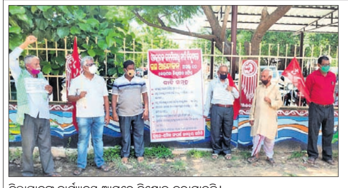
ଜିଲ୍ଲାପାଳଙ୍କ କାର୍ଯ୍ୟାଳୟ ଆଗରେ ବିରୋଧ କରାଯାଇଛି।