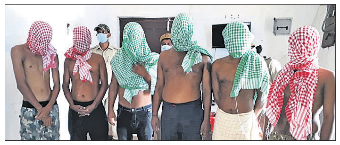
ଗିରଫ ୬ ଅଭିଯୁକ୍ତ ଓ କବଚ ସାମଗ୍ରୀ।