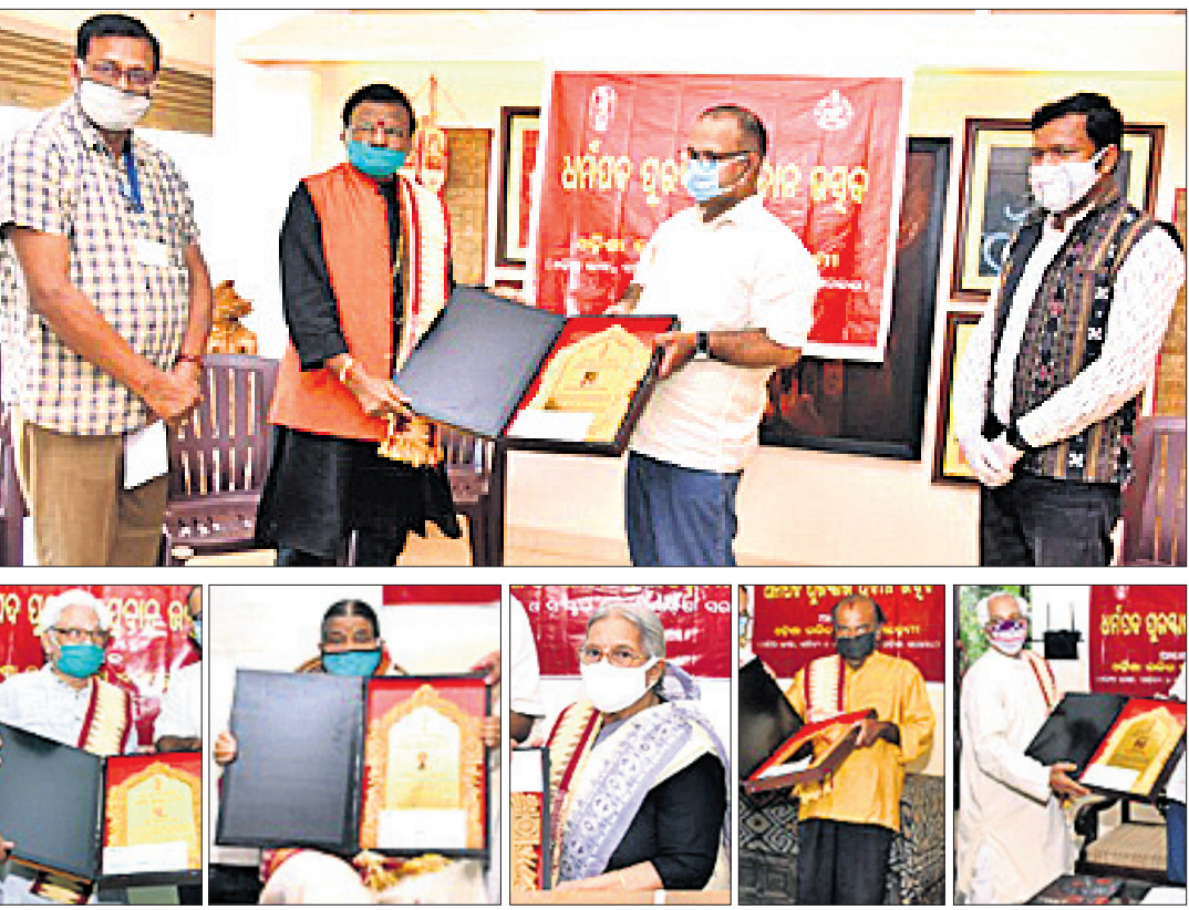
ସଂସ୍କୃତି ମନ୍ତ୍ରାଳୟ ଉପାଧ୍ୟକ୍ଷ ଶ୍ରୀମତୀ ସୁମିତ୍ରା ଦାସଙ୍କୁ ୭ ବର୍ଷ ପାଇଁ ଧର୍ମପଦ ପୁରସ୍କାର ପ୍ରଦାନ କରୁଛନ୍ତି।

ଦୃଷ୍ଟିରେ ରଖି ବିଭାଗ ପକ୍ଷରୁ କୌଣସି ଉତ୍ସବ କିମ୍ବା କାର୍ଯ୍ୟକ୍ରମ ଆୟୋଜନ କରାଯାଇନାହିଁ। ରାଜ୍ୟ ଧର୍ମପଦ ଏବଂ ଓଡ଼ିଆ ଭାଷା, ସାହିତ୍ୟ ଓ ସଂସ୍କୃତି ମନ୍ତ୍ରାଳୟ ଉପାଧ୍ୟକ୍ଷ ଶ୍ରୀମତୀ ସୁମିତ୍ରା ଦାସଙ୍କୁ ଏହି ପୁରସ୍କାର ଦିଆଯାଇଛି।