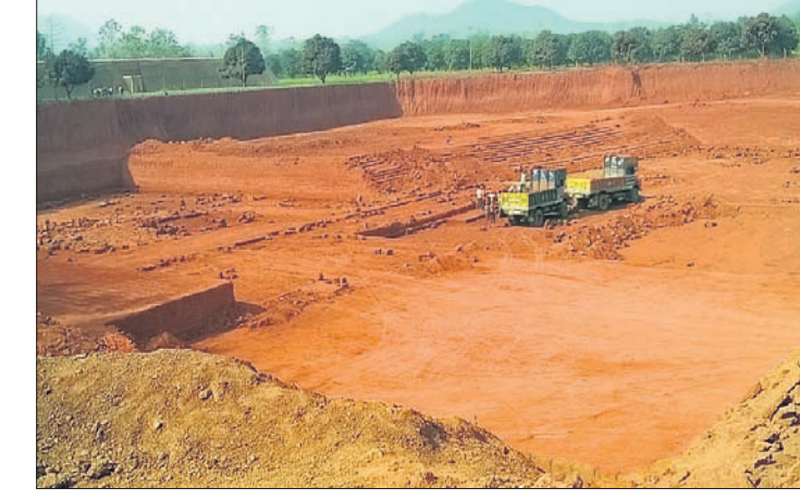
ବାଲୁଆଠାରେ ଚାଲୁଥିବା ବେଆଇନ ମାଙ୍କଡ଼ା ଖାଦାନ।

ଦର୍ପଣ ଚହସିଲ ଅଞ୍ଚଳରେ ପୁଣି ବେଆଇନ ମାଙ୍କଡ଼ା ପଥର ଖାଦାନକୁ ଚୋରା ଚାଲାଣ ଆରମ୍ଭ ହୋଇଯାଇଛି। ଦର୍ପଣ ଚହସିଲ ଅଧୀନ ବଡ଼ଶିଳା, ସାତମାଣ, ବନ୍ଧପଲ୍ଲୀ, କୋହ୍ଲା, ଗୋପାଳପୁର, ଗୁଣ୍ଡରାପତି, ଯୋରବାଟି, ବାଲୁଆ, କୋଳସାହି ଅଞ୍ଚଳରେ ୧୫ରୁ ଊର୍ଦ୍ଧ୍ୱ ଖାଦାନ ବେଆଇନ ଭାବେ ଚାଲୁଛି। ପ୍ରତିଦିନ ପାଖାପାଖି ୧୦ କେସି ସାହାଯ୍ୟରେ ମାଙ୍କଡ଼ା ପଥର ଖୋଳାଯାଇ ଶହ ଶହ ଟ୍ରକ ବାହାରକୁ ଚାଲାଣ କରାଯାଉଛି। ଚହସିଲ ପ୍ରଶାସନ ଏ ଦିଗରେ ଦୃଷ୍ଟି ଦେଇ ନ ଥିବାରୁ ରାଜ୍ୟ ସରକାର ଲକ୍ଷ୍ୟାଧିକ ଚଳାଣ ରାଜସ୍ୱ ହରାଇଛନ୍ତି। ରାଜସ୍ୱ ବିଭାଗ କିମ୍ବା ଚହସିଲ ପକ୍ଷରୁ ବେଆଇନ ଖାଦାନରେ ଚଢ଼ାଉ କରାଯାଉ ନ ଥିବା ବେଳେ ଗତ ୬ ତାରିଖରେ ବଡ଼ଚଣା ପୋଲିସ ବାଲୁଆଠାରେ ଚାଲୁଥିବା