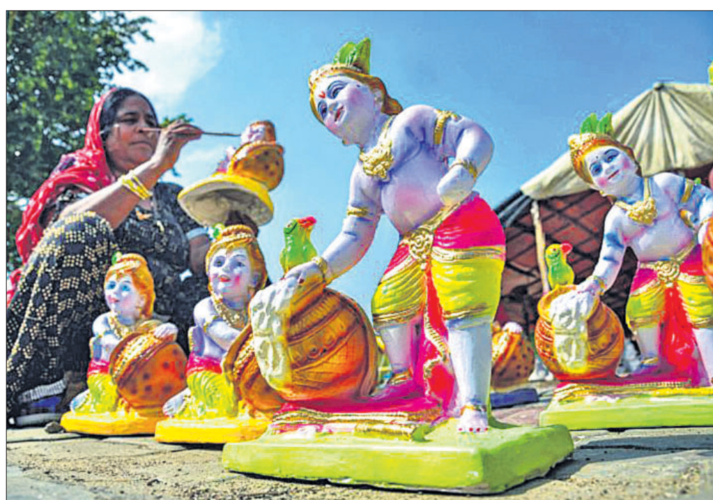
କର୍ମାଣ୍ଡୁ ପୂର୍ବରୁ ଅମୃତସରରେ ଭଗବାନ ଶ୍ରୀକୃଷ୍ଣଙ୍କ ମୂର୍ତ୍ତିରେ ଶେଷସର୍ଗ ଦେଉଛନ୍ତି ମହିଳା କାରିଗର।

ଇସ୍ଲାମାବାଦ, ୧୦।୮ (ପି.ଟି.) ଆଫଗାନିସ୍ତାନ ସୀମାନ୍ତବର୍ତ୍ତୀ ପାକିସ୍ତାନର ଏକ ସହରରେ ସୋମବାର ବିଶ୍ଵୋରଣ ଘଟି ୫ ଜଣଙ୍କ ମୃତ୍ୟୁ ହେବା ସହ ୨୦ ଜଣ ଆହତ ହୋଇଛନ୍ତି। ବେଲୁଚିସ୍ତାନ ପ୍ରଦେଶର ଚମନ ସହର ଅନ୍ତର୍ଗତ ହାଜି ନିତା ବଜାରରେ ଏହି ବିଶ୍ଵୋରଣ ଘଟିଥିବା ପୋଲିସ୍ କହିଛି। ନିଶା ନିବାରଣ ବାହିନୀର ଏକ ଗାଡ଼ିକୁ ଗର୍ଭେଟ କରି ଏହି ବିଶ୍ଵୋରଣ କରାଯାଇଥିଲା। ଦୁର୍ଭୁତମାନେ ରାସ୍ତାପାର୍ଶ୍ୱରେ ଥିବା ମୋଟରସାଇକେଲରେ ବିଶ୍ଵୋରଣ ଖଣ୍ଡିତଲେ। ପାକ୍ ପ୍ରଧାନମନ୍ତ୍ରୀ ଇମ୍ରାନ ଖାନ୍ ବିଶ୍ଵୋରଣକୁ ନିନ୍ଦା କରିବା ସହ ମୃତକମାନଙ୍କ ପାଇଁ ଦୁଃଖପ୍ରକାଶ କରିଛନ୍ତି। ଆକ୍ରମଣ ପାଇଁ କୌଣସି ସଂଗଠନ ନିକଟ୍ ଦାୟୀ କରିନାହାନ୍ତି।