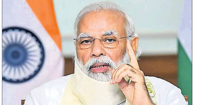
ଜିତିବ କନ୍ଫରେନ୍ସରେ ମୁଖ୍ୟମନ୍ତ୍ରୀମାନଙ୍କ ସହ ପ୍ରଧାନମନ୍ତ୍ରୀ ନରେନ୍ଦ୍ର ମୋଦିଙ୍କ ଆଲୋଚନା।