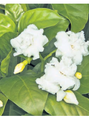
ଲମ୍ବ, ୬-୮ସେ.ମି ଓହାର ଏବଂ ୬-୮ସେ.ମି ଗଭୀର ବିଶିଷ୍ଟ ହେବା ଆବଶ୍ୟକ । ମହା ଖୋଳିବା ପରେ ସେଥିରୁ ବାହାରିଥିବା ମାଟିରେ ୫ କି.ଗ୍ରା. ୧୦ କି.ଗ୍ରା. ଶଙ୍ଖା ଗୋବର ଖତ ଭଲ ଭାବରେ ମିଶାଇ ପୁଣି ସେହି ମାଟିକୁ ମହା ମଧ୍ୟରେ ପୁରଣ କରି ଗଛ ଲଗାନ୍ତୁ ।

ମଲ୍ଲୀ ପୁଲର ବଂଶବିଘ୍ନର କଟା କଲମୀ କିମ୍ବା ଗୁଡ଼ି କଲମୀ ଦ୍ୱାରା ହୁଏ । କଟା କଲମୀ ପାଇଁ ୧୫-୨୦ ସେ.ମି ପାକଳ ତାଳ ବ୍ୟବହାର କରାଯାଏ । ପତଳି କରି କଲମୀଗୁଡ଼ିକୁ ପୋତି ଦେଲେ ଦୁଇ-ତିନି ମାସ ମଧ୍ୟରେ ତେଜ ହୋଇଯାଏ । ଅଧିକ ତଥା ଶୀଘ୍ର ତେଜ ହେବା ପାଇଁ ଇଣ୍ଡୋଲ ବ୍ୟବହାର ଏହି ୧୦୦୦ରୁ ୨୦୦୦ ପି.ପି.ଏମ. ଏକ ଦ୍ରବଣ ବା ପ୍ରଲେପରେ କଟା ତାଳରେ ମୂଳ ଅଂଶକୁ ଉପଚାର କରି ପତଳିରେ ପୋତିବୁ । ଏହା ନ ମିଳିଲେ ବଜାରରେ ମିଳୁଥିବା ସେବାତେକସ-ବି ବୃତ୍ତେକସ ହରମୋର୍ସ ପାଉଡର ବ୍ୟବହାର କରି ଏହାର ଏକ ପ୍ରଲେପ କଟା ତାଳ ମୂଳ ଅଂଶରେ ତାଳ ପୋତିବା ପୂର୍ବରୁ ପ୍ରୟୋଗ କରନ୍ତୁ । ମଲ୍ଲୀ ଗଛ ଥରେ ଲଗାଇଲେ ତାହା ଜମିରେ ୧୦-୧୫ବର୍ଷ ପର୍ଯ୍ୟନ୍ତ ରଖାଯାଇପାରିବ । ମଲ୍ଲୀ ଗଛ ଯାଧାରଣତଃ ମହାରେ ଲଗାଯାଏ । ମହାଗୁଡ଼ିକ ୬-୮ସେ.ମି ମଧ୍ୟରେ ପୁରଣ କରି ଗଛ ଲଗାନ୍ତୁ ।