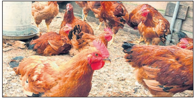
ବର୍ଷା ସମୟରେ ଛେଳି ଓ ମେଣ୍ଟାକୁ ଗୃହାଳୟରେ ରଖି ଦାନା ବା ତାଳପତ୍ର

ଟିକା ଦିଆ ନ ହୋଇଥିଲେ ପ୍ରାଣୀ ଚିକିତ୍ସକଙ୍କ ପରାମର୍ଶରେ ଏହାକୁ ଦେବାର ବ୍ୟବସ୍ଥା କରନ୍ତୁ । - ବର୍ଷାଦିନେ ଫିଙ୍ଗି ମାରିଥିବା ଦାନା କୁକୁଡ଼ାକୁ ଖାଇବାକୁ ଦିଅନ୍ତୁ ନାହିଁ । ଗୋଡ଼ାକୁ ଫିନାଇଲ୍ (୨ ପ୍ରତିଶତ) ପାଣିରେ ଛୁଡ଼ାଇବା ପରେ କୁକୁଡ଼ା ଘରକୁ ପ୍ରବେଶ କରନ୍ତୁ । କୁକୁଡ଼ା ଘର ଭିତରକୁ ବର୍ଷା ପାଣି ନ ଛାଡ଼ିବାର ବ୍ୟବସ୍ଥା କରନ୍ତୁ । ଲିଟର ଓଦା ହେଲେ କାଢ଼ି ଦିଅନ୍ତୁ ଓ ଶୁଖିଲା କୁଣ୍ଡା ବା କରତ ଗୁଣ୍ଠ ପକାନ୍ତୁ ।