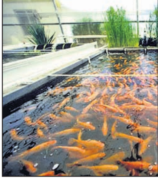
୦.୧୫୦ ଗ୍ରାମ୍ ଚିନାବାଦନ ପିଡ଼ିଆର ମିଶ୍ରଣ ପୋଖରୀରେ ପକାନ୍ତୁ । ଯାଆଁଳ ଛାଡ଼ିବାର ପରିମାଣ ଓ ଅନୁପାତ:

ବର୍ଷାଦିନରେ ପ୍ରାୟ ସବୁ ପୋଖରୀରେ ଯାଆଁଳ ଛଡ଼ାଯାଏ । କାଟିଆ ମାଛ ଯାଆଁଳ ଉପଯୁକ୍ତ ଗ୍ଳାନ ବା ଅନୁଷ୍ଠାନକୁ କିଛି ପୋଖରୀରେ ଛାଡ଼ନ୍ତୁ । ଯାଆଁଳ ଛାଡ଼ିବା ପରଠାରୁ ପୋଖରୀରେ ମାସିକ ହେକ୍ଟର ପିଛା ୨୫ କି.ଗ୍ରା. ରୁନ ପାଣିରେ ଗୋଳାଇ ଅଣ୍ଡାକରି ପୋଖରୀରେ ପକାନ୍ତୁ । ଏହାଦ୍ୱାରା ପାଣିର ଗୁଣ ବନାଏ ରହିବ । ଅତ୍ୟଧିକ ବର୍ଷା ଯୋଗୁଁ ପାଣି ଗୋଳିଆ ହେଲେ ରୁନ ପକାଇବା ଦ୍ୱାରା ପାଣି ପରିଷ୍କାର ହୋଇଯାଏ । ଖାଦ୍ୟପାଇଁ ହେକ୍ଟର ପ୍ରତି ଦୈନିକ ୧ କି.ଗ୍ରା. ୨୫୦ ଗ୍ରାମ୍ କାଞ୍ଚିଆ କୁଣ୍ଡା