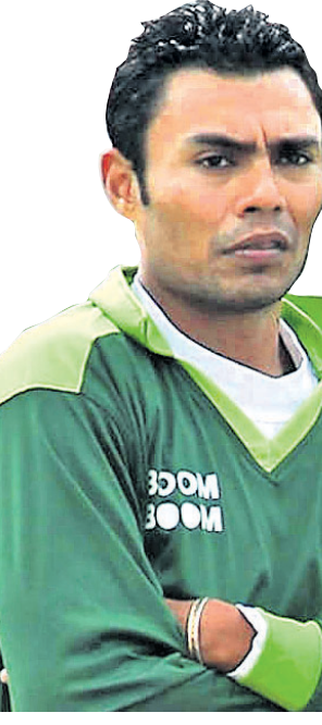
ଇସଲାମାବାଦ: ଅଯୋଧ୍ୟାରେ ରାମକ୍ଷେତ୍ର ଦର୍ଶନ କରିବାକୁ ପାକିସ୍ତାନୀ କ୍ରିକେଟର ଚାହୁଁଛନ୍ତି । ପାକିସ୍ତାନ ଜାତୀୟ ଟିମ୍ ପକ୍ଷରୁ ଅନ୍ତର୍ଜାତୀୟ ମ୍ୟାଚ୍ ଖେଳିଯାଉଥିବା ଦାନିଶ୍ କାନେରିଆ ଏକଲ ଇଚ୍ଛା ପ୍ରକାଶ କରିଛନ୍ତି । ଏନେଇ ସେ ଭାରତ ସରକାରଙ୍କୁ ଅନୁମତି ଲୋଡ଼ିବେ ବୋଲି କହିଛନ୍ତି । ସେ କହିଛନ୍ତି, ଯଦି ସୁଯୋଗ ମିଳେ ତେବେ ଅଯୋଧ୍ୟା ଆସି ରାମକ୍ଷେତ୍ର ଦର୍ଶନ କରିବେ । ଅଯୋଧ୍ୟା ଏକ ଧାର୍ମିକ ସ୍ଥଳ, ଏବେ ସେ ଏଠାକୁ ଆସିବାକୁ ଚାହୁଁଥିବା ବୁଝାନ୍ତି କି କହିଛନ୍ତି । ସେ କଣେ ହିନ୍ଦୁ ଭାବେ ପ୍ରଭୁ ରାମକ୍ଷେତ୍ର ପଥକୁ ଅନୁସରଣ କରୁଥିବା କହିଛନ୍ତି । ୩୯ ବର୍ଷ ବୟସ୍କ ଦାନିଶ୍ କାନେରିଆ ତଳେ ବେଶ୍ ଚର୍ଚ୍ଚାର ଥିଲେ । ପାକିସ୍ତାନ କ୍ରିକେଟ ଟିମ୍ରେ ଭେଦଭାବ କରାଯାଉଥିବା ଅଭିଯୋଗ ହୋଇଥିଲା । ପୂର୍ବତନ କ୍ରିକେଟର ଶୋଏବ୍ ଅଖତର୍ ଟିମ୍ରେ ଦାନିଶ୍ଙ୍କ ପ୍ରତି ଅଧିକାର କରାଯାଉଥିବା କହିଥିଲେ । ଦାନିଶ୍ ପାକିସ୍ତାନ ପକ୍ଷରୁ ଖେଳୁଥିବା ଦ୍ୱିତୀୟ ହିନ୍ଦୁ କ୍ରିକେଟର । ସେ ୭୯ ଅନ୍ତର୍ଜାତୀୟ ମ୍ୟାଚ୍ ଖେଳିଯାରିଛନ୍ତି । ସେଥି ମଧ୍ୟରେ ୬୧ ଟେଷ୍ଟ ଏବଂ ୧୮ଟି ଏକଦିନସୟା ମ୍ୟାଚ୍ ରହିଛି । ସେ ଟେଷ୍ଟରେ ୨୬୧ ରନ କଲେ ନେଇଥିବାବେଳେ ଏକଦିନସୟାରେ ୧୫ ରନ ହାସଲ କରିଛନ୍ତି ।