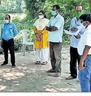
କେନ୍ଦ୍ରାପଡ଼ା ରୁକ୍ମରେ ଜିଲାପାଳଙ୍କ ଉପସ୍ଥିତିରେ ଆଦିବାସୀଙ୍କୁ ଚିକିତ୍ସା କରାଯାଇଛି

କେନ୍ଦ୍ରାପଡ଼ା ଅଫିସ୍, ୧୧।୮ କେନ୍ଦ୍ରାପଡ଼ା ଚିକିତ୍ସା କୋର୍ସ୍ ବିଭାଗରୁ ୧୧୦ ଡାକ୍ତରଙ୍କୁ କୋର୍ସ୍ରେ ନିୟମ ମାନି ଖୋଲାଯାଇପାରିବ। ରାଜ୍ୟ ସରକାର ଏ ନେଇ ବୃତ୍ତାନ୍ତ ରୂପରେଖ ପ୍ରସ୍ତୁତ କରିବା ପାଇଁ ଏକ ମାମଲାର ଶୁଣାଣି ପରେ ଉଚ୍ଚ ନ୍ୟାୟାଳୟ ନିର୍ଦ୍ଦେଶ ଦେଇଛନ୍ତି