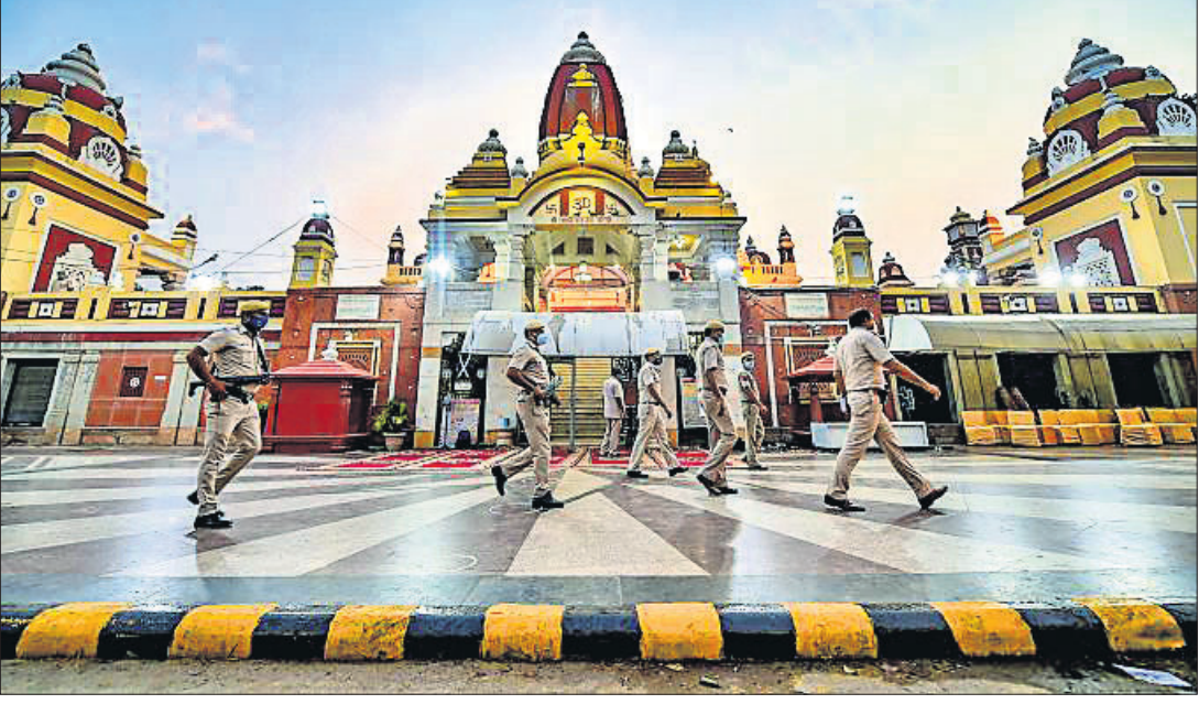
ଜନ୍ମାଷ୍ଟମୀ ପାଳନ ଅବସରରେ ନୂଆଦିଲ୍ଲୀର ଲକ୍ଷ୍ମୀ ନାରାୟଣ ବିଳା ମନ୍ଦିରରେ ପୋଲିସର କଡ଼ା ପୁରଣ।

ଲକ୍ଷ୍ମେଶ୍ୱର ଚାଉଳର ରେଳପ୍ରେ ଷ୍ଟେଶନର ଦୁଇଟି ଏଟିଏମ୍ରେ ମଙ୍ଗଳବାର ସକାଳେ ସର୍ବପୂର୍ଣ୍ଣତା ନିଆଁ ଲାଗି ଯାଇଥିଲା। ଏଟିଏମ୍ କାରଖାନା ଧୂଆଁ ବାହାରିବା ପରେ ସ୍ଥାନୀୟ ଅଞ୍ଚଳରେ ଆତଙ୍କ ଖେଳି ଯାଇଥିଲା।