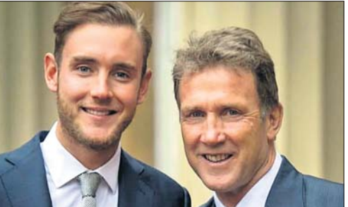
ଷୁଆର୍ଟ୍ କ୍ରିସ୍ ବ୍ରଦ୍ ।

ବୁବାଇ, ୧୧।୮ (ପି.ଟି.): ମାଜେଷ୍ଟ୍ରେଟ୍ ପ୍ରଥମ ଚେଷ୍ଟ ମ୍ୟାଚ ବେଳେ ପାକିସ୍ତାନ ସିନେ ଯାସିର ଶାହାଙ୍କ ଆଉଟ ପରେ ଆପରିଜେନଟ୍ ଭାଷା ବ୍ୟବହାର କରିଥିବାରୁ ଇଂଲଣ୍ଡ ଫାଷ୍ଟ ବୋଲର ଷୁଆର୍ଟ୍ କ୍ରିସ୍ ଦଣ୍ଡିତ ହୋଇଛନ୍ତି । ମ୍ୟାଡ୍ ରେଫରି କ୍ରିସ୍ ବ୍ରଦ୍ ଯିଏକି ଡାକ୍ ପିତା ତାଙ୍କୁ ମ୍ୟାଚ ଫିର ୧୫ ପ୍ରତିଶତ କରିମାନା କରିଛନ୍ତି । ଶନିବାର ପାକିସ୍ତାନ ଦ୍ୱିତୀୟ ଇନିଂସର ୪୬ ଚଳୁ ଓଭରରେ ଏହି ଘଟଣା ଘଟିଥିଲା । ଯାସିର ଶାହାଙ୍କ ଆଉଟ ପରେ ବ୍ରଦ୍ ଆକ୍ରମଣାତ୍ମକ ଭଙ୍ଗାରେ ପାକିସ୍ତାନ ଖେଳାଳିଙ୍କ ଉଦ୍ଦେଶ୍ୟରେ ଅନୁଚିତ ଭାଷାରେ ଚିତ୍କାର କରିଥିଲେ । ଏହାକୁ ଯେ ଆଇସିସି ଆଡରଗ ବିଧିର ଧାରା ୨.୫ ଉଲ୍ଲଙ୍ଘନ କରିଥିଲେ । ଏହି ଅପରାଧ ଯୋଗୁ ବ୍ରଦ୍ଙ୍କ ଶୁଖିଳା ରେକର୍ଡରେ ଏକ ଡିମେରିଟ୍ ପଏଣ୍ଟ ଯୋଗ କରାଯାଇ ୩ରେ ପହଞ୍ଚିଛି । ୨୪ ମାସ ମଧ୍ୟରେ ବ୍ରଦ୍ ଏଭଳି ନିୟମ ଉଲ୍ଲଙ୍ଘନ କରିଛନ୍ତି । ପୂର୍ବରୁ ସେ ଚଳିତବର୍ଷ ଜାନୁୟାରୀ ୨୭ରେ ଫ୍ଲୋରିଡାରେ ଦକ୍ଷିଣ ଆଫ୍ରିକା ବିପକ୍ଷ ଚତୁର୍ଥ ଚେଷ୍ଟ ଏବଂ ୨୦୧୮ ଅଗଷ୍ଟ ୧୯ରେ ଟେକ୍ସାସରେ ଭାରତ ବିପକ୍ଷ ତୃତୀୟ ଚେଷ୍ଟରେ ଏଭଳି ଅପରାଧ କରିଥିଲେ । ବ୍ରଦ୍ ନିଜର ଦୋଷ ସ୍ୱୀକାର କରିବା ସହ ଦଣ୍ଡକୁ ଗ୍ରହଣ କରିଛନ୍ତି । ଚେଷ୍ଟ ଶୁଣାଣିର ଆଦେଶ୍ୟକ ପଡ଼ି ନ ଥିଲା ।