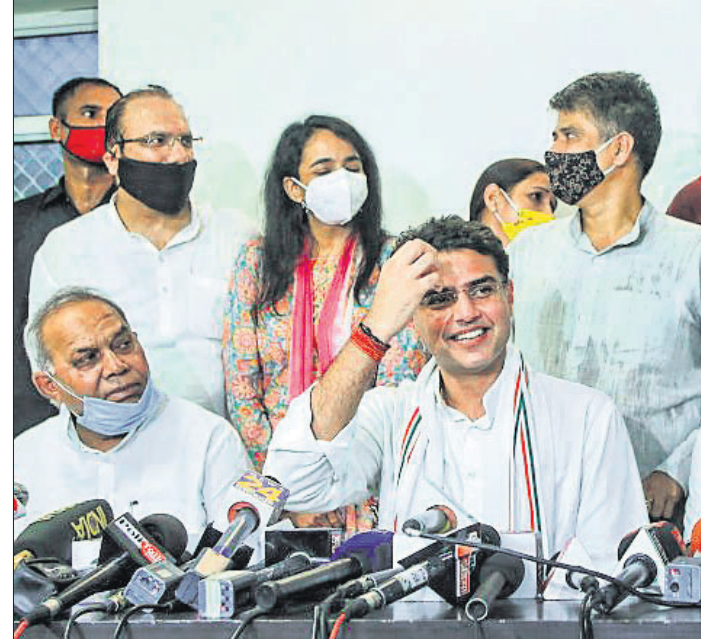
ଜୟପୁରସ୍ଥିତ ବାସଭବନରେ କଂଗ୍ରେସ ନେତା ସଚିନ ପାଇଲଟଙ୍କ ପ୍ରେସ କନ୍ଫରେନ୍ସ।

ନୂଆଦିଲ୍ଲୀ, ୧୧।୮ ରାଜନୀତିରେ ପ୍ରତିଶୋଧମୂଳକ ମନୋଭାବ ରଖିବା ଠିକ୍ ନୁହେଁ ବୋଲି କଂଗ୍ରେସ ନେତା ସଚିନ ପାଇଲଟ୍ ମଙ୍ଗଳବାର କହିଛନ୍ତି। ମାଧ୍ୟମ ପରେ ଜୟପୁର ଫେରି ସେ ଦଳରେ କେବେ କୌଣସି ପଦ ଚାହିଁ ନ ଥିଲେ ବୋଲି କହିଛନ୍ତି। ମୁଖ୍ୟମନ୍ତ୍ରୀ ଅଶୋକ ଗେହଲଟଙ୍କ ବିରୋଧରେ ବିଦ୍ରୋହ କରିବା ପରେ ସେ କଂଗ୍ରେସର ବରିଷ୍ଠ ନେତାଙ୍କୁ ସୋମବାର ଭେଟିଥିଲେ। ପରେ ସମସ୍ୟାର ସମାଧାନ ହୋଇପାରିଥିଲା। ହେଲେ କୌଣସି ରାଜନେତାଙ୍କ ବିରୋଧରେ ସେ ପଦଟିଏ କହି ନ ଥିବା ପାଇଲଟ୍ କହିଛନ୍ତି। ତାଙ୍କୁ ବର୍ତ୍ତମାନ ମୁଖ୍ୟମନ୍ତ୍ରୀ ଗେହଲଟଙ୍କଠାରୁ ଆରମ୍ଭ କରି ବିଭିନ୍ନ କଂଗ୍ରେସ ନେତା ସମାଲୋଚନା କରି ଭିନ୍ନ ଭିନ୍ନ କଥା କହିଥିବା ପାଇଲଟ୍ ପ୍ରକାଶ କରିଛନ୍ତି। ଏଭଳି ପ୍ରତିଶୋଧମୂଳକ ମନୋଭାବ ରଖି କାହା ବିରୋଧରେ ରାଜନେତାମାନେ କହିବା ଅନୁଚିତ ବୋଲି ପାଇଲଟ୍ କହିଛନ୍ତି।