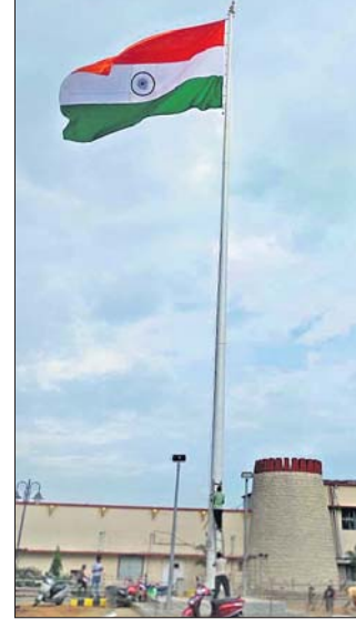
କଟକ ଅଫିସ୍, ୧୩୮୮

କଟକ ଷ୍ଟେଶନରେ ଶହେ ଫୁଟ ଉଚ୍ଚରେ ଉଡ଼ିଲା ତ୍ରିରଙ୍ଗା