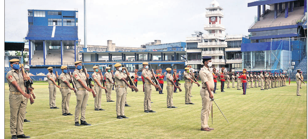
ବାରବାଟୀ ଷ୍ଟାଡ଼ିୟମରେ ପରେତ ଅଭ୍ୟାସ ଚାଲିଛି।

ପ୍ରଶାସନର କର୍ମଚାରୀ, ମେଡିକାଲ କର୍ମଚାରୀ, ପୋଲିସ୍ କର୍ମଚାରୀ, ଆଶାକର୍ମୀଙ୍କୁ ମିଶାଇ ମୋଟ ୧୬ଜଣ ଚଳିତବର୍ଷ କରୋନା ଯୋଦ୍ଧା ସମ୍ମାନରେ ସମ୍ମାନିତ ହେବେ। ପୂର୍ବରୁ ବିଭିନ୍ନ କ୍ଷେତ୍ରରେ ପାରଦର୍ଶିତା ହାସଲ କରିଥିବା ଏବଂ ସେବା, ସାହସିକତା କ୍ଷେତ୍ରରେ କେତେଜଣଙ୍କୁ ସମ୍ମାନିତ କରାଯାଏ। ମାତ୍ର ଚଳିତବର୍ଷ ଏହି ସମ୍ମାନ ଦିଆଯିବ