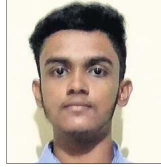
କଟକ ଅଫିସ୍, ୧୩୮୮

ଲିକ୍‌ଚରାତନ୍ତ୍ରିତ ସରସ୍ୱତୀ ଜୁନିୟର ବିଜ୍ଞାନ ମହାବିଦ୍ୟାଳୟ ଚଳିତବର୍ଷ ଯୁକ୍ତପୁର ପରୀକ୍ଷାରେ ଅତୁଟପୂର୍ଣ୍ଣ ସଫଳତା ହାସଲ କରିଛି। ମହାବିଦ୍ୟାଳୟରେ ପାଠ୍ୟ