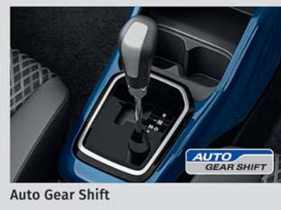
Auto Gear Shift