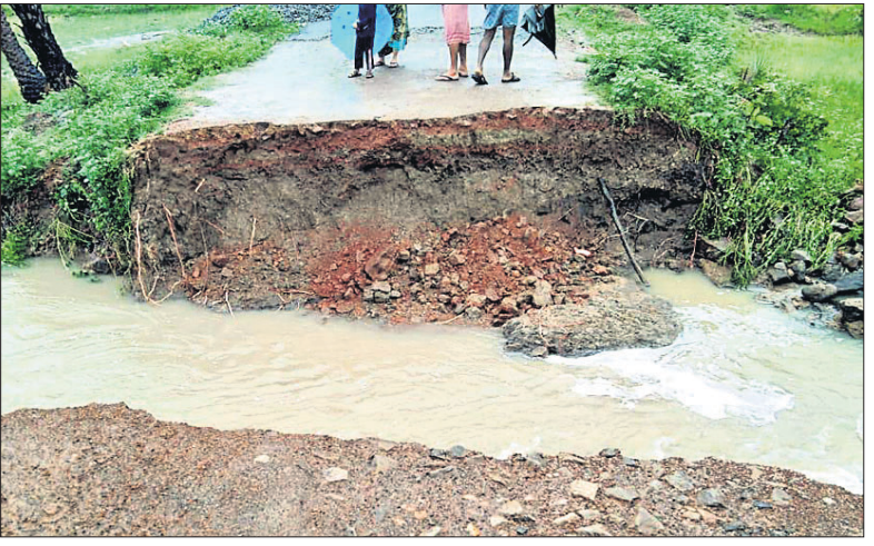
ପ୍ରବଳ ବନ୍ୟାରେ ବୁଧବାର ରାତିରେ ମାଲକାନଗିରି ଜିଲ୍ଲା କାଲିମେଳା ବ୍ଲକ୍ ବେଢ଼ିଙ୍ଗାଓଡ଼ା ପଞ୍ଚାୟତର ଏମପିଏ-୨୦ରୁ ପ୍ରଧାନମନ୍ତ୍ରୀ ଗ୍ରାମ ସଡ଼କ ଯୋଜନାରେ ନିର୍ମିତ ରାସ୍ତା ଧୋଇ ହୋଇଯାଇଛି।

ମାଲକାନଗିରି ଜିଲ୍ଲାରେ ଗତ ୫ ଦିନ ଧରି ପ୍ରବଳ ବନ୍ୟା ହେବା ଯୋଗୁଁ ଜିଲ୍ଲାରେ ବନ୍ୟା ପରିସ୍ଥିତି ସୃଷ୍ଟି ହୋଇଛି। ଜିଲ୍ଲାର ବିଭିନ୍ନ ସ୍ଥାନକୁ ଯୋଗାଯୋଗ ବିଚ୍ଛିନ୍ନ ହୋଇଛି।