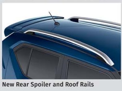
New Rear Spoiler and Roof Rails