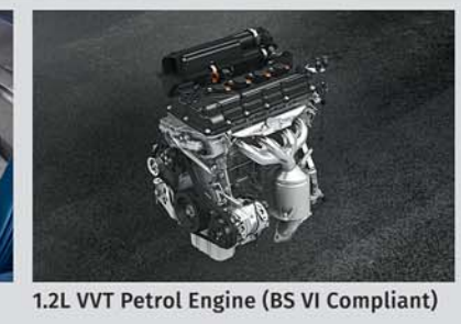
1.2L VVT Petrol Engine (BS VI Compliant)

NEXA Safety Shield ■ DUAL FRONT AIRBAGS ■ ABS WITH EBD ■ PEDESTRIAN PROTECTION COMPLIANCE ■ FULL FRONTAL IMPACT COMPLIANCE, FRONTAL OFFSET IMPACT COMPLIANCE, SIDE IMPACT COMPLIANCE