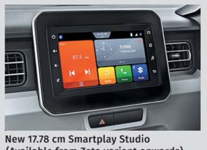
New 17.8 cm Smartplay Studio (Available from Zeta variant onwards)

Scan the QR code for more details about the New Ignis.