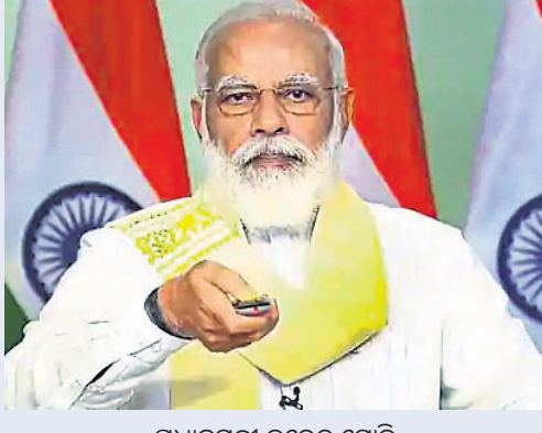
ପ୍ରଧାନମନ୍ତ୍ରୀ ନରେନ୍ଦ୍ର ମୋଦି

■ 'ଗ୍ରାନ୍ଥପରେଷ୍ଟ ଟାକ୍ସେସନ-ଅନର୍ସ' ଦି ଅନେଷ୍ଟ ପ୍ଲାଟଫର୍ମ' ଶୁଭାରମ୍ଭ ■ ଟାକ୍ସ ଆସେସମେଣ୍ଟ, ଅପିଲ୍ ହେବ ଫେସଲେସ୍