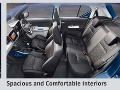
Spacious and Comfortable Interiors