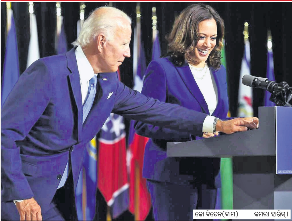
ଜୋ ବିଡେନ(ବାମ) କମଳା ହାରିସ।

ଗୋଟିଏ ମଞ୍ଚରେ ରାଷ୍ଟ୍ରପତି ଓ ଉପରାଷ୍ଟ୍ରପତି ପ୍ରାର୍ଥା: ଗୁମ୍ପଙ୍କ ଚିଠା ଖୋଲିଲେ