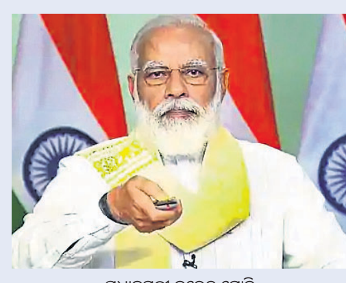
ପ୍ରଧାନମନ୍ତ୍ରୀ ନରେନ୍ଦ୍ର ମୋଦି