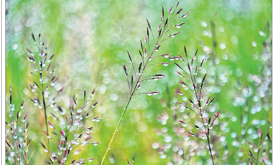
ଅନୁଗୋଳରେ ଗୁରୁବାର ବର୍ଷା ଛାଡ଼ିବା ପରେ ଘାସ ଫୁଲରେ ପାଣି ବୁଦା ଲାଗିରହିଛି।