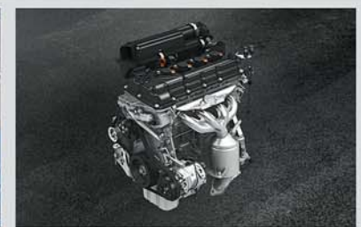
1.2L VVT Petrol Engine (BS VI Compliant)