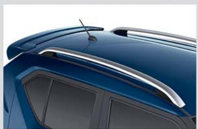
New Rear Spoiler and Roof Rails