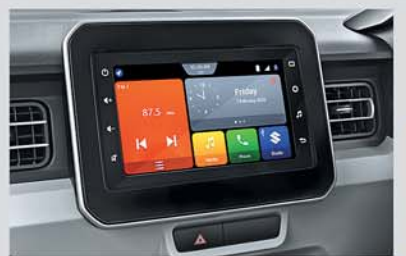
New 17.78 cm Smartplay Studio (Available from Zeta variant onwards)

Scan the QR code for more details about the New Ignis.