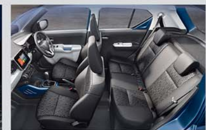
Spacious and Comfortable Interiors