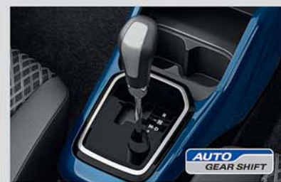
Auto Gear Shift