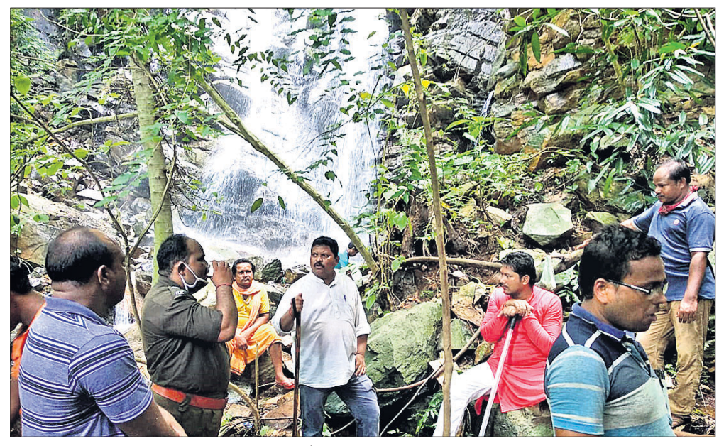
ମାଲ୍ୟଗିରି ପର୍ବତମାଳା ଉପରେ ଚେକଡ଼୍ୟାମ୍ ନିର୍ମାଣ ପାଇଁ ଗୁଡ଼ିଆନ କରାଯାଉଛି।