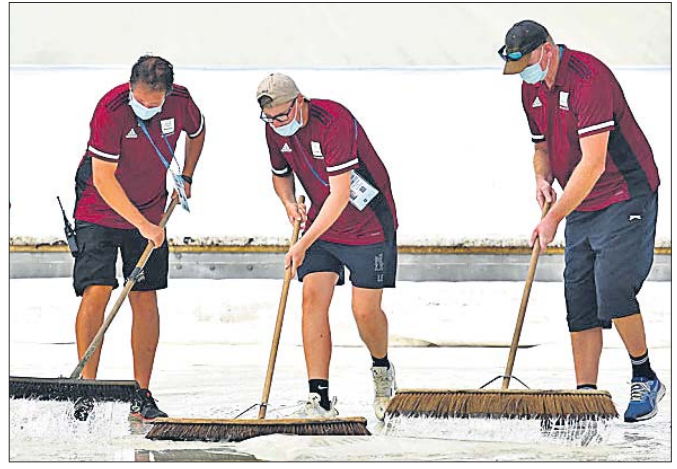
ବର୍ଷା ପରେ ରୋଜ ବାଓଲ ଷ୍ଟାଡ଼ିୟମରେ ଗ୍ରାଉଣ୍ଡସ୍ୱାଧୀନେ ଜଳ ନିଷ୍କାସନ କରୁଛନ୍ତି।

ସ୍ଥାନୀୟ ରୋଜ ବାଓଲ ଗ୍ରାଉଣ୍ଡରେ ଗୁରୁବାରଠାରୁ ଇଂଲଣ୍ଡ ଓ ଭ୍ରମଣକାରୀ ପାକିସ୍ତାନ ମଧ୍ୟରେ ଦ୍ୱିତୀୟ କ୍ରିକେଟ ଟେଷ୍ଟ ମ୍ୟାଚ ଆରମ୍ଭ ହୋଇଛି। ଚମ୍ପି କିଟି ପାକିସ୍ତାନ ପ୍ରଥମେ ବ୍ୟାଟିଂ କରିବାକୁ ନିଷ୍ପତ୍ତି ନେଇଛି। ପ୍ରଥମ ଦିବସରେ ବର୍ଷା କାରଣରୁ ଖେଳ ବାଧାପ୍ରାପ୍ତ ହୋଇଛି। ରିପୋର୍ଟ ଲେଖା ହେଲା ବେଳକୁ ପାକିସ୍ତାନ ୪୫ ଓଭରରେ ୫ ଉଇକେଟ ହରାଇ ୧୨୪ ରନ କରିଛି। ତାରକା ବ୍ୟାଟ୍ସମ୍ୟାନ ବାବର ଆଜମ୍ ୨୪ ଓ ମହମ୍ମଦ ରିଜ୍ୱାନ ୩ ରନ କରି ବ୍ୟାଟିଂ ଜାରି ରଖିଛନ୍ତି। ଶାନ ମାସୁଦ୍ ୧ ରନ କରି ପ୍ରଥମେ ଆଉଟ ହୋଇଥିବା