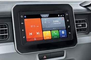
New 17.8 cm Smartplay Studio (Available from Zeta variant onwards)

Scan the QR code for more details about the New Ignis.