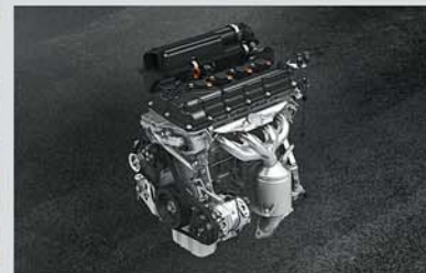
1.2L VVT Petrol Engine (BS VI Compliant)