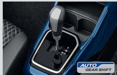
Auto Gear Shift