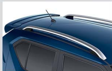
New Rear Spoiler and Roof Rails