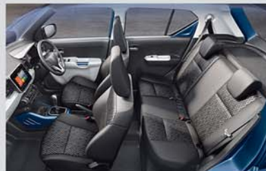
Spacious and Comfortable Interiors