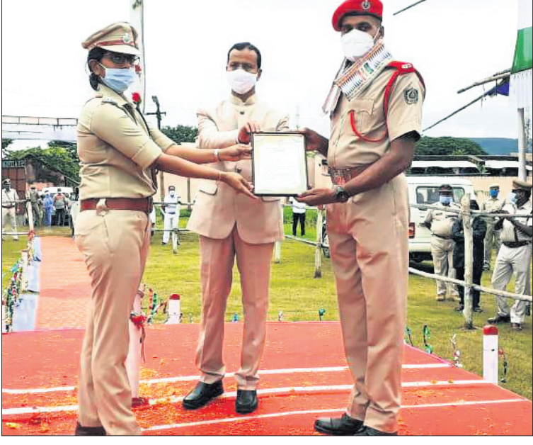
ଅଗ୍ରଗଣ ବିଭାଗର ଜଣେ କରୋନା ଯୋଦ୍ଧାଙ୍କୁ ସମ୍ମାନିତ କରାଯାଇଛି।

ଗୁଣାପୁର ବିଭାଗର ଜଣେ କରୋନା ଯୋଦ୍ଧାଙ୍କୁ ସମ୍ମାନିତ କରାଯାଇଛି।