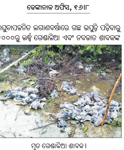
ମୃତ ଗେଣ୍ଡାଲିଆ ଶାବକ ।