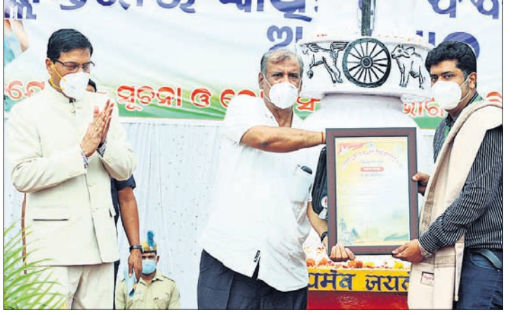
ଜଣେ କରୋନା ଯୋଧାଙ୍କୁ ମନ୍ତ୍ରୀ ସମର୍ଥନ କରୁଛନ୍ତି।