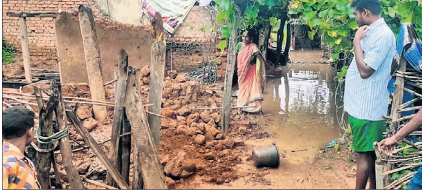
ବର୍ଷା ପାଣି ପଶିଯିବା ଯୋଗୁ ଏକ ଘରର କାନ୍ଧ ଭାଙ୍ଗିଯାଇଛି।