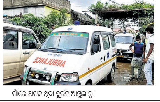
ଗାଁରେ ଅଟକି ଥିବା ଗୁରୁତ୍ୱ ଆମ୍ବୁଲାନ୍ସ।

ଅନୁଗୋଳ ଅଫିସ୍, ୧୬/୮ ଅନୁଗୋଳ ଥାନା ଅଞ୍ଚଳର ଏକ ଗାଁରେ କୋଭିଡ୍ ରିପୋର୍ଟ ଓ ସଂକ୍ରମିତଙ୍କୁ ଡାକ୍ତରଖାନା ନେବାକୁ କେନ୍ଦ୍ର କରି ରବିବାର ଅପରାହ୍ନରେ ଉତ୍ତେଜନା ଦେଖାଦେଇଥିଲା।