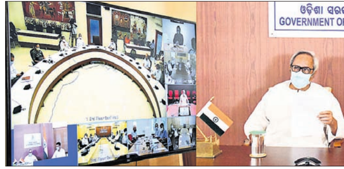
ଭିଡିଓ କନ୍ଫରେନ୍ସ କରିଆରେ ଆୟୋଜିତ ବୈଠକରେ ମୁଖ୍ୟମନ୍ତ୍ରୀ ନବୀନ ପଟ୍ଟନାୟକ।

ମୁଖ୍ୟମନ୍ତ୍ରୀ ନବୀନ ପଟ୍ଟନାୟକ ମଙ୍ଗଳବାର ଭିଡିଓ କନ୍ଫରେନ୍ସ କରିଆରେ ଅନୁଷ୍ଠିତ ଉଚ୍ଚସ୍ତରୀୟ ବୈଠକରେ ରାଜ୍ୟର କୋଭିଡ୍ ପରିସ୍ଥିତି ଓ ରଣନୀତି ନେଇ ସମୀକ୍ଷା କରିଛନ୍ତି। ଖୋର୍ଦ୍ଧା, କଟକ, ସୁନ୍ଦରଗଡ଼ ଓ ରାୟଗଡ଼ା ଜିଲାରେ ଆଞ୍ଚଳିକଭିତ୍ତିକ ରଣନୀତି ଅବଲମ୍ବନ କରିବା ପାଇଁ ମୁଖ୍ୟମନ୍ତ୍ରୀ ଏଥିରେ ପରାମର୍ଶ ଦେଇଛନ୍ତି।