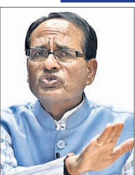
ଶିବରାଜ ସିଂ ଚୌହାନ