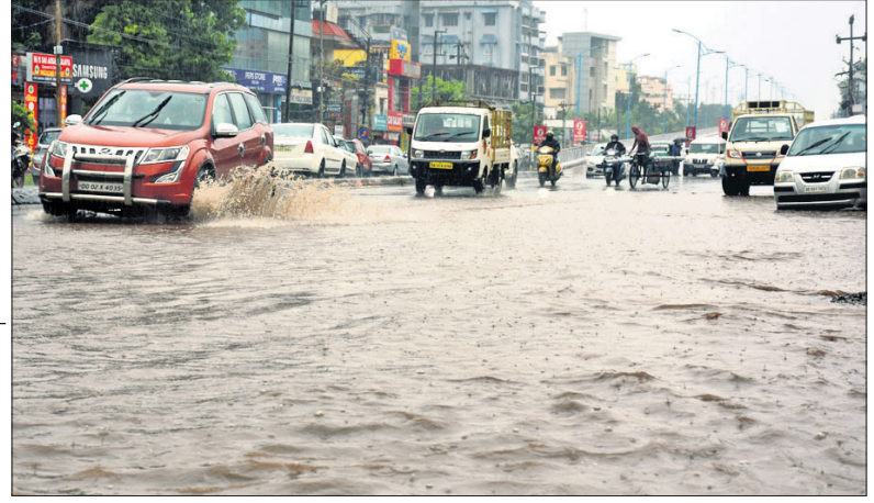
ବୁଧବାର ଲଗାଣ ବର୍ଷା ଯୋଗୁ ଭୁବନେଶ୍ୱର ବନିଖାଲ ଅଞ୍ଚଳ ଜଳମଗ୍ନ।