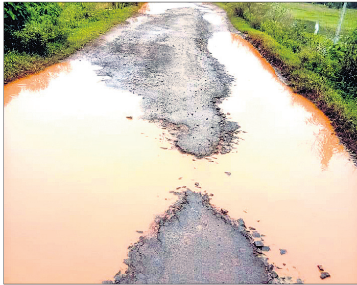
ଦେବୁଟି ପୂର୍ବ ବିଭାଗ ରାସ୍ତା

ଯତନ, ଚାରଭାଟିଆ ଡିଭିଜନ ଉପରେ ରହି ନିଜା ପ୍ରଶାସନର କର୍ତ୍ତୃତ୍ୱ