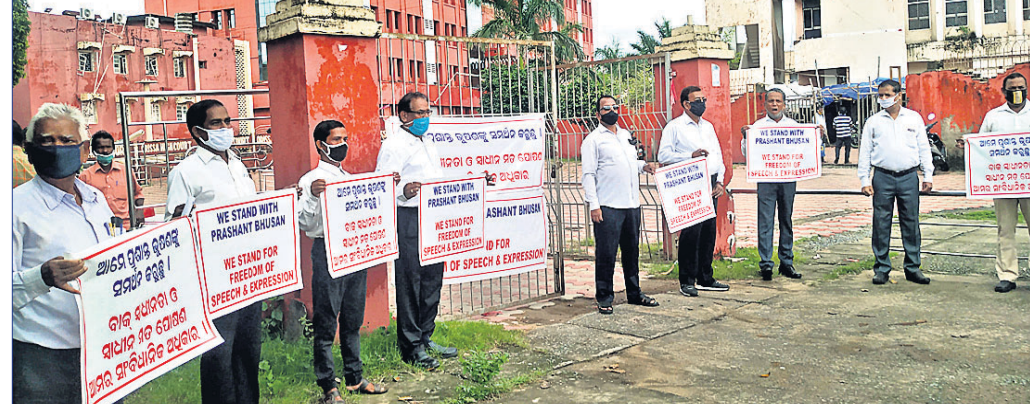
ଆଇନଜୀବୀ ପ୍ରଶାନ୍ତ ଭୂଷଣଙ୍କ ସମର୍ଥନରେ ହାଇକୋର୍ଟ ବାକ୍ ସମ୍ମୁଖରେ ଆଇନଜୀବୀମାନଙ୍କ ନୀରବ ପ୍ରତିବାଦ ।

ସୁପ୍ରିମକୋର୍ଟ ଅବମାନନା ମାମଲାରେ ଦୋଷୀ ସାବ୍ୟସ୍ତ ହୋଇଥିବା ବଚ୍ଚେ ଆଇନଜୀବୀ ପ୍ରଶାନ୍ତ ଭୂଷଣଙ୍କ ପ୍ରତି ଓଡ଼ିଶା ସମର୍ଥନ ଦେବାରେ ଲାଗିଛି । ଆଇନଜୀବୀ ପ୍ରଶାନ୍ତ ଭୂଷଣଙ୍କ ସମର୍ଥନରେ ବହୁ ଆଇନଜୀବୀ ଓଡ଼ିଶା ହାଇକୋର୍ଟ ସମ୍ମୁଖରେ ଏକାଠି ହୋଇ ନୀରବ ପ୍ରତିବାଦ ଜଣାଇଛନ୍ତି । ଏଥିସହ ଅଭିଭାବକ ଓ ବାକ୍ ସାଧନତାର ସୁରକ୍ଷା ଦାବି କରିଛନ୍ତି । ପ୍ରତିବାଦକାରୀ ଆଇନଜୀବୀମାନେ କହିଛନ୍ତି, କରୋନା ମହାମାରୀ ଭଳି ବିପଦ ସମୟରେ ଏକ ଗୁରୁତ୍ୱବହୀନ ମାମଲାରେ ସୁପ୍ରିମକୋର୍ଟ ସମର୍ଥନ ପ୍ରଦାନ କରିବା ଏବଂ ନୀରବକାଳୀନ ପ୍ରକାଶରେ ସାମ୍ପାଦନିକ ଅଧିକାର ନଥିବାରୁ ଆଇନଜୀବୀ ପାଇଁ ଉଦ୍ୟମ ହେବା ବିଧିବଦ୍ଧ ଭାବେ ଅସମ୍ଭବ ସୂଚନା । ଆଇନଜୀବୀ ପ୍ରଶାନ୍ତ ଭୂଷଣଙ୍କୁ ବିଚାରକୁ ନେଇ ଚଳିଥିବା ମାମଲାରେ କୋର୍ଟ ଅବମାନନା ମାମଲା ନେଇ ଦୋଷୀ ସାବ୍ୟସ୍ତ କରିବା, ନିଜ ପକ୍ଷ