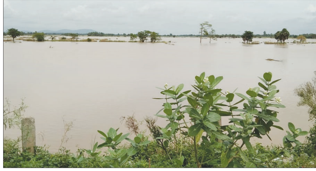
ଦୟା ଓ ମକରାନଦୀର ମଧ୍ୟବର୍ତ୍ତୀ ଅଞ୍ଚଳ ବୁଡ଼ିଯାଇଛି।

୪ଦିନ ଧରି ଲାଲୁଚାପ ବର୍ଷା ଲାଗିରହିବା ଏବଂ ବନ୍ୟାଜଳ ଆସିବା ଦ୍ୱାରା କଣାସ ବ୍ଲକ୍‌ରେ ପ୍ରବାହିତ ହେଉଥିବା ଦୟାନଦୀ ଏବଂ ଶାଖାନଦୀ ରାଜୁଆ, ମକରା, କାଣିଆ, ଲୁଣାନଦୀର ଜଳପତନ ବୃଦ୍ଧି ପାଇବାରେ ଲାଗିଛି। କଣାସଠାରେ ଦୟାନଦୀର ବିପଦସଙ୍କେତ ୩.୯୯ମି. ଥିବାବେଳେ ଗୁରୁବାର ଦୟାନଦୀର ଜଳପତନ ବୃଦ୍ଧି ପାଇ ୪.୧୯ମି. ପ୍ରବାହିତ ହେଉଥିବା ଦେଖାଯାଇଛି। ଫଳରେ ଦୟା ଓ ରାଜୁଆ ନଦୀର ମଧ୍ୟବର୍ତ୍ତୀ ଅଞ୍ଚଳ ଦୋକନ୍ଦା, ବଡ଼ାସ, ଗଡ଼ବଳଭଦ୍ରପୁର ପଞ୍ଚାୟତର ଦୋକନ୍ଦା, ବାଲିପାଟଣା, ତରପଡ଼ା, ବଡ଼ାସ, କଣାଭୁବପ୍ର, ବୈଦ୍ୟନାଥପାଟଣା, ସବଳଙ୍ଗ, ଚେତୁଳିମୁଳ, ଗଡ଼ବଳଭଦ୍ରପୁର ଗ୍ରାମର ଧାନକମି ଉପରେ ୬ରୁ ୭ଫୁଟ ବନ୍ୟାଜଳ ରହିଛି। ଉକ୍ତ ଜମିରୁଡ଼ିକରେ ଚାଷୀମାନେ ଅଧିକ ସଂଖ୍ୟାରେ କଖାଳୁ, ଦାଜଗଣ, କଲରା, ପୋଟଳ,