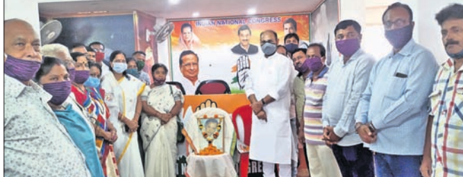
କାର୍ଯ୍ୟକ୍ରମରେ ଉପସ୍ଥିତ କଂଗ୍ରେସ କର୍ମୀ ଓ ନେତୃବୃନ୍ଦ ।