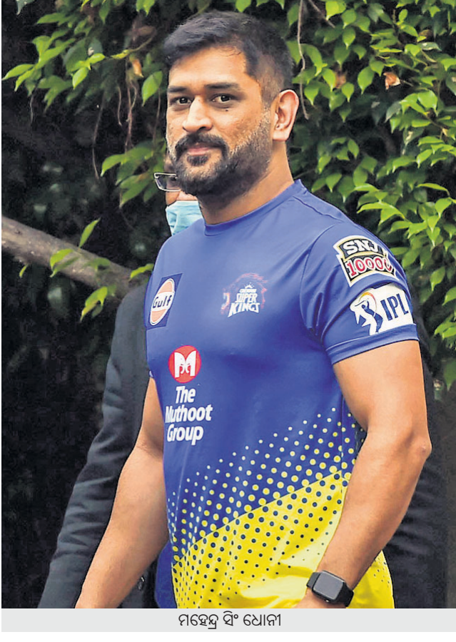
ମହେନ୍ଦ୍ର ସିଂ ଧୋନୀ