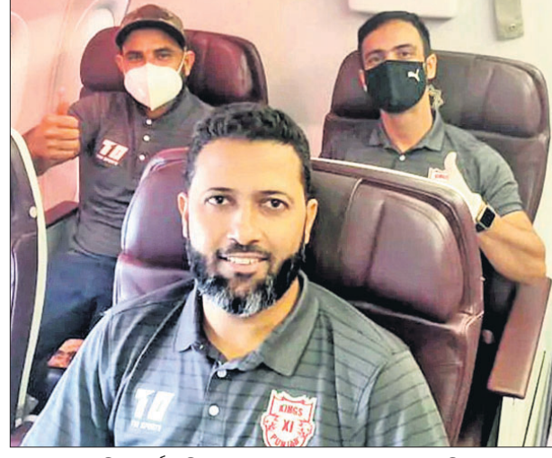
ଧୁଏଇ ଯିବା ପୂର୍ବରୁ କିଛି ଇଲେଭେନ ପଞ୍ଜାବ ଦଳର ଖେଳାଳିମାନେ ।