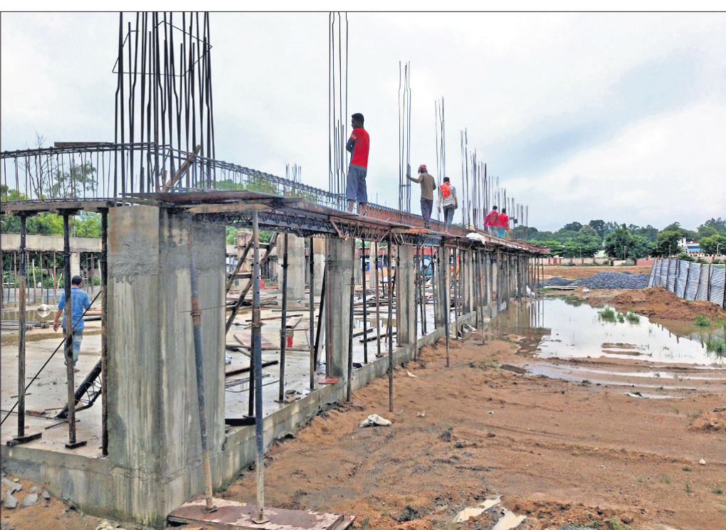
ଜିଲ୍ଲା ଖଣିଜ ପ୍ରତିଷ୍ଠାନ ପାଣ୍ଡିରେ ଭବାନୀ ଭବନ ଖେଳପଡ଼ିଆରେ କ୍ରୀଡ଼ା ଭିତ୍ତିକ୍ରମି ପ୍ରକଳ୍ପ ନିର୍ମାଣ କାର୍ଯ୍ୟ ଚାଲିଛି ।