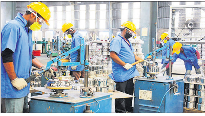
ସରକାର ଯୋଗ୍ୟ କରିଥିଲେ ଏମ୍ପ୍ଲଏମେଣ୍ଟକୁ ସହାୟତା ଯୋଗ୍ୟ ମହାମାରୀ ଯୋଗୁଁ କ୍ଷତିଗ୍ରସ୍ତ ହୋଇଥିବା ଲକ୍ଷ୍ୟରେ ଏଭଳି ଯୋଜନା ଆସିଥିଲା ।

ସାରା ଦେଶରେ କ୍ଷୁଦ୍ର ସଂସ୍ଥାକୁ ୧ ଲକ୍ଷ କୋଟିର ରଣ ସହାୟତା ଏହି ଯୋଜନାରେ ସାରା ଦେଶରେ ଏମ୍ପ୍ଲଏମେଣ୍ଟକୁ ୧ ଲକ୍ଷ କୋଟି ଟଙ୍କାକୁ ଉର୍ଦ୍ଧ୍ୱ ଅର୍ଥ ଯୋଗାଇ ଦିଆଯାଇଛି । ଉଭୟ ରାଷ୍ଟ୍ରପତିଙ୍କ ଏବଂ ଘରୋଇ ବ୍ୟାଙ୍କଗୁଡ଼ିକ ୧.୫ ଲକ୍ଷ କୋଟି ଟଙ୍କାର ଅର୍ଥ କ୍ଷୁଦ୍ର ଶିଳ୍ପକୁ ମାଧ୍ୟମରେ ଦେଇଥିବା ଅର୍ଥ ମନୁଶାଳୟ ପକ୍ଷରୁ ସୁଚନା ରହିଛି । ଏହି ଅର୍ଥ ମଧ୍ୟରୁ ପ୍ରାୟ ୧ ଲକ୍ଷ କୋଟି ଟଙ୍କା ପ୍ରଦାନ କରାଯାଇଛି । ଆମ୍ଭନିର୍ଦ୍ଧାରଣ ପ୍ୟାକେଜ ଅଧୀନରେ ଏହି ଯୋଜନାକୁ