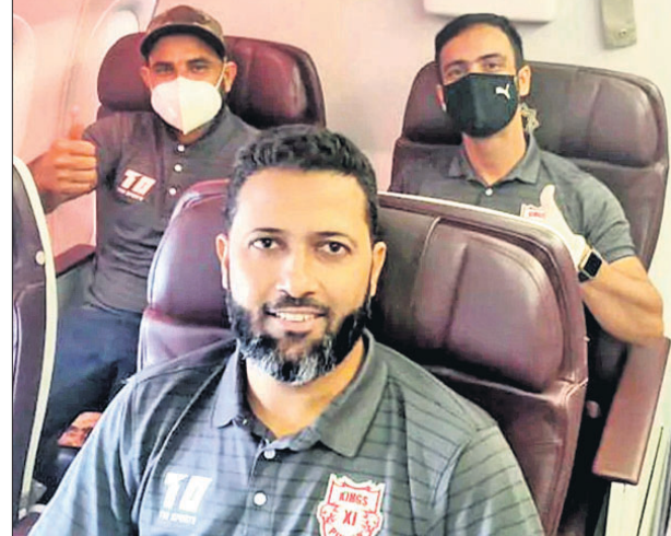
ଧୂସର ଯିବା ପୂର୍ବରୁ କିଙ୍ଗ୍ ଇଲେଭେନ ପଞ୍ଜାବ ଦଳର ଖେଳାଳିମାନେ ।

ନୂଆଦିଲ୍ଲୀ, ୨୦୮ (ପି.ଟି.): ଇଣ୍ଡିଆନ ପ୍ରିମିୟର ଲିଗ୍ (ଆଇପିଏଲ୍)ରେ ଭାଗ ନେବା ପାଇଁ କିଙ୍ଗ୍ ଇଲେଭେନ ପଞ୍ଜାବ, କୋଲକାତା ନାଇଟ ରାଇଡର୍ସ ଓ ରାଜସ୍ଥାନ ରୟାଲ୍ସ ଦଳ ଗୁରୁବାର ଯୁନାଇଟେଡ ଆରବ ଏମିରେଟ୍ସ(ଧୂସର)ରେ ପହଞ୍ଚିଛନ୍ତି । ରୟାଲ୍ସ ଓ କିଙ୍ଗ୍ ଇଲେଭେନ ଦଳ ଦୁବାଇରେ ଏବଂ ନାଇଟ ରାଇଡର୍ସ ଦଳ ଆବୁଧାବିରେ ଅବସ୍ଥାନ କରିବ । ଯିବା ପୂର୍ବରୁ ଖେଳାଳିଙ୍କର ଏକାଧିକାଂଶ କୋଭିଡ୍-୧୯ ଟେଷ୍ଟ ହୋଇଛି । ଧୂସରରେ ଖେଳାଳିମାନେ ୬ ଦିନ ପାଇଁ ଆଇସୋଲେସନରେ ରହିବେ । ଏହି ଅବସରରେ ପ୍ରଥମ, ୩ୟ ଓ ୬ଷ୍ଠ ଦିନ ସେମାନଙ୍କର କୋଭିଡ୍ ଟେଷ୍ଟ ହେବ । ରିପୋର୍ଟ ନେଗେଟିଭ୍ ଆସିଲେ ସେମାନେ ଜେବ ସୁରକ୍ଷିତ ପରିବେଶରେ ଟ୍ରେନ୍ ଆରମ୍ଭ କରିପାରିବେ । ସେପ୍ଟେମ୍ବର ୧୯ରୁ ଏହି ଲିଗ୍ ଆରମ୍ଭ ହେବ । ଚୂନାମେଣ୍ଟର ପ୍ରତି ୫ ଦିନରେ ଥରେ ଖେଳାଳି ଓ ସପୋର୍ଟ ସ୍ଟାଫ୍ଙ୍କର କୋଭିଡ୍ ଟେଷ୍ଟ ହେବ ।