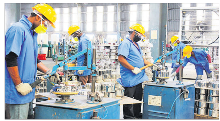
ସରକାର ଯୋଷଣା କରିଥିଲେ । ଏମ୍‌ଏସ୍‌ଏମ୍‌ଇକୁ ସହାୟତା ଯୋଗାଇ ମହାମାରୀ ସୋରୁ କ୍ଷତଗ୍ରସ୍ତ ହୋଇଥିବା ଲକ୍ଷ୍ୟରେ ଏଭଳି ଯୋଜନା ଆସିଥିଲା ।

ଏହି ଯୋଜନାରେ ସାରା ଦେଶରେ ଏମ୍‌ଏସ୍‌ଏମ୍‌ଇକୁ ୧ ଲକ୍ଷ କୋଟି ଟଙ୍କାରୁ ଉର୍ଦ୍ଧ୍ୱ ଅର୍ଥ ଯୋଗାଇ ଦିଆଯାଇଛି । ଉକ୍ତ ରାଷ୍ଟ୍ରପତି ଏବଂ ଘରୋଇ ବ୍ୟାଙ୍କଗୁଡ଼ିକ ୧.୫ ଲକ୍ଷ କୋଟି ଟଙ୍କାର ଅର୍ଥ କ୍ଷୁଦ୍ର ଶିଳ୍ପକୁ ମଞ୍ଜୁରୀ ଦେଇଥିବା ଅର୍ଥ ମନୁଶାଳୟ ପକ୍ଷରୁ ସୂଚନା ରହିଛି । ଏହି ଅର୍ଥ ମଧ୍ୟରୁ ପ୍ରାୟ ୧ ଲକ୍ଷ କୋଟି ଟଙ୍କା ପ୍ରଦାନ କରାଯାଇଛି । ଆମ୍ଭନିର୍ଭର ଯୋଜନା ଅଧୀନରେ ଏହି ଯୋଜନାକୁ