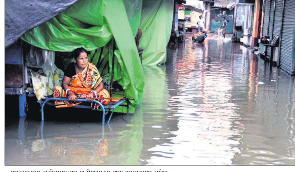
କୋଲକାତାର କାଳିତାତଠାରେ ପାଣିଭେରରେ ଥିବା ବୋକାନରେ ମହିଳା