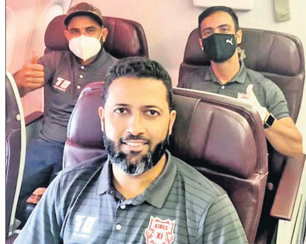
ଧୂବଳ ଯିବା ପୂର୍ବରୁ କିଛି ଲଲେଭେନ ପଞ୍ଜାବ ଦଳର ଖେଳାଳିମାନେ ।

ନୂଆଦିଲ୍ଲୀ, ୨୦୮ (ପି.ଟି.): ଇଣ୍ଡିଆନ ପ୍ରିମିୟର ଲିଗ୍ (ଆଇପିଏଲ୍)ରେ ଭାରତୀୟ ପାଇଁ କିଛି ଲଲେଭେନ ପଞ୍ଜାବ, କୋଲକାତା ନାଲଟ ରାଇଡର୍ସ ଓ ରାଜସ୍ଥାନ ରୟାଲ୍ସ ଦଳ ଗୁରୁବାର ଯୁନାଇଟେଡ ଆରବ ଏମିରେଟ୍ସ(ଧୂବଳ)ରେ ପହଞ୍ଚିଲା । ରୟାଲ୍ସ ଓ କିଙ୍ଗ୍ସ ଲଲେଭେନ ଦଳ ଦୁବାଇରେ ଏବଂ ନାଲଟ ରାଇଡର୍ସ ଦଳ ଆରୁଧାବିରେ ଅବସ୍ଥାନ କରିବ । ଯିବା ପୂର୍ବରୁ ଖେଳାଳିଙ୍କର ଏକାଧିକାଂଶ କୋଭିଡ୍-୧୯ ଟେଷ୍ଟ ହୋଇଛି । ଧୂବଳରେ ଖେଳାଳିମାନେ ୬ ଦିନ ପାଇଁ ଆଇସୋଲେସନରେ ରହିବେ । ଏହି ଅବସରରେ ପ୍ରଥମ, ୩ୟ ଓ ୬ଷ୍ଠ ଦିନ ସେମାନଙ୍କର କୋଭିଡ୍ ଟେଷ୍ଟ ହେବ । ରିପୋର୍ଟ ନେଗେଟିଭ୍ ଆସିଲେ ସେମାନେ ଜିଏସ୍ ସୁରକ୍ଷିତ ପରିବେଶରେ ଟ୍ରେନ୍ ଆରମ୍ଭ କରିପାରିବେ । ସେପ୍ଟେମ୍ବର ୧୯ରୁ ଏହି ଲିଗ୍ ଆରମ୍ଭ ହେବ । ଚୂନାମେଣ୍ଟର ପ୍ରତି ୫ ଦିନରେ ଥରେ ଖେଳାଳି ଓ ସପୋର୍ଟ ସ୍ଟାଫ୍ଙ୍କର କୋଭିଡ୍ ଟେଷ୍ଟ ହେବ ।