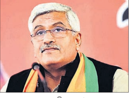
ଗଜେନ୍ଦ୍ର ସିଂ ଶେଖାଓଡ଼

ନୂଆଦିଲ୍ଲୀ, ୨୦୮ କେନ୍ଦ୍ର କ୍ୟାବିନେଟ ମନ୍ତ୍ରୀ ଗଜେନ୍ଦ୍ର ସିଂ ଶେଖାଓଡ଼ କରୋନା ଭୂତାଣୁ ଦ୍ୱାରା ଆକ୍ରାନ୍ତ ହୋଇଛନ୍ତି। କରୋନା ପଜିଟିଭ୍ ଟିକ୍ସଟ୍ ହେବା ପରେ ଗୁରୁବାର ଅପରାହ୍ନରେ ତାଙ୍କୁ ହସ୍ପିଟାଲରେ ଭର୍ତ୍ତି କରାଯାଇଛି। କକ ଶକ୍ତିମନ୍ତ୍ରୀ ଶେଖାଓଡ଼ ନିଜ ରୁଜୁରେ ମାଧ୍ୟମରେ ଏହି ସୂଚନା ଦେଇଛନ୍ତି। ଶେଖାଓଡ଼ଙ୍କୁ ମିଶାଇ ଚଳିତ ମାସରେ ୪ କେନ୍ଦ୍ରମନ୍ତ୍ରୀ କରୋନାରେ ସଂକ୍ରମିତ ହୋଇଥିବା ଜଣାପଡ଼ିଛି। ସ୍ୱରାଷ୍ଟ୍ରମନ୍ତ୍ରୀ ଅମିତ୍ ଶାହା, ପେଟ୍ରୋଲିୟମ ଓ ପ୍ରାକୃତିକ ଗ୍ୟାସ ମନ୍ତ୍ରୀ ଧର୍ମେନ୍ଦ୍ର ପ୍ରଧାନ, ସଂସଦୀୟ ବ୍ୟାପାର ରାଷ୍ଟ୍ରମନ୍ତ୍ରୀ ଅର୍ଜୁନ ରାମ ମେଘ୍ୱାଲ ଓ ଆୟୁଷ ବ୍ୟାପାର ମନ୍ତ୍ରୀ ଶ୍ରୀପଦ ନାଥ କରୋନାରେ ଆକ୍ରାନ୍ତ ହୋଇଛନ୍ତି। ଅମିତ୍ ଶାହା ନେଗେଟିଭ୍ ଟିକ୍ସଟ୍ ହେବା ପରେ ପୁଣି ଅସ୍ପତ୍ରି ହେବାକୁ ଏବେ ଦିଲ୍ଲୀର ଏମ୍.ଏସ୍.ଏ. ଟିକିଆଧାନ ଅଛନ୍ତି। ଭାରତରେ ଏବେ କରୋନା ସଂକ୍ରମିତ ସଂଖ୍ୟା ୨୮ ଲକ୍ଷରେ ପହଞ୍ଚିଥିବା ବେଳେ ଗତ ୨୪ ଘଣ୍ଟାରେ ୬୯,୬୫୨ ନୂଆ ରୋଗୀ ଟିକ୍ସଟ୍ ହୋଇଛନ୍ତି। ଦିନକରେ ୯୬୭ ଜଣଙ୍କ ପ୍ରାଣହାନି ଘଟିଥିବାବେଳେ ମୋଟ ୫୩,୮୬୬ ଜୀବନ ଗଲାଣି।