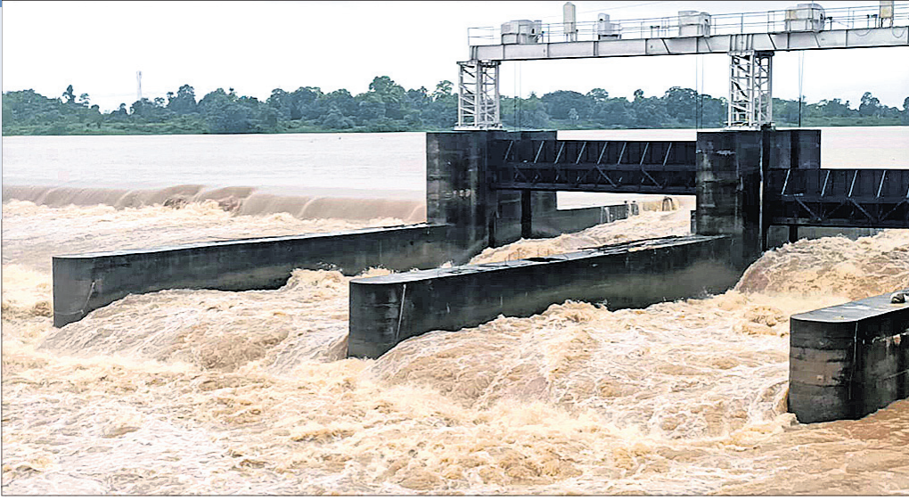
ଭଦ୍ରକ ଜିଲ୍ଲା ଭଞ୍ଜାରିପୋଖରୀ ବ୍ଲକ୍ ଆଖୁଆପଦା ଆନିକଟରେ ବୈତରଣୀ ନଦୀରେ ପ୍ରବାହିତ ବନ୍ୟା ଜଳ। (ବିପୋର୍: ପୃଷ୍ଠା-୩)

ଭୁବନେଶ୍ୱର, ୨୦୮୮ (ବୁଧବୋ) ଉତ୍ତର ପଶ୍ଚିମ ବଙ୍ଗୋପସାଗରରେ ସୃଷ୍ଟି ହୋଇଥିବା ଲଗୁନାପ ରାଜ୍ୟରେ ବର୍ଷା ବିପ୍ଳାବ ସୃଷ୍ଟି କରିଛି। ଫଳରେ ରାଜ୍ୟର ଅଧିକାଂଶ ନଦୀ ପୁଲୁଛି ନାହିଁ। ଗତ ଦୁଇଦିନ ଧରି ପ୍ରବଳ ବର୍ଷା ଯୋଗୁ କେତେକ ଜିଲ୍ଲାରେ ରାସ୍ତାଘାଟ ଧୋଇ ନେବା ସହିତ ଗାଈନି ମଧ୍ୟ ଜଳମଗ୍ନ ହୋଇଛି। ଆଉ କେତେକ ସ୍ଥାନରେ କଳାଘର ଭାଙ୍ଗିବା ସହ ଯୋଗାଯୋଗ ବିଚ୍ଛିନ୍ନ ହୋଇଛି। ମୟୂରଭଞ୍ଜ ଜିଲ୍ଲାରେ ନଦୀରେ ଭାସି ଯାଇ ଜଣେ ମୃତ ଓ ଜଣେ ନିଖୋଜ ଥିବା ଜଣାପଡ଼ିଛି। କେତେକ ତଳିଆ ଅଞ୍ଚଳ ବୁଡ଼ିଯାଇଛି। ରାଜ୍ୟର ୧୦ ଜିଲ୍ଲାରେ ପ୍ରବଳରୁ ଅତିପ୍ରବଳ ବର୍ଷା ହୋଇଛି। ସ୍ୱତନ୍ତ୍ର ରିଲିଫ୍ କମିଶନରଙ୍କ କାର୍ଯ୍ୟକ୍ରମ ପକ୍ଷରୁ ମିଳିଥିବା ସୂଚନା ଅନୁଯାୟୀ ନବରଙ୍ଗପୁରରେ ସର୍ବାଧିକ ୧୩୦.୬ ମିଲିମିଟର ବର୍ଷା ହୋଇଥିବା ବେଳେ କଟକ ୧୧୭.୨, ଯାଜପୁର ୧୧୧.୮, କୋରାପୁଟ ୧୦୦.୮, କେନ୍ଦ୍ରାପଡ଼ା ୧୦୦.୨,