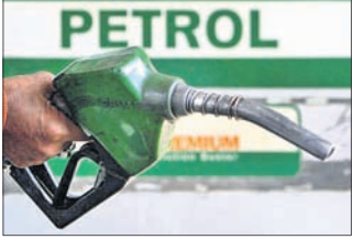
୧୪ ପଇସା ବଢ଼ି ଘଟିଥିଲା। ଗତ ଏକ ମାସ ହେବ ତେଲ ଦର ନିୟନ୍ତ୍ରଣରେ ପକାଇ ବଢ଼ିଥିବା ବେଳେ ଏଥରେ ବର୍ତ୍ତମାନ ବୃଦ୍ଧି ଘଟୁଥିବା ଜଣାପଡ଼ିଛି। ପୃଷ୍ଠା-୨

ଭୁବନେଶ୍ୱର, ୨୦୮୮ (ବୁଧବୋ) ଅଗଷ୍ଟ ୧୯ରେ ସୃଷ୍ଟି ହୋଇଥିବା ଲଗୁନାପ ପ୍ରଭାବରେ ରାଜ୍ୟରେ ବୃହଦ୍ଦିନ ହେଲା ପ୍ରବଳ ବର୍ଷିଲା। ମୌସୁମୀ ବାୟୁ ସକ୍ରିୟ ଥିବାରୁ ୨୨ ବର୍ଷା ଯାଏ ବର୍ଷା ଜାରି ରହିବ। ୨୩ ମାଲକାନଗିରି ୯୮.୫, କଳାହାଣ୍ଡି ୮୮.୭, ଡେଙ୍କାନାଳ ୮୭, କରକ୍ଷିପୁର ୮୭.୩ ଏବଂ ଭଦ୍ରକ ଜିଲ୍ଲାରେ ୮୫.୩ ମିଲିମିଟର ବର୍ଷା ରେକର୍ଡ୍ କରାଯାଇଛି। ଅନ୍ୟ ୨୦ଟି ଜିଲ୍ଲାରେ ମଧ୍ୟ ୭୦ରୁ ୧୦ ମିଲିମିଟର ପର୍ଯ୍ୟନ୍ତ ବର୍ଷା ହୋଇଛି। ଗଜପତି ଜିଲ୍ଲାରେ ୧୪.୪ ମିଲିମିଟର ବର୍ଷା ହୋଇଥିବା ବେଳେ ଗଞ୍ଜାମରେ ୧୦.୨ ମିଲିମିଟର ବର୍ଷା ରେକର୍ଡ୍ କରାଯାଇଛି। ତେବେ ରାଜ୍ୟରେ ହାରାହାରି ୫୮.୫ ମିଲିମିଟର ବର୍ଷା ରେକର୍ଡ୍ କରାଯାଇଛି। ଯଦି ବ୍ଲକ୍‌ଗୁଡ଼ିକୁ ହିସାବକୁ ନିଆଯାଏ ତେବେ ରାଜ୍ୟର ୫ଟି ପୃଷ୍ଠା-୨