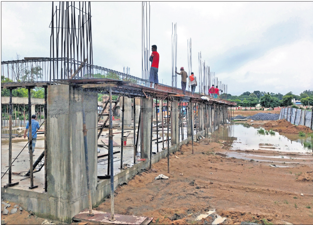
ଜିଲା ଖଣିଜ ପ୍ରତିଷ୍ଠାନ ପାଇଁ ଉଦ୍ୟମ କରୁଥିବା ସରକାରଙ୍କ ଉଦ୍ୟମ ବିଫଳ ହେଉଛି।

ଜିଲା ପ୍ରଶାସନ ବିରୋଧରେ ହାଇକୋର୍ଟକୁ ଯାଇଥିଲା। ସରକାରଙ୍କ ଉଦ୍ୟମ ବିଫଳ ହେଉଛି। ସରକାରଙ୍କ ଉଦ୍ୟମ ବିଫଳ ହେଉଛି।