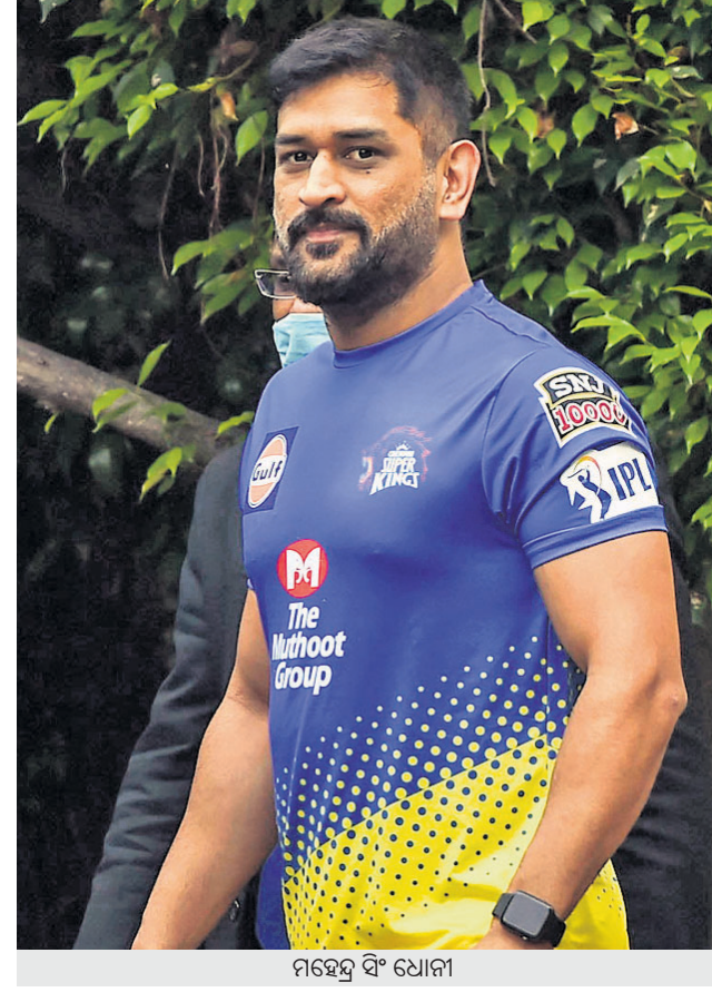
ମହେନ୍ଦ୍ର ସିଂ ଧୋନୀ