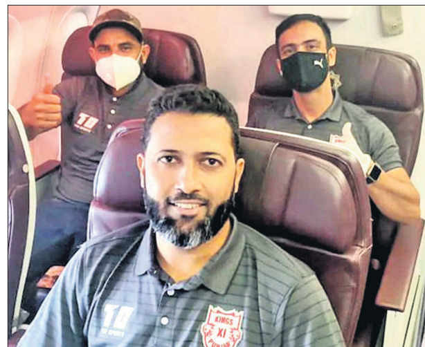
ଧୂଳିର ଯିବା ପୂର୍ବରୁ କିଛି ଲଲେଭେନ ପଞ୍ଜାବ ଦଳର ଖେଳାଳିମାନେ ।

ନୂଆଦିଲ୍ଲୀ, ୨୦୮ (ପି.ଟି.): ଇଣ୍ଡିଆନ ପ୍ରିମିୟର ଲିଗ୍ (ଆଇପିଏଲ୍)ରେ ଭାରତୀୟ ପାଇଁ କିଛି ଲଲେଭେନ ପଞ୍ଜାବ, କୋଲକାତା ନାଲଟ ରାଇଡର୍ସ ଓ ରାଜସ୍ଥାନ ରୟାଲ୍ସ ଦଳ ଗୁରୁବାର ଯୁନାଇଟେଡ ଆରବ ଏମିରେଟ୍ସ (ଧୂଳି)ରେ ପହଞ୍ଚିଲା । ରୟାଲ୍ସ ଓ କିଙ୍ଗ୍ସ ଲଲେଭେନ ଦଳ ଦୁବାଇରେ ଏବଂ ନାଲଟ ରାଇଡର୍ସ ଦଳ ଆବୁଧାବିରେ ଅବସ୍ଥାନ କରିବ । ଯିବା ପୂର୍ବରୁ ଖେଳାଳିଙ୍କର ଏକାଧିକ ପରୀକ୍ଷା-୧୯ ଚେଷ୍ଟ ହୋଇଛି । ଧୂଳିରେ ଖେଳାଳିମାନେ ୬ ଦିନ ପାଇଁ ଆଇସୋଲେସନରେ ରହିବେ । ଏହି ଅବସରରେ ପ୍ରଥମ, ୩ୟ ଓ ୬ଷ୍ଠ ଦିନ ସେମାନଙ୍କୁ କୋଭିଡ୍ ଚେଷ୍ଟ ହେବ । ରିପୋର୍ଟ ନେଗେଟିଭ୍ ଆସିଲେ ସେମାନେ ଜେଟ୍ ସୁରକ୍ଷିତ ପରିବେଶରେ ଟ୍ରେନିଂ ଆରମ୍ଭ କରିପାରିବେ । ସେପ୍ଟେମ୍ବର ୧୯ରୁ ଏହି ଲିଗ୍ ଆରମ୍ଭ ହେବ । ଚୂନାମେଣ୍ଟର ପ୍ରତି ୫ ଦିନରେ ଥରେ ଖେଳାଳି ଓ ସପୋର୍ଟ ସ୍ଟାଫ୍‌ଙ୍କୁ କୋଭିଡ୍ ଚେଷ୍ଟ ହେବ ।