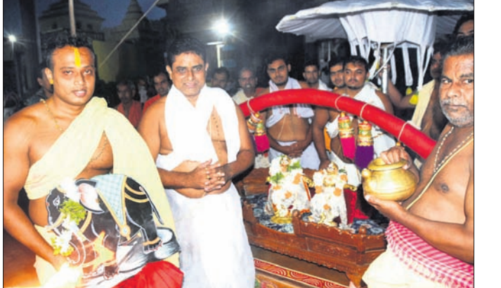
ଶ୍ରୀମନ୍ଦିର ସମ୍ମୁଖରେ ଅକ୍ଷ ଲୀଳା ନୀତି ସମ୍ପନ୍ନ କରାଯାଇଛି।