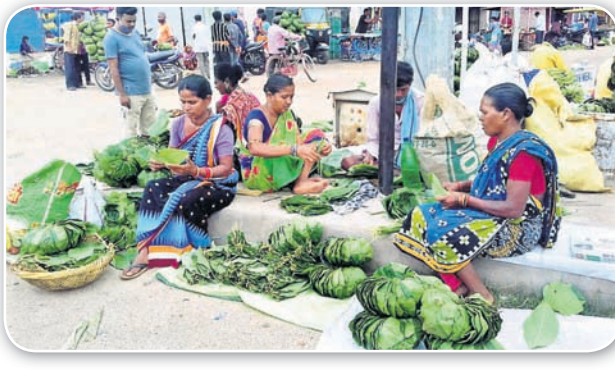
ବଲାଙ୍ଗୀର ତେଲି ମାର୍କେଟ ରାସ୍ତାପାର୍ଶ୍ୱରେ ବିକ୍ରି ହେଉଥିବା ଦନା ଓ ଖଳି ।

ଶପର୍ବ ନୂଆଁଖାଇରେ ବିଭିନ୍ନ ପତ୍ରର ଭୂମିକାକୁ ଗୁରୁତ୍ୱ ଦିଆଯାଏ । ସେଦିନ ନବାନ ଭାଷଣ ଲାଗି ନାନା ସମ୍ପ୍ରଦାୟ ଲୋକଙ୍କ ପାଇଁ ଭିନ୍ନ ଭିନ୍ନ ପତ୍ରର ବ୍ୟବହାର ରହିଛି । ଗଉଡ଼, କନ୍ଧ, ତେଲି, ବ୍ରାହ୍ମଣ, ଭୂଲିଆ, ମାଳି ସମ୍ପ୍ରଦାୟର ଲୋକେ କୁରେଇ ପତ୍ରରେ ନୂଆଁ ଖାଉଥିବା ବେଳେ ବୁଝାକ ସହ ଆଉ କେତେକ ସମ୍ପ୍ରଦାୟର ଲୋକେ ଭେଲୁଆ, ମହୁଳ, ରେଙ୍ଗାଳ ଆଦି ପତ୍ରରେ ନୂଆଁ ଖାଇଥାନ୍ତି । ସେହିପରି ଅନ୍ୟ କେତେକ ସମ୍ପ୍ରଦାୟର ଲୋକେ ସାଗୁ, କଦଳୀ ଏବଂ ପଶୁପତ୍ରରେ ମଧ୍ୟ ନବାନ ଭାଷଣ କରନ୍ତି । ମହତ୍ତ୍ୱପୂର୍ଣ୍ଣ ବିଷୟ ହେଲା ନବାନ ଭାଷଣ ପାଇଁ ଯେଉଁ ଗଛରୁ ଲୋକମାନେ ପତ୍ର ସଂଗ୍ରହ କରିଥାନ୍ତି ସେହି ବୃକ୍ଷକୁ ପ୍ରଥମେ ପୂଜା କରିବାର ବିଧି ରହିଛି । ପରିବାରର ସାଧବାମାନେ ନିର୍ଦ୍ଦିଷ୍ଟ ବୃକ୍ଷ ନିକଟକୁ ଯାଇ ପୂଜା କରିବା ପରେ ପତ୍ର ତୋଳନ୍ତି । ଭଲ ପତ୍ରରେ ଖଳି ଓ ଦନା ପ୍ରସ୍ତୁତ କରାଯାଇ ସେଥିରେ ପ୍ରଥମେ ଲକ୍ଷ୍ମୀ ଦେବାଦେବୀଙ୍କୁ ନବାନ ଅର୍ପଣ କରାଯାଏ । ପରେ ପରିବାରର ସଦସ୍ୟମାନେ ସେହି ପତ୍ରରେ ନିର୍ମିତ ଖଳି ଓ ଦନାରେ ନବାନ ଭାଷଣ କରନ୍ତି । ଏପରି ପରମ୍ପରା ଗଛଲତାପ୍ରତି ମଣିଷର ରହିଥିବା ଶ୍ରଦ୍ଧାକୁ ପ୍ରତିବାଦିତ କରିଛି । ହେଲେ ଚଳିତ ବର୍ଷ କରୋନା ଜଟିଳଗାର ପ୍ରଭାବ ନୂଆଁଖାଇ ଉପରେ ପଡ଼ିଛି । ଏହି ପର୍ବର ତିନି ଚାରି ଦିନ ପୂର୍ବରୁ ଦିନ ମନୁରିଆମାନେ ଜଙ୍ଗଲକୁ ଯାଇ ସର୍ପପତ୍ର, ରେଙ୍ଗାଳ ପତ୍ର, କୁରେଇ ପତ୍ର ସଂଗ୍ରହ କରିଥାନ୍ତି । ସେମାନେ ସେଥିରେ ଦନା ଓ ଖଳି ତିଆରି କରି ବିଭିନ୍ନ ବଜାର ଓ ହାଟରେ ବିକ୍ରି କରି ଭଲ ଦୁଇ ପଇସା ରୋଜଗାର କରିଥାନ୍ତି । ହେଲେ ଚଳିତବର୍ଷ ସେଥିରେ ବ୍ୟତିକ୍ରମ ଦେଖାଦେଇଛି । ଅଳ୍ପ କେତେକ ଗାଁ ଗହଳିର ପତ୍ର ତୋଳାକା ବଜାରକୁ ଆସି ନିକ୍ ତିଆରି ଦନା, ଖଳି ବିକ୍ରି ପାଇଁ ବଲାଙ୍ଗୀର ରାସ୍ତା ପାର୍ଶ୍ୱରେ ପସରା ମେଲାଇଛନ୍ତି । ଉଲ୍ଲେଖଯୋଗ୍ୟ, ନୂଆଁଖାଇରେ କୌଣସି ସମ୍ପ୍ରଦାୟର ଲୋକେ ବାସନ୍ତ, କୁସନ ବ୍ୟବହାର କରି ନ ଥାନ୍ତି । ସେମାନେ ନିର୍ଦ୍ଧାରିତ ପତ୍ରରେ ତିଆରି ଦନା ଓ ଖଳିରେ ନୂଆଁଖାଇ ପ୍ରସାଦ ଖାଇଥାନ୍ତି । ଆବଶ୍ୟକ ପଡ଼ିଲେ ସେହି ଦନା ଓ ଖଳିରେ ପ୍ରସାଦ ବନ୍ଧନ କରିଥାନ୍ତି ।