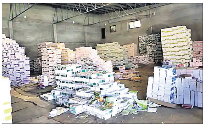
ଜବତ ବେଆଇନ ଏନ୍ସାଇଆର୍ଟି ବହି। ବିଶ୍ୱ ପୁସ୍ତକ ସୂଚନା ପାଇ ଏହି ବହିର କରାଯାଇଥିଲା ବୋଲି ଏସ୍ପିଏଚ୍ ଡିଏସ୍ପି ବ୍ରଜେଶ ସିଂ କହିଛନ୍ତି।

ଓଡ଼ିଶା ପ୍ରଦେଶରେ ବେଆଇନ ଭାବେ ଛପାଯାଇଥିବା ୪୦ କୋଟି ଟଙ୍କାର ଏନ୍ସାଇଆର୍ଟି (କାତାୟ ଶିକ୍ଷା ଗବେଷଣା ଓ ପ୍ରଶିକ୍ଷଣ ପରିଷଦ) ବହି ଜବତ ହେବା ସହ ୧୨ ଜଣଙ୍କୁ ଗିରଫ କରାଯାଇଛି।