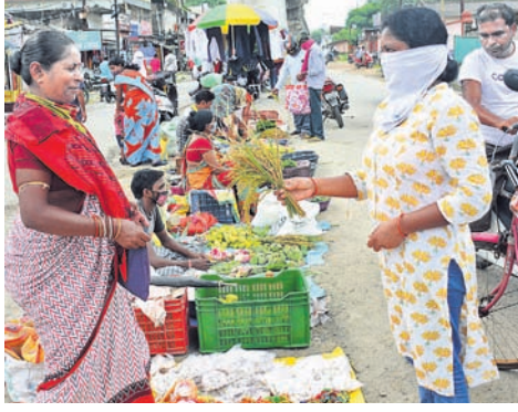
ସମ୍ବଲପୁରରେ ଜଣେ ଯୁବକ ନୂଆଁ ଧାନ କିଣୁଛନ୍ତି ।