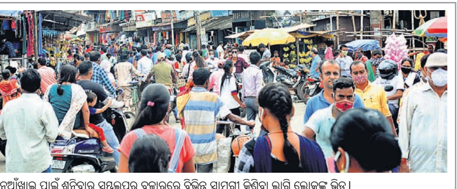
ନୂଆଁଖାଇ ପାଇଁ ଶନିବାର ସମ୍ବଲପୁର ବଜାରରେ ବିଭିନ୍ନ ସାମଗ୍ରୀ କିଣିବା ଲାଗି ଲୋକଙ୍କ ଭିଡ଼ ।