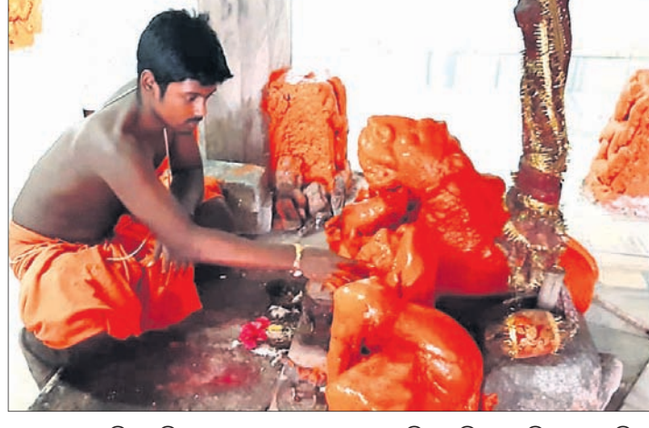
ସମଲେଇ ମନ୍ଦିର ପରିସରରେ ଥିବା ଶୀତଳାଦେବୀଙ୍କୁ ଶନିବାର ସିନ୍ଦୂର ଲାଗି କରାଯାଉଛି।

ଧୂଳରଗତ ଜିଲାର ଶିଖରବାସିନୀ ଓ ସମଲେଇ, ବଲାଙ୍ଗୀରର ଇଷ୍ଟଦେବୀ ପାରଶେଶ୍ୱରୀ, ସୁବର୍ଣ୍ଣପୁରର ଇଷ୍ଟଦେବୀ ସୁରେଶ୍ୱରୀ ଓ ବୌଦ୍ଧ ଜିଲାର ଭୈରବୀଙ୍କ ପାଠରେ ନୂଆଁଖାଇ ସକାଶେ ପ୍ରସ୍ତୁତି ତୁଳା ହୋଇଛି। ନୂଆଁଖାଇ ଲାଗି ଗାଁ ଦାଣ୍ଡ ଉତ୍ସବ ପୂର୍ଣ୍ଣ ହୋଇଛି।