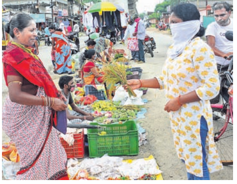
ସମ୍ବଲପୁରରେ ଜଣେ ଯୁବକ ନୂଆଁ ଧାନ କିଣୁଛନ୍ତି ।