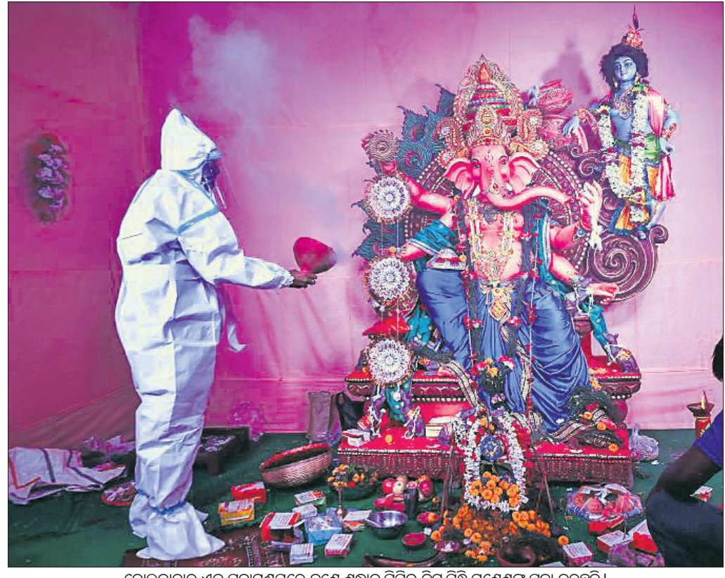
କୋଲକାତାର ଏକ ପୂଜାମଣ୍ଡପରେ ଜଣେ ଶ୍ରଦ୍ଧାଳୁ ପିପିଏ କିଟ୍ ପିନ୍ଧି ଗଣେଶଙ୍କୁ ପୂଜା କରୁଛନ୍ତି ।