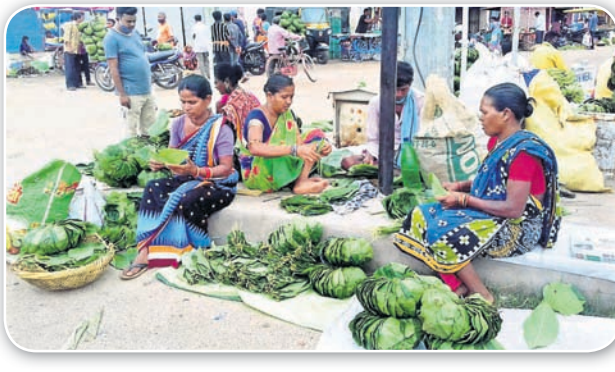
ବଲାଙ୍ଗୀର ତେଲି ମାର୍କେଟ ରାସ୍ତାପାର୍ଶ୍ୱରେ ବିକ୍ରି ହେଉଥିବା ଦନା ଓ ଖଳି ।

ଗଣପର୍ବ ନୂଆଁଖାଇରେ ବିଭିନ୍ନ ପତ୍ର ଚୂନିକାକୁ ଗୁରୁତ୍ୱ ଦିଆଯାଏ । ସେଦିନ ନବୀନ ଭକ୍ଷଣ ଲାଗି ନାନା ସମ୍ପ୍ରଦାୟ ଲୋକଙ୍କ ପାଇଁ ଭିନ୍ନ ଭିନ୍ନ ପତ୍ର ବ୍ୟବହାର ରହିଛି । ଗଉଡ, କନ୍ଧ, ତେଲି, ବ୍ରାହ୍ମଣ, ଭୂଲିଆ, ମାଳି ସମ୍ପ୍ରଦାୟ ଲୋକେ କୁରେଇ ପତ୍ରରେ ନୂଆଁ ଖାଉଥିବା ବେଳେ ଦୁମ୍ଭାକ ସହ ଆଉ କେତେକ ସମ୍ପ୍ରଦାୟ ଲୋକେ ଭେଲୁଆ, ମହୁଳ, ରେଙ୍ଗାଳ ଆଦି ପତ୍ରରେ ନୂଆଁ ଖାଇଥାନ୍ତି । ସେହିପରି ଅନ୍ୟ କେତେକ ସମ୍ପ୍ରଦାୟ ଲୋକେ ସାଣ୍ଡ, କଦଳୀ ଏବଂ ପଣସ ପତ୍ରରେ ମଧ୍ୟ ନବୀନ ଭକ୍ଷଣ କରନ୍ତି । ମହତ୍ୱପୂର୍ଣ୍ଣ ବିଷୟ ହେଲା ନବୀନ ଭକ୍ଷଣ ପାଇଁ ଯେଉଁ ଗଛରୁ ଲୋକମାନେ ପତ୍ର ସଂଗ୍ରହ କରିଥାନ୍ତି ସେହି ବୃକ୍ଷକୁ ପ୍ରଥମେ ପୂଜା କରିବାର ବିଧି ରହିଛି । ପରିବାରର ସାଧବାମାନେ ନିର୍ଦ୍ଦିଷ୍ଟ ବୃକ୍ଷ ନିକଟକୁ ଯାଇ ପୂଜା କରିବା ପରେ ପତ୍ର ତୋଳନ୍ତି । ଭଲ ପତ୍ରରେ ଖଳି ଓ ଦନା ପ୍ରସ୍ତୁତ କରାଯାଇ ସେଥିରେ ପ୍ରଥମେ ଲକ୍ଷ୍ମୀ ଦେବାଦେବୀଙ୍କୁ ନବୀନ ଅର୍ପଣ କରାଯାଏ । ପରେ ପରିବାରର ସଦସ୍ୟମାନେ ସେହି ପତ୍ରରେ ନିର୍ମିତ ଖଳି ଓ ଦନାରେ ନବୀନ ଭକ୍ଷଣ କରନ୍ତି । ଏପରି ପରମ୍ପରା ଗଛଲତାପ୍ରତି ମଣିଷର ରହିଥିବା ଶ୍ରଦ୍ଧାକୁ ପ୍ରତିବାଦିତ କରିଛି । ହେଲେ ଚଳିତ ବର୍ଷ କରୋନା କଟକଣାର ପ୍ରଭାବ ନୂଆଁଖାଇ ଉପରେ ପଡ଼ିଛି । ଏହି ପର୍ବର ତିନି ତାରି ଦିନ ପୂର୍ବରୁ ଦିନ ମନୁରିଆମାନେ ଜଙ୍ଗଲକୁ ଯାଇ ସର୍ଗିପତ୍ର, ରେଙ୍ଗାଳ ପତ୍ର, କୁରେଇ ପତ୍ର ସଂଗ୍ରହ କରିଥାନ୍ତି । ସେମାନେ ସେଥିରେ ଦନା ଓ ଖଳି ତିଆରି କରି ବିଭିନ୍ନ ବଜାର ଓ ହାଟରେ ବିକ୍ରି କରି ଭଲ ଦୁଇ ପଇସା ରୋଜଗାର କରିଥାନ୍ତି । ହେଲେ ଚଳିତବର୍ଷ ସେଥିରେ ବ୍ୟତିକ୍ରମ ଦେଖାଦେଇଛି । ଅଳ୍ପ କେତେକ ଗାଁ ଗହଳିର ପତ୍ର ତୋଳାକା ବଜାରକୁ ଆସି ନିଜ ତିଆରି ଦନା, ଖଳି ବିକ୍ରି ପାଇଁ ବଲାଙ୍ଗୀର ରାସ୍ତା ପାର୍ଶ୍ୱରେ ପସରା ମେଲାଇଛନ୍ତି । ଉଲ୍ଲେଖଯୋଗ୍ୟ, ନୂଆଁଖାଇରେ କୌଣସି ସମ୍ପ୍ରଦାୟ ଲୋକେ ବାସନ, କୁସନ ବ୍ୟବହାର କରି ନ ଥାନ୍ତି । ସେମାନେ ନିର୍ଦ୍ଧାରିତ ପତ୍ରରେ ତିଆରି ଦନା ଓ ଖଳିରେ ନୂଆଁଖାଇ ପ୍ରସାଦ ଖାଇଥାନ୍ତି । ଆବଶ୍ୟକ ପଡ଼ିଲେ ସେହି ଦନା ଓ ଖଳିରେ ପ୍ରସାଦ ବନ୍ଧନ କରିଥାନ୍ତି ।