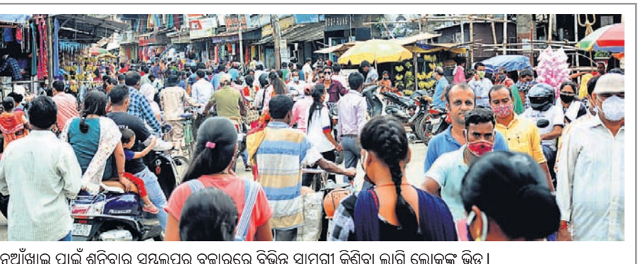
ନୂଆଁଖାଇ ପାଇଁ ଶନିବାର ସମ୍ବଲପୁର ବଜାରରେ ବିଭିନ୍ନ ସାମଗ୍ରୀ କିଣିବା ଲାଗି ଲୋକଙ୍କ ଭିଡ଼।