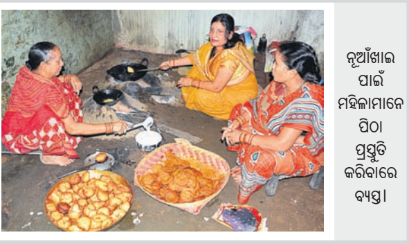
ନୂଆଁଖାଇ ପାଇଁ ମହିଳାମାନେ ପିଠା ପ୍ରସ୍ତୁତି କରିବାରେ ବ୍ୟସ୍ତ।

ନୂଆଁଖାଇ ଗଣପର୍ବ ନୂଆଁଖାଇ । ଏହି ପର୍ବ ପର୍ଯ୍ୟନ୍ତ ଓଡ଼ିଶାରେ ପ୍ରତିବର୍ଷ ଭାଦ୍ରବ ମାସ ଶୁକ୍ଳପକ୍ଷ ପଞ୍ଚମୀ ତିଥିରେ ପାଳନ କରାଯାଏ । ଚାଷୀ ଚା'ର ପ୍ରଥମ ଅମଳ ଧାନକୁ ନିଜ ଲକ୍ଷ୍ମୀ ଦେବୀଦେବଙ୍କୁ ସମର୍ପଣ କରିବା ପରେ ପ୍ରସାଦ ରୂପେ ପରିବାର ସଦସ୍ୟମାନେ ଏକତ୍ରିତ ଭାବେ ଖାଇବା ହେଉଛି ଏହି ପର୍ବର ମୁଖ୍ୟ ଲକ୍ଷ୍ୟ । ନୂଆଁଖାଇ ଅନ୍ୟତମ ସମ୍ପର୍କରେ ଗବେଷକମାନେ ଭିନ୍ନ ଭିନ୍ନ ମତ ଦେଇଥାନ୍ତି । ପୌରାଣିକ ମତବାଦ ଅନୁସାରେ, ବୈଦିକ ଯୁଗର ମହର୍ଷିଗଣଙ୍କ ଦ୍ୱାରା ଏହା ପ୍ରଣୀତ ହୋଇଥିଲା । ଏଥିରେ ପଞ୍ଚ ଯଜ୍ଞ ପ୍ରକ୍ରିୟା ରହିଥିଲା । ଏହି ମତବାଦ ଅନୁସାରେ ନୂଆଁଖାଇ ପ୍ରକ୍ରିୟା ଯଜ୍ଞରୁ ଆସିଛି । ସର୍ବପ୍ରଥମେ ନୂଆଁ ଧାନରେ ତିଆରି ପ୍ରସାଦକୁ ଦେବାକୁ ଅର୍ପଣ କଲାପରେ ହିଁ ସେହି ନବୀନକୁ ଜନସାଧାରଣ ଗ୍ରହଣ କରିଥାନ୍ତି । ଖରିଫ୍ଟ ରତ୍ନରେ ସଫଳ କିସମ ଧାନ ପ୍ରାୟତଃ ଭାଦ୍ରବ ମାସରେ ଅମଳ ହୋଇଥାଏ । ତେଣୁ ଭାଦ୍ରବ ଶୁକ୍ଳପକ୍ଷ ଚତୁର୍ଥୀ ତିଥିରେ ଅଗ୍ରପୂଜ୍ୟ ଗଣେଶଙ୍କ ପୂଜା ପରଦିନ ନୂଆଁଖାଇ ପାଳନ କରାଯାଇଥାଏ । ପଶ୍ଚିମ ଓଡ଼ିଶା ଆଦିବାସୀ ବହୁଳ ଅଞ୍ଚଳ ହୋଇଥିବାରୁ ଦେବୀଦେବଙ୍କ ପ୍ରତି ସ୍ଥାନୀୟ ଲୋକଙ୍କ ଅତ୍ୟନ୍ତ ବିଶ୍ୱାସ ରହିଛି । ସେମାନଙ୍କ ମତରେ ପ୍ରଥମେ ନୂଆଁଧାନକୁ ପ୍ରଥା ଓ ରୀତି ଅନୁଯାୟୀ ଦେବାକୁ ସମର୍ପଣ କରି ନୂଆଁ ଅଳ ପାଇଥାନ୍ତି । ତେଣୁ ଭାଦ୍ରବ