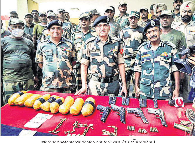
ଅନୁପ୍ରବେଶକାରୀଙ୍କୁ ଜବତ ଅସ୍ତ୍ର ଓ ଗୁଳିଗୋଳା ।

ଚଣ୍ଡିଗଡ଼/ନୂଆଦିଲ୍ଲୀ, ୨୨୮୮ ବିଏସ୍ଏଫ୍ ମୁଖପାତ୍ର କହିଛନ୍ତି । ସୀମା ନିକଟରେ ପାକ୍ ଅନୁପ୍ରବେଶକାରୀଙ୍କ ସହଯୋଗୀଙ୍କୁ ହାବଭାବ ଜଣାପଡ଼ିବା ପରେ ଉଚ୍ଚ ଅଞ୍ଚଳରୁ ସୁରକ୍ଷାକାରୀମାନେ ଯେଉଁଠି ସେମାନଙ୍କୁ ଆଘାତପର୍ଯ୍ୟନ୍ତ ଲାଗି କହିଥିଲେ । ସମସ୍ତ ପାକ୍ ଅନୁପ୍ରବେଶକାରୀମାନେ ଏହା ନ ମାନି ବିଏସ୍ଏଫ୍ ଯବାନଙ୍କ ଉପରକୁ ଗୁଳିମାଡ଼ କରିଥିଲେ । ଏହା ପରେ ଯବାନମାନେ କଡ଼ା ଜବାବ୍ ଦେବାକୁ ଗୁଳିମାଡ଼ରେ ୫ ପାକ୍ ଅନୁପ୍ରବେଶକାରୀ ନିହତ ହୋଇଥିଲେ ।