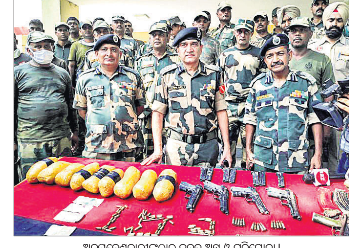
ଅନୁପ୍ରବେଶକାରୀଙ୍କଠାରୁ ଜବତ ଅସ୍ତ୍ର ଓ ଗୁଳିଗୋଳ।

ଚଣ୍ଡିଗଡ଼/ନୂଆଦିଲ୍ଲୀ, ୨୨୮୮ ବିଏସ୍‌ଏଫ୍ ମୁଖପାତ୍ର କହିଛନ୍ତି। ସାମାଜିକ ନିକଟରେ ପାକ୍ ଅନୁପ୍ରବେଶକାରୀଙ୍କ ସହଯୋଗୀଙ୍କୁ ହାବତ୍ତାବ ଜଣାପଡ଼ିବା ପରେ ଉଚ୍ଚ ଅଞ୍ଚଳରୁ ସୁରକ୍ଷାକାରୀମାନେ ଯେଉଁଠି ସେମାନଙ୍କୁ ଆଘାତପର୍ଯ୍ୟନ୍ତ ଲାଗି କହିଥିଲେ। ସମସ୍ତ ପାକ୍ ଅନୁପ୍ରବେଶକାରୀମାନେ ଏହା ନ ମାନି ବିଏସ୍‌ଏଫ୍ ଯବାନଙ୍କ ଉପରକୁ ଗୁଳିମାଡ଼ କରିଥିଲେ। ଏହା ପରେ ଯବାନମାନେ କଡ଼ା ଜବାବ୍ ଦେବାକୁ ଗୁଳିମାଡ଼ରେ ୫ ପାକ୍ ଅନୁପ୍ରବେଶକାରୀ ନିହତ ହୋଇଥିଲେ।