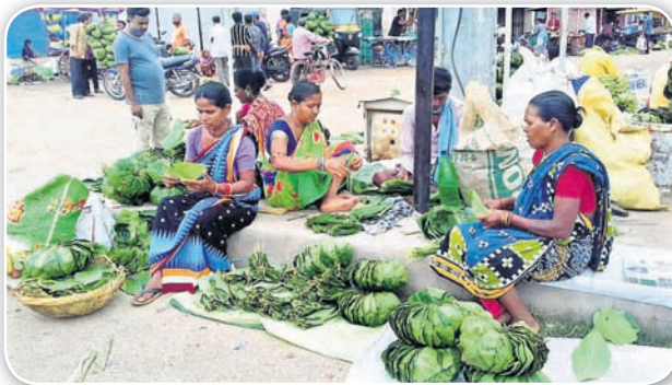
ବଲାଙ୍ଗୀର ତେଲି ମାର୍କେଟ ରାସ୍ତାପାର୍ଶ୍ୱରେ ବିକ୍ରି ହେଉଥିବା ଦନା ଓ ଖଳି ।

ଶପର୍ବ ନୂଆଁଖାଇରେ ବିଭିନ୍ନ ପତ୍ର ଚୁମିକାକୁ ଗୁରୁତ୍ୱ ଦିଆଯାଏ । ସେଦିନ ନବୀନ ଭଣ୍ଡାରୀ ଲାଗି ନାନା ସମ୍ପ୍ରଦାୟ ଲୋକଙ୍କ ପାଇଁ ଭିନ୍ନ ଭିନ୍ନ ପତ୍ର ବ୍ୟବସ୍ଥା ରହିଛି । ଗଉଡ, କନ୍ଧ, ତେଲି, ବ୍ରାହ୍ମଣ, ଭୂଲିଆ, ମାଳି ସମ୍ପ୍ରଦାୟ ଲୋକେ କୁରେଇ ପତ୍ରରେ ନୂଆଁ ଖାଉଥିବା ବେଳେ ଦୁମ୍ବଳ ସହ ଆଉ କେତେକ ସମ୍ପ୍ରଦାୟ ଲୋକେ ଭେଲୁଆ, ମହୁଳ, ରେଙ୍ଗାଳ ଆଦି ପତ୍ରରେ ନୂଆଁ ଖାଇଥାନ୍ତି । ସେହିପରି ଅନ୍ୟ କେତେକ ସମ୍ପ୍ରଦାୟ ଲୋକେ ସାଣ୍ଡ, କଦଳୀ ଏବଂ ପଣସ ପତ୍ରରେ ମଧ୍ୟ ନବୀନ ଭଣ୍ଡାରୀ କରନ୍ତି । ମହୁପୂର୍ଣ୍ଣ ବିଷୟ ହେଲା ନବୀନ ଭଣ୍ଡାରୀ ପାଇଁ ଯେଉଁ ଗଛକୁ ଲୋକମାନେ ପତ୍ର ସଂଗ୍ରହ କରିଥାନ୍ତି ସେହି ବୃକ୍ଷକୁ ପ୍ରଥମେ ପୂଜା କରିବାର ବିଧି ରହିଛି । ପରିବାରର ସାଧବାମାନେ ନିର୍ଦ୍ଦିଷ୍ଟ ବୃକ୍ଷ ନିକଟକୁ ଯାଇ ପୂଜା କରିବା ପରେ ପତ୍ର ତୋଳନ୍ତି । ଭଲ ପତ୍ରରେ ଖଳି ଓ ଦନା ପ୍ରସ୍ତୁତ କରାଯାଇ ସେଥିରେ ପ୍ରଥମେ ଲକ୍ଷ୍ମୀ ଦେବାଦେବୀଙ୍କୁ ନବୀନ ଅର୍ପଣ କରାଯାଏ । ପରେ ପରିବାରର ସଦସ୍ୟମାନେ ସେହି ପତ୍ରରେ ନିର୍ମିତ ଖଳି ଓ ଦନାରେ ନବୀନ ଭଣ୍ଡାରୀ କରନ୍ତି । ଏପରି ପରମ୍ପରା ଗଛଲତାପ୍ରତି ମଣିଷର ରହିଥିବା ଶ୍ରଦ୍ଧାକୁ ପ୍ରତିବାଦିତ କରିଛି । ହେଲେ ଚଳିତ ବର୍ଷ କରୋନା ଜଟିଳତା ପ୍ରଭାବ ନୂଆଁଖାଇ ଉପରେ ପଡ଼ିଛି । ଏହି ପର୍ବର ତିନି ତାରି ଦିନ ପୂର୍ବରୁ ଦିନ ମନୁରିଆମାନେ ଜଙ୍ଗଲକୁ ଯାଇ ସର୍ଗିପତ୍ର, ରେଙ୍ଗାଳ ପତ୍ର, କୁରେଇ ପତ୍ର ସଂଗ୍ରହ କରିଥାନ୍ତି । ସେମାନେ ସେଥିରେ ଦନା ଓ ଖଳି ତିଆରି କରି ବିଭିନ୍ନ ବଜାର ଓ ହାଟରେ ବିକ୍ରି କରି ଭଲ ଦୁଇ ପଇସା ରୋଜଗାର କରିଥାନ୍ତି । ହେଲେ ଚଳିତବର୍ଷ ସେଥିରେ ବ୍ୟତିକ୍ରମ ଦେଖାଦେଇଛି । ଅଳ୍ପ କେତେକ ଗାଁ ଗହଳିର ପତ୍ର ତୋଳାକା ବଜାରକୁ ଆସି ନିଜ ତିଆରି ଦନା, ଖଳି ବିକ୍ରି ପାଇଁ ବଲାଙ୍ଗୀର ରାସ୍ତା ପାର୍ଶ୍ୱରେ ପସରା ମେଲାଇଛନ୍ତି । ଉଲ୍ଲେଖଯୋଗ୍ୟ, ନୂଆଁଖାଇରେ କୌଣସି ସମ୍ପ୍ରଦାୟ ଲୋକେ ବାସନ, କୁସନ ବ୍ୟବହାର କରି ନ ଥାନ୍ତି । ସେମାନେ ନିର୍ଦ୍ଧାରିତ ପତ୍ରରେ ତିଆରି ଦନା ଓ ଖଳିରେ ନୂଆଁଖାଇ ପ୍ରସାଦ ଖାଇଥାନ୍ତି । ଆବଶ୍ୟକ ପଡ଼ିଲେ ସେହି ଦନା ଓ ଖଳିରେ ପ୍ରସାଦ ବନ୍ଧନ କରିଥାନ୍ତି ।