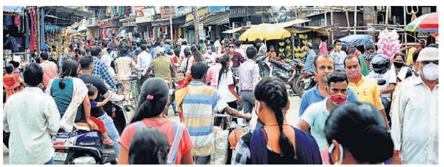
ନୂଆଁଖାଇ ପାଇଁ ଶନିବାର ସମ୍ବଲପୁର ବଜାରରେ ବିଭିନ୍ନ ସାମଗ୍ରୀ କିଣିବା ଲାଗି ଲୋକଙ୍କ ଭିଡ଼।