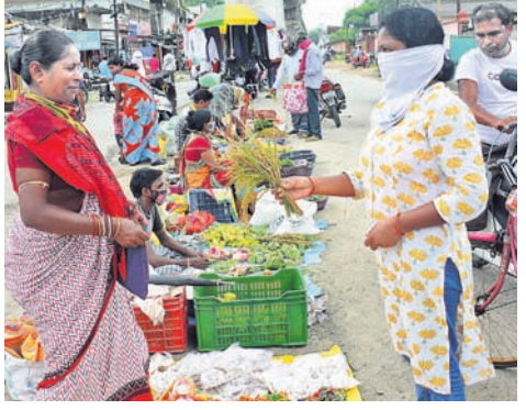
ସମ୍ବଲପୁରରେ ଜଣେ ଯୁବକ ନୂଆଁ ଧାନ କିଣୁଛନ୍ତି ।