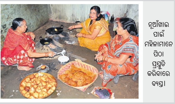
ନୂଆଁଖାଇ ପାଇଁ ମହିଳାମାନେ ପିଠା ପ୍ରସ୍ତୁତି କରିବାରେ ବ୍ୟସ୍ତ।

ନୂଆଁଖାଇ ଗଣପର୍ବ ନୂଆଁଖାଇ । ଏହି ପର୍ବ ପର୍ଯ୍ୟନ୍ତ ଓଡ଼ିଶାରେ ପ୍ରତିବର୍ଷ ଭାଦ୍ରବ ମାସ ଶୁକ୍ଳପକ୍ଷ ପଞ୍ଚମୀ ତିଥିରେ ପାଳନ କରାଯାଏ । ଚାଷୀ ଚା'ର ପ୍ରଥମ ଅମଳ ଧାନକୁ ନିଜ ଇଚ୍ଛା ଦେବାଦେବଙ୍କୁ ସମର୍ପଣ କରିବା ପରେ ପ୍ରସାଦ ରୂପେ ପରିବାର ସଦସ୍ୟମାନେ ଏକତ୍ରିତ ଭାବେ ଖାଇବା ହେଉଛି ଏହି ପର୍ବର ମୁଖ୍ୟ ଲକ୍ଷ୍ୟ । ନୂଆଁଖାଇ ଅନ୍ୟତମ ସମ୍ପର୍କରେ ଗବେଷକମାନେ ଭିନ୍ନ ଭିନ୍ନ ମତ ଦେଇଥାନ୍ତି । ପୌରାଣିକ ମତବାଦ ଅନୁସାରେ, ଦେବିଙ୍କ ମୂଳର ମହର୍ଷିଗଣଙ୍କ ଦ୍ୱାରା ଏହା ପ୍ରଣୀତ ହୋଇଥିଲା । ଏଥିରେ ପଞ୍ଚ ଯଜ୍ଞ ପ୍ରକ୍ରିୟା ରହିଥିଲା । ଏହି ମତବାଦ ଅନୁସାରେ ନୂଆଁଖାଇ ପ୍ରକାଶନ ଯଜ୍ଞରୁ ଆସିଛି । ସର୍ବପ୍ରଥମେ ନୂଆଁ ଧାନରେ ତିଆରି ପ୍ରସାଦକୁ ଦେବାଙ୍କୁ ଅର୍ପଣ କଲାପରେ ହିଁ ସେହି ନବୀନକୁ ଜନସାଧାରଣ ଗ୍ରହଣ କରିଥାନ୍ତି । ଖରିଫ ଋତୁରେ ସଫଳ କିସମ ଧାନ ପ୍ରାୟତଃ ଭାଦ୍ରବ ମାସରେ ଅମଳ ହୋଇଥାଏ । ତେଣୁ ଭାଦ୍ରବ ଶୁକ୍ଳପକ୍ଷ ଚତୁର୍ଥୀ ତିଥିରେ ଅଗ୍ରପୂଜ୍ୟ ଗଣେଶଙ୍କ ପୂଜା ପରଦିନ ନୂଆଁଖାଇ ପାଳନ କରାଯାଇଥାଏ । ପଶ୍ଚିମ ଓଡ଼ିଶା ଆଦିବାସୀ ବହୁଳ ଅଞ୍ଚଳ ହୋଇଥିବାରୁ ଦେବାଦେବଙ୍କ ପ୍ରତି ସ୍ଥାନୀୟ ଲୋକଙ୍କ ଅତୁଟ ବିଶ୍ୱାସ ରହିଛି । ସେମାନଙ୍କ ମତରେ ପ୍ରଥମେ ନୂଆଁଧାନକୁ ପ୍ରଥା ଓ ରୀତି ଅନୁଯାୟୀ ଦେବାଙ୍କୁ ସମର୍ପଣ କରି ନୂଆଁ ଅଳ ପାଇଥାନ୍ତି । ତେଣୁ ଭାଦ୍ରବ