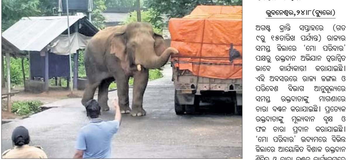
ଗାଣୀର ରାଜପଥରେ ବୁଲୁଥିବା ହାତୀ।