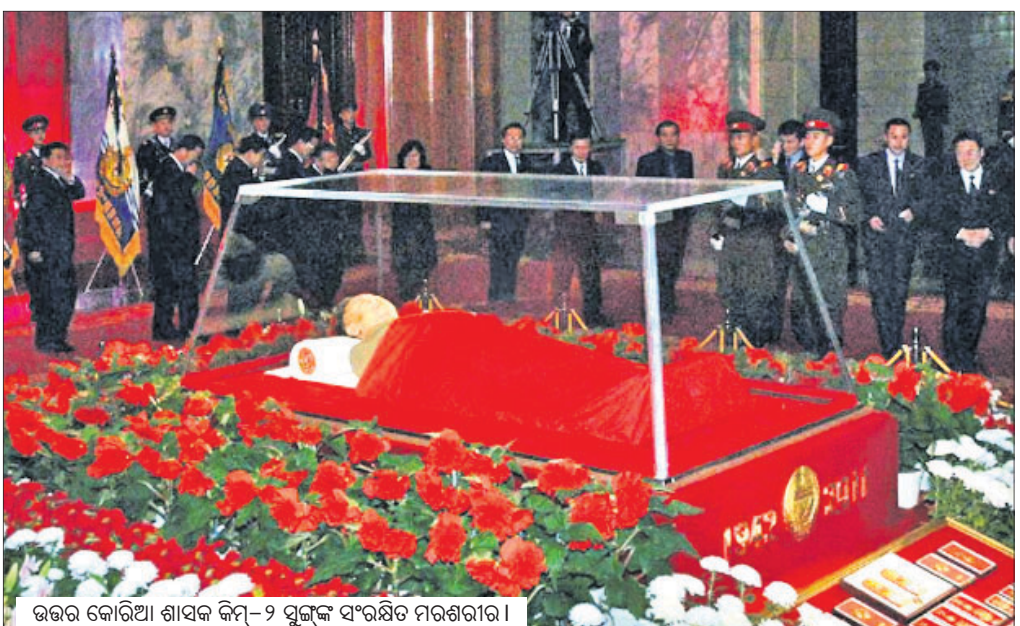
ଉତ୍ତର କୋରିଆ ଶାସକ କିମ୍-୨ ସୁଙ୍ଗଙ୍କ ସଂରକ୍ଷିତ ମରଣରାତ୍ର ।

'କମ୍‌ସୁସାନ ମେମୋରିଆଲ ପ୍ୟାଲେସ ଅଫ୍ ସନ୍'ରେ ସଂରକ୍ଷିତ ମୃତଦେହକୁ ନିର୍ଦ୍ଦିଷ୍ଟ ଦୀର୍ଘବର୍ଷ ପରେ ବି ସତେଜ ରହିଛି । ଏହାକୁ ସୁରକ୍ଷିତ ରଖିବା ଦାୟିତ୍ୱ ରୁଷିଆର 'ଲେଲିନ୍ ଲାଭ'ର ବିଶେଷଜ୍ଞଙ୍କ ଉପରେ ନ୍ୟସ୍ତ କରାଯାଇଛି । ନାମକରା କମ୍ୟୁନିଷ୍ଟ ନେତାଙ୍କ ମୃତଦେହ ସଂରକ୍ଷଣରେ 'ଲେଲିନ୍ ଲାଭ' ଗୁରୁତ୍ୱପୂର୍ଣ୍ଣ ଭୂମିକା ନିର୍ବାହ କରୁଛି । ସର୍ବପ୍ରଥମେ ୧୯୨୪ରେ କ୍ଲାଦିମର ଲେଲିନଙ୍କ ମୃତଦେହକୁ ଏଠାରେ ଏକ ସ୍ୱତନ୍ତ୍ର ପ୍ରଲେପ ଲାଗାଇ ପ୍ରଦର୍ଶନ କରାଯାଇଥିଲା । ଲାଭର ରିସର୍ଚ୍ଚନାମାନେ ପ୍ରତିବର୍ଷ ଉତ୍ତର କୋରିଆ ଯାଇ ମୃତଦେହ ତଦାରଖ କରିଥାନ୍ତି । ରୁଷିଆ ପକ୍ଷରୁ ୨୦୧୭ରେ ଦିଆଯାଇଥିବା ଏକ ତଥ୍ୟ ଅନୁଯାୟୀ, ଲେଲିନଙ୍କ ମୃତଦେହ ରକ୍ଷଣାବେକ୍ଷଣରେ ପ୍ରତିବର୍ଷ ପାଖାପାଖି ୨ ଲକ୍ଷ ଟଙ୍କାର ଖର୍ଚ୍ଚ ହେଉଛି । ଏହକୁ ଦେଖିଲେ ଉତ୍ତର କୋରିଆର ୨ଶାସକଙ୍କ ମୃତଦେହ ତଦାରଖରେ କୋଟି କୋଟି ଟଙ୍କା ଖର୍ଚ୍ଚ ହେଉଥିବା ଆକଳନ କରାଯାଇପାରେ ।