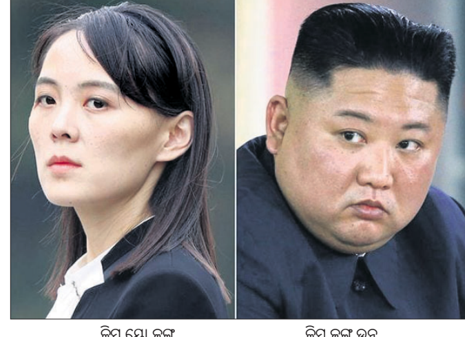
କିମ୍ ଯୋ ଜଙ୍ଗଲ୍