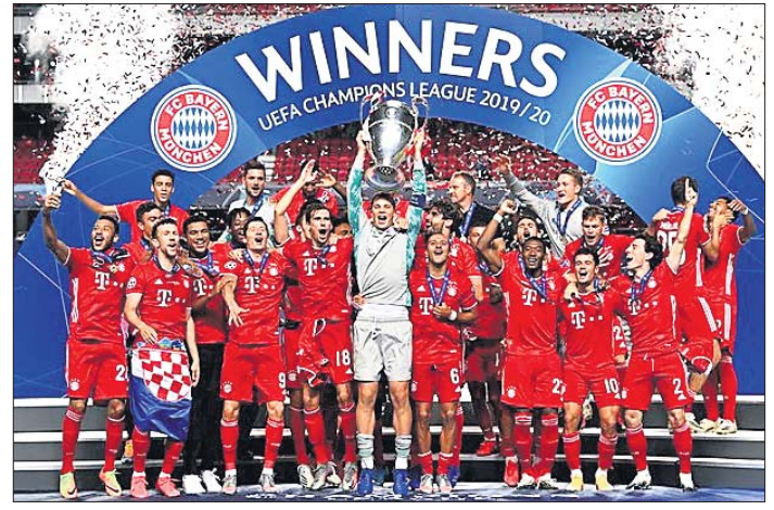
ପ୍ରତି ସହ ବେୟର୍ନ ମ୍ୟୁନିଖ୍ ଦଳ।

ଲିସ୍‌ବନ, ୨୪।୮ (ଏ.ପି) ଯୁନିୟନ ଅଫ୍ ଯୁରୋପିଆନ ଫୁଟବଲ ଆସୋସିଏଶନ (ୟୁଇଏଫଏ) ଆନୁକୂଲ୍ୟରେ ପ୍ରତିବର୍ଷ ଆୟୋଜିତ ହୋଇଥାଉଥିବା ଚାମ୍ପିୟନ୍ସ ଲିଗ୍‌ରେ ଏଥର ଜର୍ମାନୀର ଯେସାବାଦ କ୍ଲବ୍ ବେୟର୍ନ ମ୍ୟୁନିଖ୍ ବାଜି ମାରିଛି। ଦର୍ଶକଙ୍କ ଅନୁପସ୍ଥିତିରେ ରବିବାର ସ୍ଥାନୀୟ ଲିଗ୍‌ରେ ଡି ଲିଗ୍‌ରେ ଅନୁଷ୍ଠିତ ସଂଘର୍ଷପୂର୍ଣ୍ଣ ଫାଇନାଲ ମ୍ୟାଚ୍‌ରେ