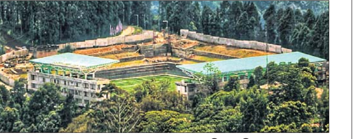
ଉଦ୍ଘାଟନ ଅପେକ୍ଷାରେ ଥିବା ବାଇରୁଜ୍ ଭୂତିଆ ଷ୍ଟାଡ଼ିୟମ।