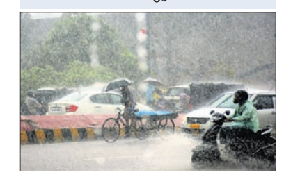
ଭୁବନେଶ୍ୱର, ୨୪।୮ (ବୁଧବୋ)

ସ୍ଥିତି ଉପରେ ନଜର ରଖିବାକୁ ଜିଲ୍ଲାପାଳଙ୍କୁ ନିର୍ଦ୍ଦେଶ