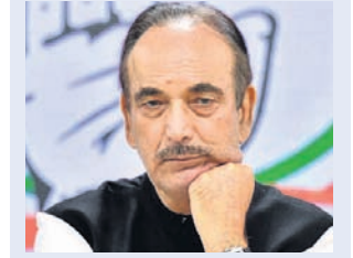
ଭାଜପା ଇଙ୍ଗିତରେ କଂଗ୍ରେସର ନେତୃତ୍ଵ ପରିବର୍ତ୍ତନ ପାଇଁ ଦସ୍ତଖତ ଅଭିଯାନ କରାଯାଇଛି ବୋଲି ରାହୁଲ ଗାନ୍ଧୀ ଆଣିଥିବା ଅଭିଯୋଗ ପ୍ରମାଣିତ ହେଲେ ଉତ୍ତପ୍ନା ହେବ । - ଗୁଲ୍ଲାମନବା ଆଜାଦ, କଂଗ୍ରେସ ନେତା

ନୂଆଦିଲ୍ଲୀ, ୨୫: ସିଡ଼ନିରେ ବିଠେଇରେ କଂଗ୍ରେସର ପୂର୍ବତନ ଅଧ୍ୟକ୍ଷ ରାହୁଲ ଗାନ୍ଧୀ ବର୍ଷିବା ପରେ ବରିଷ୍ଠ ନେତା କପିଳ ସିବଲ ତାଙ୍କୁ ଚାଟ୍ଟିଙ୍ଗ କରି ଏକ ଟୁଇଟ୍ କରିଥିଲେ । ପରେ ସେ ଉକ୍ତ ଟୁଇଟ୍ ଡିଲିଟ୍ କରିଥିବା କହିଛନ୍ତି । ସିଡ଼ନିରେ ବିଠେଇରେ ନେତୃତ୍ଵ ପରିବର୍ତ୍ତନକୁ ନେଇ ଚଣ୍ଡୀଚରୀ ଚାଲିଥିବାବେଳେ କଂଗ୍ରେସରେ ଫାଟ ସୃଷ୍ଟି ହୋଇଥିବା ଖବର ଆସିଥିଲା । ଯେଉଁ ୨୩ ଜଣ ବରିଷ୍ଠ ନେତା ନେତୃତ୍ଵ ପରିବର୍ତ୍ତନ ଲାଗି ଅନ୍ତରାଣ ଅଧ୍ୟକ୍ଷ ସୋନିଆ ଗାନ୍ଧୀଙ୍କୁ ଚିଠି ଲେଖିଥିଲେ ସେମାନଙ୍କ ମଧ୍ୟରୁ କପିଳ ସିବଲ ଅନ୍ୟତମ । ଏହାକୁ ନେଇ ରାହୁଲ ଅସମ୍ଭବ ନେତାମାନଙ୍କ ଉପରେ ବର୍ଷିଥିଲେ । ଭାଜପା ସହ ହାତ ମିଳାଇ ନେତାମାନେ ଦସ୍ତଖତ ଅଭିଯାନ କରିଥିବା ରାହୁଲ କହିଥିଲେ । ଏହା ପରେ ସିବଲ ଟୁଇଟ୍ କରି ଲେଖିଥିଲେ, ଗତ ୩୦ ବର୍ଷରେ ଭାଜପା ସପକ୍ଷରେ ମତ୍ତବ୍ୟ ଦେଇନାହାଁ । ଏହାସତ୍ତ୍ଵେ ଆମକୁ ଭାଜପା ସହ ସାଥୀତ୍ଵ କରିଥିବା କହୁଛନ୍ତି ବୋଲି ଟୁଇଟ୍ କରିଥିଲେ । ରାହୁଲ ତାଙ୍କୁ ଫୋନ୍ କରିବା ପରେ ସିବଲ ଉକ୍ତ ଟୁଇଟ୍ ଡିଲିଟ୍ କରିଦେଇଥିଲେ ।