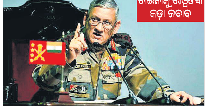
ଚୀନରୁ ରାଓଙ୍କୁ କଡ଼ା ଜବାବ ଦିଆଯିବ ବୋଲି ସେ ପ୍ରକାଶ କରିଛନ୍ତି । ଆଲୋଚନା ମୁତାବକ ଚୀନର ସେନା ସମ୍ପୂର୍ଣ୍ଣ ପ୍ରତ୍ୟାହାର କରାଯାଇ ନ ଥିବା ରାଓଙ୍କ କହିଛନ୍ତି । ଫିଙ୍ଗର ୫, ଫିଙ୍ଗର ୮ରେ ଏବେବି ଚୀନର ସେନା ଅଛନ୍ତି । ଏକ୍ସପ୍ରେସରେ ଦୁଇ ନେତୃତ୍ଵାବେଳେ କୁର୍ ୧୫ରେ ଦୁଇଦେଶ ମଧ୍ୟରେ ପୂର୍ଣ୍ଣସ୍ତୃତି ହୋଇଥିଲା । ଭାରତର ୨୦ ଯବାନ ଶହୀଦ ହୋଇଥିଲେ । ପରେ ଦୁଇଦେଶ ତିବ୍ୱିତା ଦୂର ଲାଗି ସହମତି ପ୍ରକାଶ କରିବାକୁ ଆଲୋଚନା ଆରମ୍ଭ ହୋଇଥିଲା । ଆଲୋଚନା ମୁତାବକ

ଭାରତ-ଚୀନ ସୀମା ବିବାଦର ସମାଧାନ ଲାଗି କୃତନୈତିକ ଓ ସାମରିକ ସ୍ତରରେ ଆଲୋଚନା ଜାରି ରହିଛି । ଲଦାଖରେ ଚୀନର ଅନୁପ୍ରବେଶ କରି ଚେଷ୍ଟା କରିବା ଓ ବିସ୍ତାରବାଦୀ ଆକ୍ରମଣର ସମାଧାନ ଏ ପର୍ଯ୍ୟନ୍ତ ହୋଇପାରି ନାହିଁ । ଦୁଇଦେଶର ସେନା ଅଧିକାରୀମାନେ ଆଲୋଚନା ୫ ଥର ହେଲାଣି । ତଥାପି ସମାଧାନ ହୋଇପାରି ନାହିଁ । ଆଲୋଚନା ମାଧ୍ୟମରେ ସୀମା ବିବାଦର ସମାଧାନ ହୋଇ ନ ପାରିଲେ ବିକଳ ଭାବେ ସେନା କାର୍ଯ୍ୟାନୁଷ୍ଠାନ ଗ୍ରହଣ କରାଯିବ ବୋଲି ଚିଫ୍ ଅଫ୍ ଡିଫେନ୍ସ ସ୍ଟାଫ୍(ସିଡିଏସ୍) ବିପିନ୍ ରାଓଙ୍କ ସୋମବାର କହିଛନ୍ତି । ଚୀନର ସେନାର ଲଦାଖରେ ସୀମା ଉଲ୍ଲଙ୍ଘନର କଡ଼ା ଜବାବ ଦିଆଯିବ ବୋଲି ସେ ପ୍ରକାଶ କରିଛନ୍ତି । ତେବେ ଚୀନର ସେନାକୁ ପଛକୁ ହଟାଇବା ଲାଗି ସେନା ପକ୍ଷରୁ