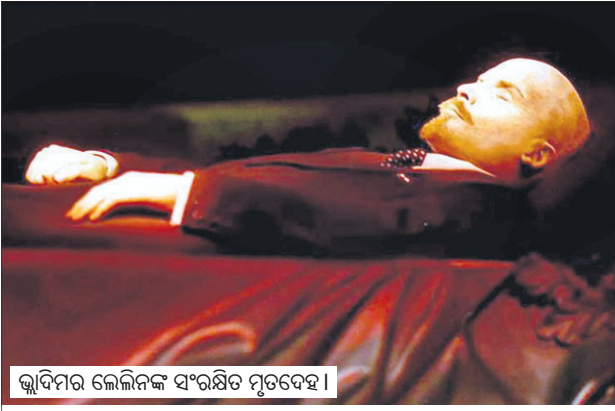
କ୍ଲାଦିମର ଲେଲିନଙ୍କ ସଂରକ୍ଷିତ ମୃତଦେହ ।