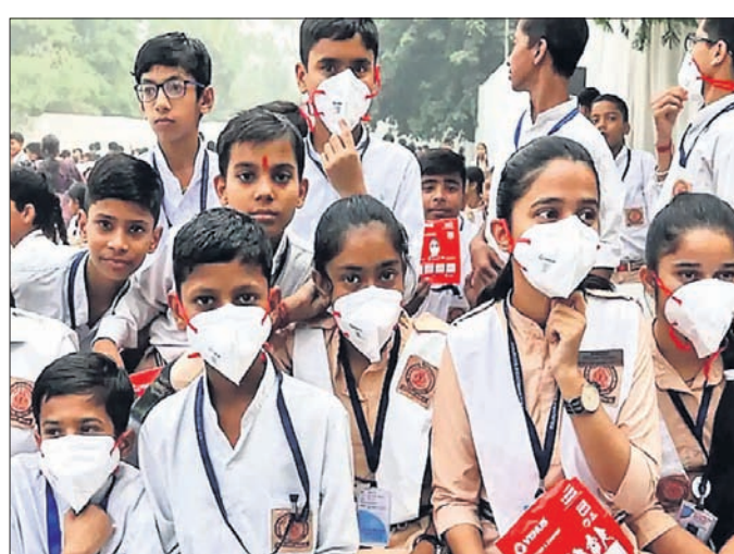
କମ୍ପରେ ଡିସେମ୍ବର ୩୧ ପର୍ଯ୍ୟନ୍ତ ହୋଇଥିଲେ । କର୍ମୀମାନେ ମଧ୍ୟ ଏଭଳି ସ୍ଥିତି ଦେଖିବାକୁ ମିଳିଥିଲା । ଏଭଳି ସ୍ଥିତି ଭାରତର ଅଭିଭାବକ ମହଲରେ ଆଡ଼କୁ ସୃଷ୍ଟିକରିବା ସ୍ଵାଭାବିକ ଅଟେ ।

ସେଠାରୁ ଜଣାପଡ଼ିଛି ଯେ, ୬୨ ପ୍ରତିଶତ ଅଭିଭାବକ ସେଠାରେ ୧୭ ପିଲାଙ୍କୁ ସ୍କୁଲକୁ ଛାଡ଼ିବା ଲାଗି ଅମଙ୍ଗ ଅଛନ୍ତି । ଲୋକାଳ ସର୍କଲ ସର୍ଭେ ଅନୁଯାୟୀ ମାତ୍ର ୬ ପ୍ରତିଶତ ନାଗରିକ ସେଠାରେ ୧୭ ପିଲାଙ୍କୁ ସ୍କୁଲକୁ ଛାଡ଼ିବା ଲାଗି ଅମଙ୍ଗ ଅଛନ୍ତି । ଆଗାମୀ ୬୦ ଦିନ ମଧ୍ୟରେ ମେଟ୍ରୋ ଓ ଲୋକାଳ ଟ୍ରେନ୍ରେ ଯିବା ଲାଗି ୩୬ ପ୍ରତିଶତ ଲୋକ ଚାହୁଁଛନ୍ତି । ଦୈନିକ ୬୦ ହଜାର ନୂଆ କରୋନା ରୋଗୀ ହିଟ୍ ହେଉଥିବାବେଳେ ଲୋକମାନେ ଏଭଳି ରହିଛନ୍ତି । ଆମେରିକାରେ ସ୍କୁଲ ଖୋଲିବାର ୨ ସପ୍ତାହ ମଧ୍ୟରେ ୯୭