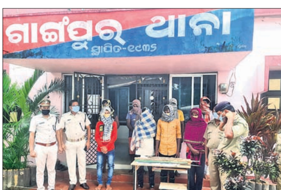
ଆନା ପରିସରରେ ଗିରଫ ଅଭିଯୁକ୍ତ।