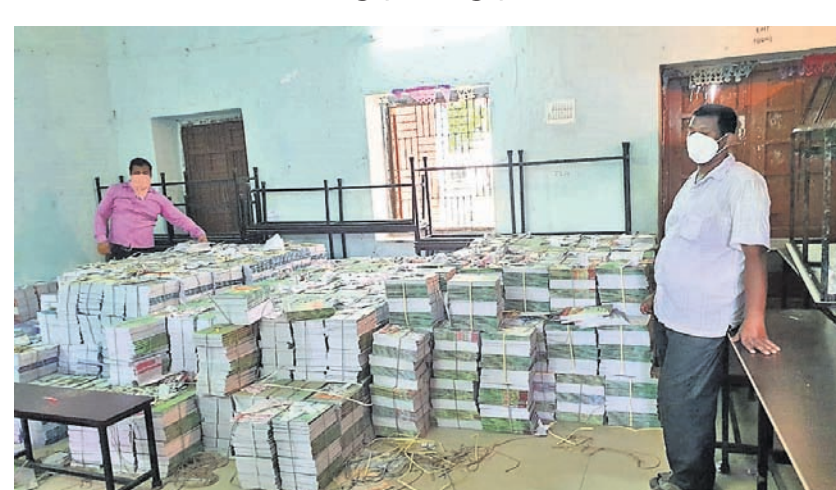
ପୁସ୍ତକ ବଣ୍ଟନ କେନ୍ଦ୍ରରେ ତିଲି ଓ କାର୍ଯ୍ୟାଳୟ ଅଧିକାରୀ।