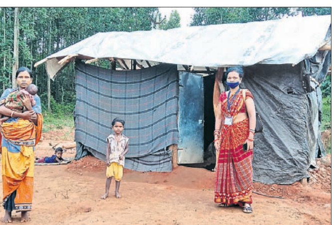
ଅସହାୟ ଯାଯାବର ପରିବାର।

ଖଲ୍ଲୁରିପଡ଼ା, (ଡି.ଏନ୍.ଏ.)/ ବଲ୍ଲଭକୃଷ୍ଣା, ୨୫୮୮