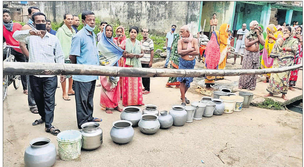
ରାସ୍ତାରେ ହାଣ୍ଡିମାଠିଆ ରଖି ଆନ୍ଦୋଳନ କରୁଛନ୍ତି ସାହିବାସିନ୍ଦା।