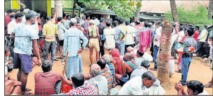
ଜିଲ୍ଲା ସେବା ସମବାୟ ସମିତିରୁ ସାର ନେବାପାଇଁ ଗାଷୀକ ଭିଡ଼।

ଗଞ୍ଜାମ ଜିଲ୍ଲାରେ ସୁରିଆ ସାର ଚଢ଼ାଦରରେ ବିକ୍ରି ହେଉଥିବା ଅଭିଯୋଗ ହୋଇଛି। ପରିବହନ ଖର୍ଚ୍ଚ କାଟି ସୁରିଆ ସାର ବସ୍ତ୍ର ପ୍ରତି ଦର ୨୬୬ଟଙ୍କା ୫୦ ପଇସାରେ ବିକ୍ରି କରିବା ପାଇଁ ନିର୍ଦ୍ଦେଶ ଥିଲେ ମଧ୍ୟ ଜିଲ୍ଲାର ଅନେକ ସେବା ସମବାୟ ସମିତିରେ ପରିବହନ ଖର୍ଚ୍ଚ ନିଆଯାଇଛି।