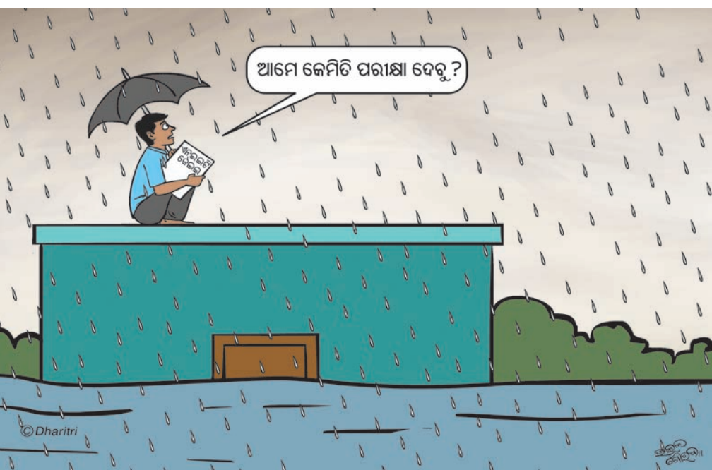
ଆମେ କେମିତି ପରୀକ୍ଷା ଦେବୁ?

ନଦୀର ରେଙ୍ଗାଲା, ତାଳଚେର ଓ ଜେନାପୁରଠାରେ ବନ୍ୟା ଜଳ ବୃଦ୍ଧି ପାଇବାରେ ଲାଗିଛି। ବଂଶଧାରା, ରଖିକୁଲ୍ୟା ଓ ଦେବୀ ନଦୀରେ ବନ୍ୟା ଜଳ ବୃଦ୍ଧି ପାଇବାରେ ଲାଗିଛି। ବର୍ଷା କମିଯାଇଥିବାରୁ କେତେକ ନଦୀରେ ମଧ୍ୟମ ଧରଣର ବନ୍ୟା ଆଶଙ୍କା ରହିଛି। ସେହିପରି ସୁବର୍ଣ୍ଣରେଖା ଓ ବୈତରଣୀରେ ମଧ୍ୟମ ଧରଣର ବନ୍ୟା ସମ୍ଭାବନା ରହିଛି। ବୁଡ଼ାବଳଙ୍ଗ