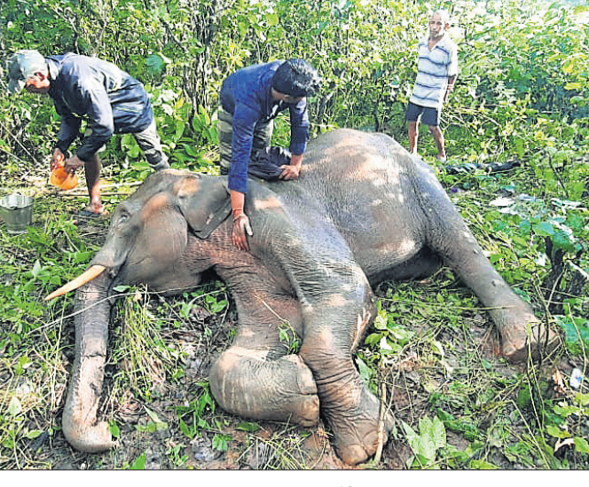
ମୃତ ଦନ୍ତା ହାତୀ।

ଢେଙ୍କାନାଳ ଅଧିକ, ୨୭।୮ ଢେଙ୍କାନାଳ ବନଖଣ୍ଡ କପିଳାସ ରେଷ୍ଟି ଅଧୀନ ବସିଆ ଗ୍ରାମ ନିକଟ ଜଙ୍ଗଲରେ ରୁଚୁବାର ଅପରାହ୍ଣରେ ଏକ ଦନ୍ତାହାତୀର ମୃତ୍ୟୁ ଘଟିଛି। ଏହାର ଆନୁମାନିକ ବୟସ ୧୫ ବର୍ଷ ହେବ। ହାତୀ-ହାତୀ ମଧ୍ୟରେ ସଂଘର୍ଷ ହୋଇ ଦନ୍ତାର ଜୀବନ ଯାଇଥିବା ବନ ବିଭାଗ ପକ୍ଷରୁ ଜଣାଯାଇଛି। ଅଞ୍ଚଳବାସୀଙ୍କ କହିବା କଥା, ୪ଦିନ ତଳେ ପଲକୁ ଅଲଗା ହୋଇଯାଇଥିବା ଉକ୍ତ ଦନ୍ତା ସହ ଅନ୍ୟ ଏକ ଦନ୍ତାର ସଂଘର୍ଷ ହୋଇଥିଲା। ଏଥିରେ ହାତୀଟିର ମଳବ୍ୱାରେ ଗଭୀର କ୍ଷତ ସୃଷ୍ଟି ହୋଇଥିଲା। ଯନ୍ତ୍ରଣାରେ ଛତପଟ ହୋଇ ସେ ଗର୍ଜନ କରୁଥିଲା। ପୂର୍ତ୍ତନା ପାଇ ବନ କର୍ମଚାରୀ ରୁଚୁବାର ସକାଳେ ଆହତ ଦନ୍ତାକୁ ଠାବ କରିବା ସହ ଚିକିତ୍ସା କରିଥିଲେ। ଚିକିତ୍ସାଧୀନ ଅବସ୍ଥାରେ ଅପରାହ୍ଣରେ ହାତୀଟିର ମୃତ୍ୟୁ ଘଟିଥିବା ରେଖିତ ଦର୍ଶିତା ଭୋଲ ପୂର୍ତ୍ତନା ଦେଇଛନ୍ତି। ଜିଲ୍ଲା ବନଖଣ୍ଡ ଅଧିକାରୀ (ଡିଏସ୍) ପ୍ରକାଶ ଚାନ୍ଦ