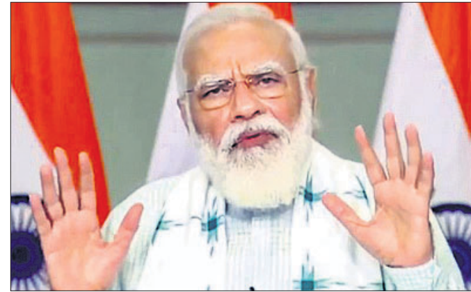
ନୂଆଦିଲ୍ଲୀ, ୨୭।୮ (ପି.ଟି.) କମାଳବା ସହ ଘରୋଇ ଶିଳ୍ପକୁ ମଜବୁତ କରିବ । ଆଗାମୀ ଦିନରେ ଆହୁରି ଅନେକ ପ୍ରତିରକ୍ଷା ସାମଗ୍ରୀ ଆମଦାନୀ ଉପରେ ରୋକ ଲାଗିବ ବୋଲି ପ୍ରଧାନମନ୍ତ୍ରୀ କହିଛନ୍ତି । ଘରୋଇ ସଂସ୍ଥାଗୁଡ଼ିକୁ ପ୍ରତିରକ୍ଷା ସେକ୍ଟରରେ ପୁଞ୍ଜିନିବେଶି ଲାଗି ସେ ଆହ୍ୱାନ କରିଛନ୍ତି । ଦୀର୍ଘବର୍ଷ ଧରି ଭାରତ ବିଶ୍ୱର ସର୍ବବୃହତ ପ୍ରତିରକ୍ଷା ଆମଦାନିକାରୀର ପରିଚୟ ହାସଲ କରିଆସିଛି । ଘରୋଇ ଉତ୍ପାଦନ ଉପରେ ଆତୀତରେ ଧ୍ୟାନ ଦିଆଯାଇ ନ ଥିଲା । ତାଙ୍କ ସରକାର ଘରୋଇ ଉତ୍ପାଦନ ବୃଦ୍ଧି ସହ ଘରୋଇ ସଂସ୍ଥା ସହଯୋଗରେ ନୂତନ ପୁଞ୍ଜିନିବେଶି କରିବାକୁ ଚାହାନ୍ତି । ଏଥିପାଇଁ ପ୍ରତିରକ୍ଷା ଉତ୍ପାଦନରେ ୭୪ ପ୍ରତିଶତ ବିଦେଶୀ ପ୍ରତ୍ୟକ୍ଷ ପୁଞ୍ଜିନିବେଶି (ଏଫଡିଆଇ)କୁ ତାଙ୍କ ସରକାର ଅନୁମତି ଦେଇଥିବା ପ୍ରଧାନମନ୍ତ୍ରୀ କହିଥିଲେ ।

ପାଇଁ ଡିଏଫ୍-୨୬ର ସମସ୍ତ ବୋଲି ଚାଇନା ସରକାରଙ୍କ ମୁଖପତ୍ର ଗ୍ଲୋବାଲ ଟାଇମ୍‌ସ୍‌ରେ କୁହାଯାଇଛି । ସେଥିପାଇଁ ଏହାର ନାଁ ରଖାଯାଇଛି 'ଏୟାରକ୍ରାଫ୍ଟ-କ୍ୟାରିୟର ଲିଲର' । ଏହାର ଲକ୍ଷ୍ୟଭେଦ କ୍ଷମତା ୪,୫୦୦ କିଲୋମିଟର ହୋଇଥିବାରୁ ଏହା ପଶ୍ଚିମ ପ୍ରଶାନ୍ତ ମହାସାଗର, ଭାରତ ମହାସାଗର ସମେତ ଗୁଆମରେ ଥିବା ଆମେରିକୀୟ ନୌସେନା ଘାଟି, ଡିଏସିଂ ଗାର୍ଡିଆର ବ୍ରିଟିଶ ଆଇଲଣ୍ଡ ଏବଂ ଏପରିକି ଅଷ୍ଟ୍ରେଲିଆର ଡାର୍‌ଫ୍ରିନ ସହରରେ ପହଞ୍ଚିପାରିବ । ଡିଏଫ୍-୨୬ଟି ମଧ୍ୟ ଏକ କାହାଜି ବିଧି-ସା ମିଶାଇଲ ସିଷ୍ଟମ । ଆମେରିକାର ଗୁପ୍ତଚର ବିଦାନ ଚାଇନା ବାୟୁସାମା ଅଟକ୍ରିମ କରିବା ପରେ