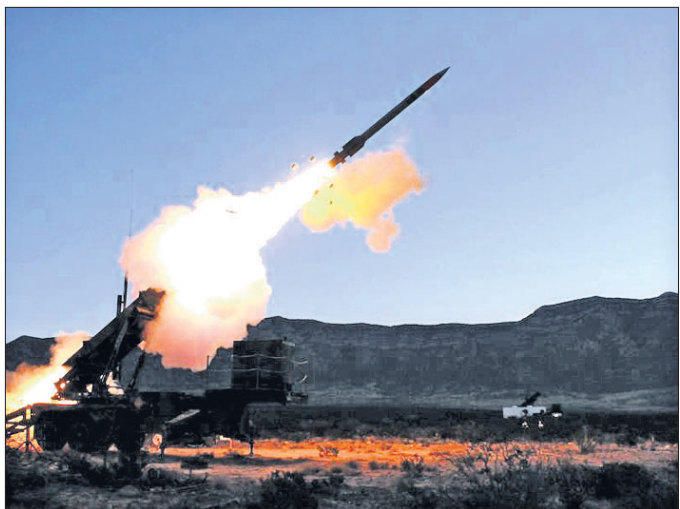
ଚାଇନା କମ୍ୟୁନିଷ୍ଟ ପାର୍ଟି ସରକାର, ଅଭୂତପୂର୍ବ କାର୍ଯ୍ୟାନୁଷ୍ଠାନ ନେବାକୁ ବାଧ୍ୟ ପିପୁଲ୍ସ ଲିବରେଶନ ଆର୍ମି (ପିଏଲଏ) କରିଛି । ସମୁଦ୍ର ମଧ୍ୟରେ ଯେକୌଣସି ଏବଂ ଏହାର କାରବାର ଉପରେ