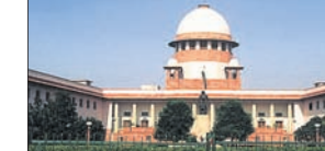
ନୂଆଦିଲ୍ଲୀ, ୨୭।୮ (ପି.ଓ.)

କେତେକ ସ୍ଥାନରେ ଗଣ ଜମି ଜଳମୟ ରହିଛି। କ୍ଷୟକ୍ଷତି ଆକଳନ କରିବାକୁ ଜିଲାପାଳମାନଙ୍କୁ ନିର୍ଦ୍ଦେଶ ଦିଆଯାଇଛି। ବନ୍ୟା ସମ୍ପର୍କରେ ସୂଚନା ଦେଇ ଏସ୍ଆରସି କହିଛନ୍ତି ଯେ ନଦୀରେ ବନ୍ୟା ଜଳ ବୃଦ୍ଧି ପାଇଛି। ବୈତରଣୀ, ବୁଡ଼ାବଳଙ୍ଗ, ଜଳକା ନଦୀରେ ବନ୍ୟାସ୍ଥିତି ରହିଛି। ସୁବର୍ଣ୍ଣରେଖା, ବ୍ରାହ୍ମଣୀ ଓ ମହାନଦୀରେ ମଧ୍ୟମ ଧରଣର ବନ୍ୟା ପରିସ୍ଥିତି ଉପୁଜିଛି। ମହାନଦୀର ମୁଖଳା ଠାରେ ପ୍ରତି ସେକେଣ୍ଡରେ ୭.୬୬ ଲକ୍ଷ କ୍ୟୁସେକ୍ ପାଣି ପ୍ରବାହିତ ହେଉଛି। ଜେନା ସୂଚନା ଦେଇଛନ୍ତି। ଏଥିସହିତ ବିଭିନ୍ନ ଜିଲ୍ଲାରେ ୩ ହଜାର କର୍ମାଘର ଆଂଶିକ କ୍ଷତିଗ୍ରସ୍ତ ହୋଇଥିବା ବେଳେ