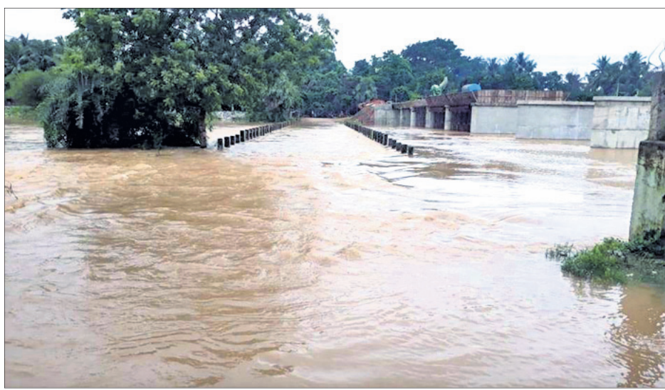
ଭଦ୍ରକ ଜିଲା ଧାମନଗର ବୁକ୍ ରେଜୁଟି ନଦୀର ଦୋବଲ ପୋଲ ଉପରେ ବନ୍ୟାଜଳ ପ୍ରବାହିତ ହେଉଛି।