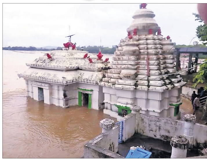
କଟକ ଜିଲା ବଡ଼ମୁଣ୍ଡିତ ଭଟ୍ଟାରିକା ମନ୍ଦିରରେ ବନ୍ୟାଜଳ ପ୍ରବେଶ କରିଛି।

ଛଡ଼ାଯାଇଛି। ଗୁରୁବାର ମହାନଦୀର ଖଲରାମାଳରେ ପ୍ରତି ସେକେଣ୍ଡରେ ୫ ଲକ୍ଷ ୯୦ ହଜାର ଘନଫୁଟ୍ ଜଳ ପ୍ରବାହିତ ହେଉଥିବା ବେଳେ ମୁଣ୍ଡଳୀରେ ୭ ଲକ୍ଷ ୨୫ ହଜାର ଏବଂ ବରମୁଣ୍ଡଳୀରେ ୭ ଲକ୍ଷ ୨୫୦ ଘନଫୁଟ୍ ଜଳ ପ୍ରବାହିତ ହେଉଛି। ହାରାକୁଦ ପାଣି ଛାଡ଼ୁଥିବାରୁ ମହାନଦୀର ଶାଖା ନଦୀଗୁଡ଼ିକରେ ବନ୍ୟା ସମ୍ଭାବନା ବଢ଼ିଯାଇଛି। ସେହିପରି ଲଘୁଚାପ ଯୋଗୁ ରାଜ୍ୟର ୫ ନଦୀ ବିପଦ ସଙ୍କେତ ଉପରେ ପ୍ରବାହିତ ହେଉଛି। ବ୍ରାହ୍ମଣୀ ନଦୀର ଚମ୍ପୁଆ, ଆନନ୍ଦପୁର ଓ ଆଖୁଆପଦାରେ ବନ୍ୟା ଆନନ୍ଦପୁର ଓ ଆଖୁଆପଦାରେ ବନ୍ୟା ହେଉଛି। ସେହିପରି ସୁବର୍ଣ୍ଣରେଖା ନଦୀର ଜାମଶୋକା ଘାଟରେ, ବୁଡ଼ାବଳଙ୍ଗ ନଦୀର ଏନ୍-ଏ-୫ ରୋଡ଼ିଫୁରରେ ଏବଂ ଜଳକା ନଦୀର ମଥାନାଠାରେ ବନ୍ୟା ଜଳ ବିପଦ ସଙ୍କେତ ଉପରେ ପ୍ରବାହିତ ହେଉଛି। ବୈତରଣୀ