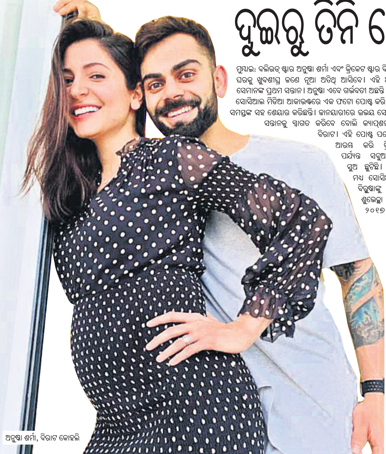
ଅନୁଷ୍ଠା ଶର୍ମା, ବିରାଟ କୋହଲି