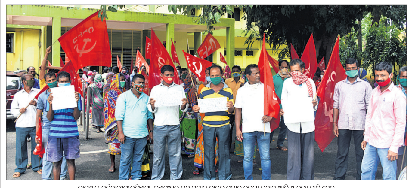
କାଠୁଆଲ କର୍ମଚାରୀଙ୍କୁ ଇଏସପି, ଇଏସଆଇ ସହ ସମାନ କାମକୁ ସମାନ ଦରମା ପ୍ରଦାନ ଆଦି ୯ ଦମ୍ପା ଦାବି ନେଇ ରୁଚ୍ଚାବାର ଓଝୁଏଟି କର୍ମଚାରୀ ସଂଘ ପକ୍ଷରୁ କୁଳପତିଙ୍କ କାର୍ଯ୍ୟାଳୟ ସମ୍ମୁଖରେ ବିକ୍ଷୋଭ ପ୍ରଦର୍ଶନ।