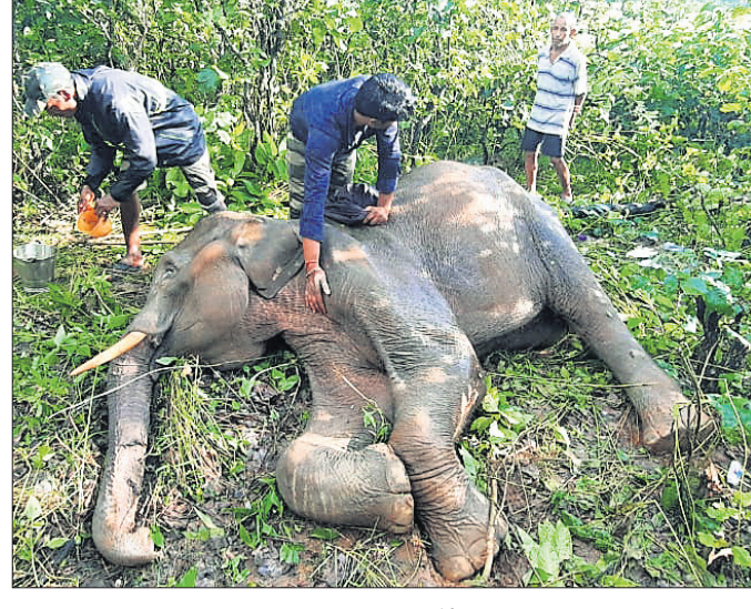
ମୃତ ଦନ୍ତା ହାତୀ। ରୁଚ୍ଚାବାର ଘଟଣାସ୍ଥଳରେ ତଦନ୍ତ କରିଛନ୍ତି। ଘଟି ହାତୀଟିର ମୃତ୍ୟୁ ଘଟିଛି। ହାତୀର ବ୍ୟବଚ୍ଛେଦ ପରେ ହାତୀ ମୃତଦେହକୁ କ୍ଷତସ୍ଥାନ ସଂକ୍ରମିତ ହୋଇଯାଇଥିଲା। ପୋଡି ଦିଆଯାଇଛି। ଏ ସଂକ୍ରାନ୍ତରେ ଆଖ୍ୟତରାଣ ଅଙ୍ଗରେ ରକ୍ତକମାଟ ଡିଏଫଓ କୁହନ୍ତି, ଦୁଇଦନ୍ତା ମଧ୍ୟରେ ସଂଘର୍ଷ ବାଧିଥିଲା ବୋଲି ସେ ସୂଚନା ଦେଇଛନ୍ତି।