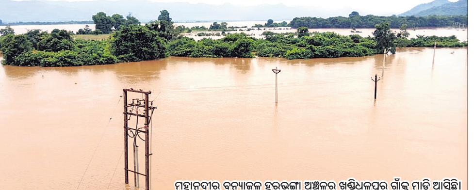
ମହାନଦୀର ବନ୍ୟାଜଳ ହରଭଙ୍ଗା ଅଞ୍ଚଳର ଖଣ୍ଡିଧଳପୁର ଗାଁକୁ ମାଡ଼ି ଆସିଛି।