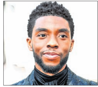
ଲସ୍ ଏଞ୍ଜେଲସ୍, ୨୯।୮ (ପି.ଟି.)

'ବ୍ଲ୍ୟାକ୍ ପାନ୍ଥର' ଚଳଚ୍ଚିତ୍ରରେ ସୁପରହିରୋ ଭୂମିକା ପାଇଁ ବେଶ୍ କଣାକଣା ଆମେରିକୀୟ ଅଭିନେତା ଚାଉଁଡ଼ିକ୍ ବୋର୍ସ୍‌ମାନ୍‌ଙ୍କର ମାତ୍ର ୪୩ ବର୍ଷ ବୟସରେ ପରଲୋକ ହୋଇଯାଇଛି। ସେ ୪ ବର୍ଷ ହେଲା କୋଲୋର୍ଡ଼ କ୍ୟାନ୍ସରରେ ପୀଡ଼ିତ ଥିଲେ। ତେବେ ସେ ତାଙ୍କ ସ୍ବାସ୍ଥ୍ୟାବସ୍ଥା ସମ୍ପର୍କରେ କଦାପି ବାହାରେ ଆଲୋଚନା କରୁ ନ ଥିଲେ। ଏକାଧିକ ଅସ୍ତ୍ରୋପଚାର ଓ କେମୋଥେରାପି ସତ୍ତ୍ୱେ ହଲିଉଡ଼ ଚଳଚ୍ଚିତ୍ର ପାଇଁ ସେ କାର୍ଯ୍ୟ କରି ରଖୁଥିଲେ। ବୋର୍ସ୍‌ମାନ୍‌ଙ୍କଠାରେ ୨୦୧୬ରେ କ୍ୟାନ୍ସର ଚିହ୍ନଟ ହୋଇଥିଲା। ଶୁକ୍ରବାର ଲସ୍ ଏଞ୍ଜେଲସ୍‌ସ୍ଥିତ ବାସଭବନରେ ତାଙ୍କର ପରଲୋକ ହୋଇଯାଇଛି। ମୃତ୍ୟୁଶୟନୀ ନିକଟରେ ତାଙ୍କ ସ୍ତ୍ରୀ ଓ ପରିବାର ସଦସ୍ୟ ଉପସ୍ଥିତ ଥିଲେ। ବୋର୍ସ୍‌ମାନ୍ ଥିଲେ ବାସ୍ତବ ଯୋଦ୍ଧା, ଯିଏ କି ପୃଷ୍ଠା-୪