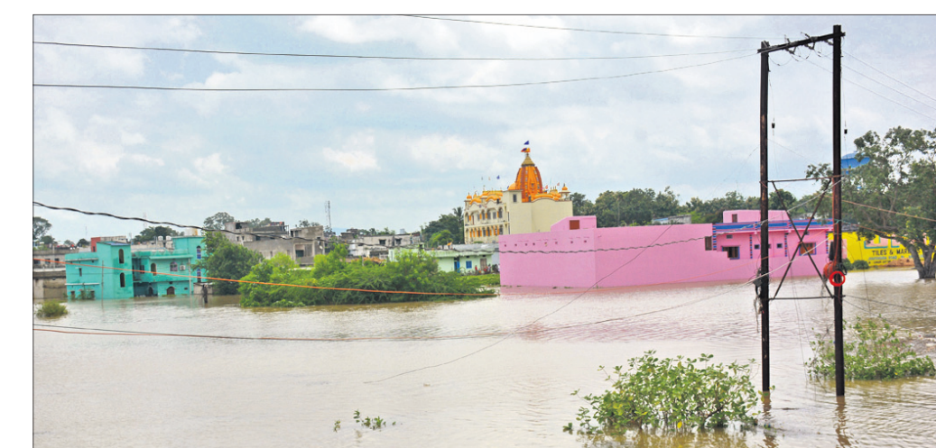
ହାରାକୁଦ ବ୍ୟାମ୍ପରୁ ୪୬ ଭୂଇଁସ୍ୱ ଗେର୍ ଖୋଲିବା ପରେ ସମ୍ବଲପୁର ମହଲିଆ ଅଞ୍ଚଳ କଳାଶୁବ।