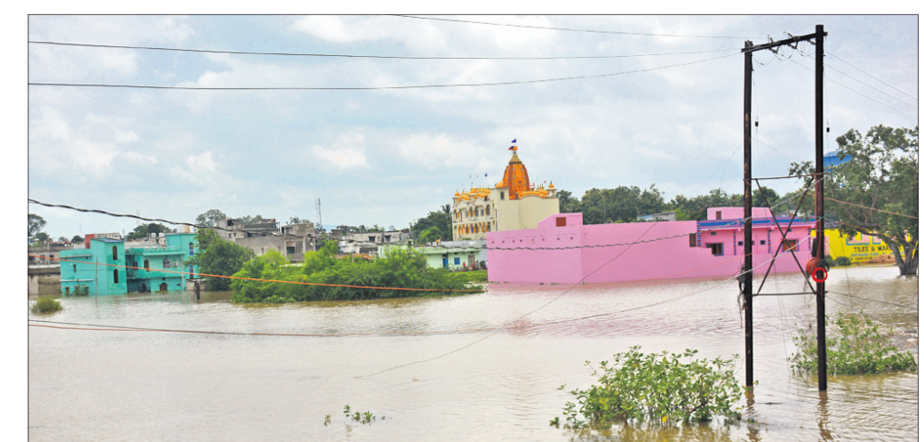
ହାରାକୁଦ ବ୍ୟାମ୍ପୁର ୪୬ ଭୂଭାଗ ଗେର୍ ଖୋଲିବା ପରେ ସମ୍ବଲପୁର ମହଲିଆ ଅଞ୍ଚଳ କଳାଶୁବ।