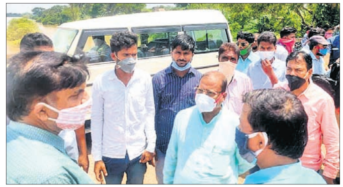
ଭୁବନେଶ୍ୱର, ୨୯।୮ (ବୁଧବେ)

ଜନସ୍ୱାସ୍ଥ୍ୟ ବିଭାଗ ପକ୍ଷରୁ ରିଲିଫ କ୍ୟାମ୍ପ ଖୋଲିଛି। ପ୍ରଭାବିତ ଅଞ୍ଚଳରେ ବିଶୁଦ୍ଧ ପାଣି ଯୋଗାଇ ଦିଆଯାଇଛି। ମହାନଦୀ ତଟରେ ଥିବା ତିପିଲିମାର ମାଁ ଘଣ୍ଟେଶ୍ୱରୀ ମନ୍ଦିର ପାଣି ଘେରରେ ରହିଛି। ସେହିପରି ଭୁବେଶ୍ୱର ବାବା, ହୁମା ବିମଳେଶ୍ୱର ବାବା, ମାନେଶ୍ୱର ମାନଧାରୀ ବାବା ମନ୍ଦିର ପାଖକୁ ବନ୍ୟାଜଳ ମାଡ଼ି ଆସିଛି। ଅନ୍ୟପଟେ ସମ୍ବଲପୁର-ସୋନପୁର ରାସ୍ତା ଭୁବେଶ୍ୱରପୁର ମାଳତୀ ନଦୀ ତ୍ରୁକ ଉପରେ ବନ୍ୟାଜଳ ପ୍ରବାହିତ ହେଉଥିବାରୁ ଯାତାୟାତ ବନ୍ଦ ରହିଛି। ମହାନଦୀ ଅବବହିକାରେ ଥିବା ଗ୍ରାମବାସୀ ଭୟରେ ଦିନ କାଟୁଛନ୍ତି।