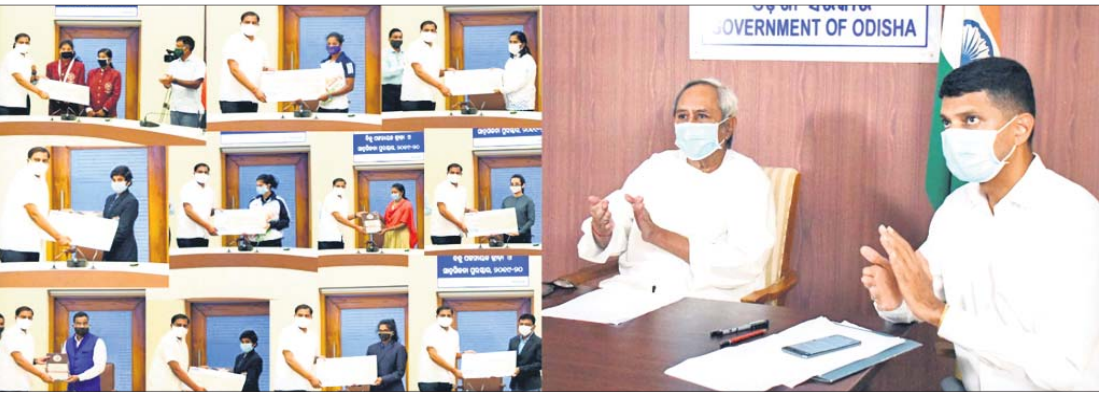
ପୁଞ୍ଜ୍ୟମନ୍ତ୍ରୀ ନବୀନ ପଟ୍ଟନାୟକ, ପୁଞ୍ଜ୍ୟମନ୍ତ୍ରୀଙ୍କ ସଚିବ (୫-ଟି) ଭି.କେ. ପାଞ୍ଜିଆନଙ୍କ ଉପସ୍ଥିତିରେ କ୍ରୀଡ଼ାମନ୍ତ୍ରୀ ରୁଷାରକାନ୍ତି ବେହେରା ପୁରସ୍କାର ପ୍ରଦାନ କରୁଛନ୍ତି।