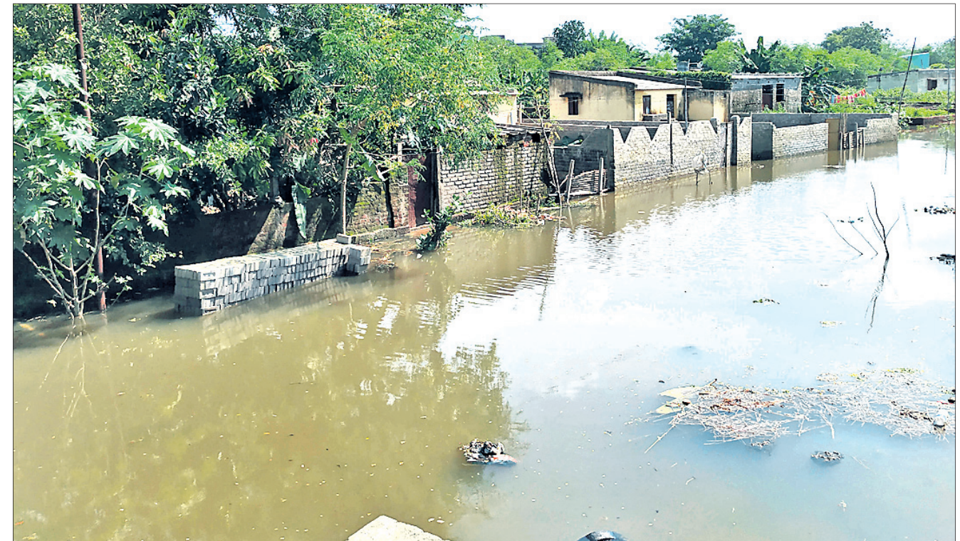
କଟକ ରିଂବନ୍ଧରେ ଝର ପୁଷ୍ପିହୋଇ ମହାନଦୀ ବନ୍ୟାଜଳ ବ୍ରଜବିହାରୀପୁର ଅଞ୍ଚଳରେ ପ୍ରବେଶ କରିବା ଯୋଗୁ ଘରଗୁଡ଼ିକ ପାଣିଘେରରେ ରହିଛି।