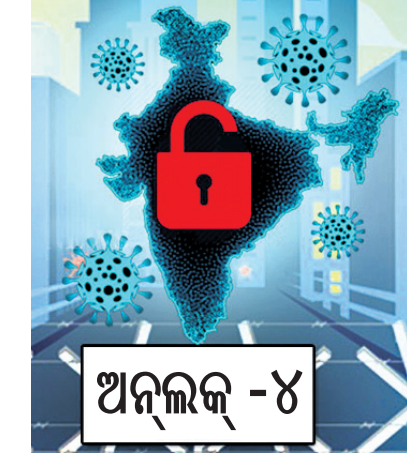
ଅନୁଲକ୍ - ୪

ବୃତ୍ତାବଳୀ, ୨୯।୮ ସେପ୍ଟେମ୍ବର ପହିଲାକୁ ଦେଶରେ ଅନୁଲକ୍ ୪ ଆରମ୍ଭ ହେଉଥିଲାବେଳେ ଏଥିପାଇଁ ସ୍ୱରାଷ୍ଟ୍ର ମନ୍ତ୍ରଣାଳୟ ପକ୍ଷରୁ ଶନିବାର ମାର୍ଗଦର୍ଶିକା ଜାରି ହୋଇଛି। ଏହି ଗାଇଡ଼ଲାଇନ ଅନୁଯାୟୀ ସେପ୍ଟେମ୍ବର ୭ରୁ ପର୍ଯ୍ୟାୟକ୍ରମେ ମେଟ୍ରୋ ରେଳସେବା ଆରମ୍ଭ ହେବ। ଏଥିପାଇଁ ଖୁବ୍‌ଶୀଘ୍ର ଗୃହନିର୍ମାଣ ଓ ସହରାଞ୍ଚଳ ବ୍ୟାପାର ମନ୍ତ୍ରଣାଳୟ ଶ୍ୱାଘାତ ଅପରେଟିଂ ପ୍ରୋସିଜର (ଏସ୍‌ଓପି) ଜାରି କରିବେ। ଚତୁର୍ଥ ପର୍ଯ୍ୟାୟ ଅନୁଲକ୍‌ରେ ସେପ୍ଟେମ୍ବର ୨୧ରୁ ସାମାଜିକ, ରାଜନୈତିକ, ଶୈକ୍ଷିକ, କ୍ରୀଡ଼ା, ଧର୍ମାୟ ତଥା ଅନ୍ୟାନ୍ୟ ଉପରେ ୧୦୦ ଜଣ ଲୋକଙ୍କୁ ଭାଗନେବା ଲାଗି ଅନୁମତି ମିଳିବ। ସେପ୍ଟେମ୍ବର ୩୦ ପର୍ଯ୍ୟନ୍ତ ଶିକ୍ଷାନୁଷ୍ଠାନ ବନ୍ଦ ରଖିବାକୁ କୁହାଯାଇଛି। ତେବେ ସ୍କୁଲକୁ ୫୦ ପ୍ରତିଶତ ଶିକ୍ଷକ ଆସିବେ। ଏହି