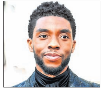
ଲସ୍ ଏଞ୍ଜେଲସ୍, ୨୯।୮ (ପି.ଟି.)

'ବ୍ଲ୍ୟାକ୍ ପାନ୍ଥର' ଚଳଚ୍ଚିତ୍ରରେ ସୁପରହିରୋ ଭୂମିକା ପାଇଁ ବେଶ୍ କଣାକଣା ଆମେରିକୀୟ ଅଭିନେତା ଚାନ୍ସଲର ବୋର୍ସ୍‌ମାନ୍‌ଙ୍କର ମାତ୍ର ୪୩ ବର୍ଷ ବୟସରେ ପରଲୋକ ହୋଇଯାଇଛି। ସେ ୪ ବର୍ଷ ହେଲା କୋଲୋର୍ଡ଼ କ୍ୟାନ୍ସରରେ ପୀଡ଼ିତ ଥିଲେ। ତେବେ ସେ ତାଙ୍କ ସ୍ୱାସ୍ଥ୍ୟାବସ୍ଥା ସମ୍ପର୍କରେ କଦାପି ବାହାରେ ଆଲୋଚନା କରୁ ନ ଥିଲେ। ଏକାଧିକ ଅସ୍ତ୍ରୋପଚାର ଓ କେମୋଥେରାପି ସତ୍ତ୍ୱେ ହଲିଉଡ୍ ଚଳଚ୍ଚିତ୍ର ପାଇଁ ସେ କାର୍ଯ୍ୟ କରି ରଖୁଥିଲେ। ବୋର୍ସ୍‌ମାନ୍‌ଙ୍କଠାରେ ୨୦୧୬ରେ କ୍ୟାନ୍ସର ଚିହ୍ନଟ ହୋଇଥିଲା। ଶୁକ୍ରବାର ଲସ୍ ଏଞ୍ଜେଲସ୍‌ସ୍ଥିତ ବାସଭବନରେ ତାଙ୍କର ପରଲୋକ ହୋଇଯାଇଛି। ମୃତ୍ୟୁଶୟନା ନିକଟରେ ତାଙ୍କ ସ୍ତ୍ରୀ ଓ ପରିବାର ସଦସ୍ୟ ଉପସ୍ଥିତ ଥିଲେ। ବୋର୍ସ୍‌ମାନ୍ ଥିଲେ ବାସ୍ତବ ଯୋଦ୍ଧା, ଯିଏ କି ୧୨୫-୪