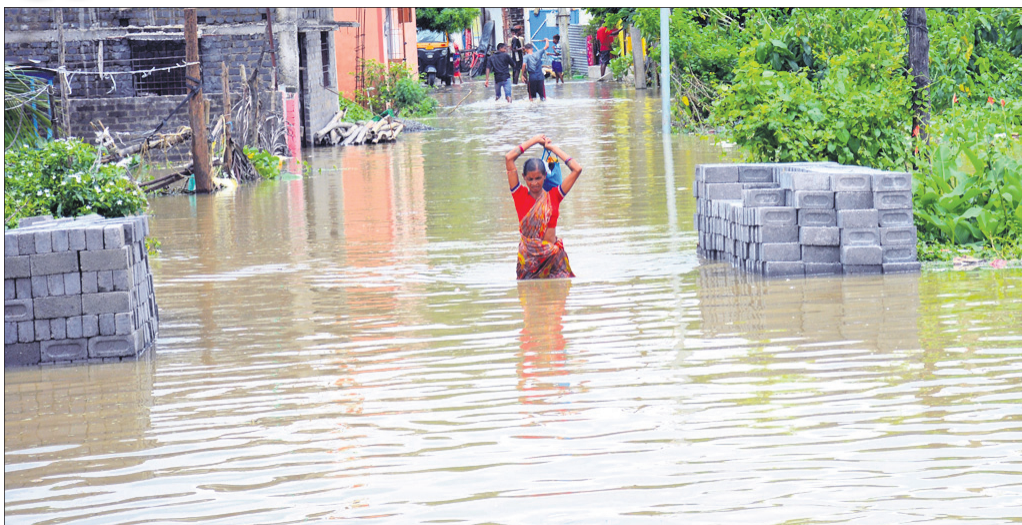
ହାରାକୁଦରୁ ଜଳ ନିଷ୍କାସନ ପରେ ସମ୍ବଲପୁର ଚନ୍ଦନନଗରରେ ପାଣି ପଶିବା ଫଳରେ କଣେ ମହିଳା ଭଳ ଗୁମ୍ଫାକୁ ଆସୁଛନ୍ତି।