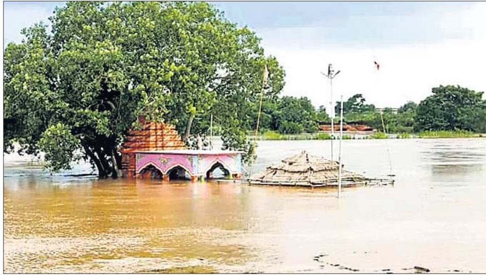
ଭଣ୍ଡାରିପୋଖରୀ ଅଞ୍ଚଳରେ ଏକ ମନ୍ଦିର ପାଣିରେ ବୁଡି ରହିଛି।

ଲଗାଶ ବର୍ଷା ଯୋଗୁ ଭଦ୍ରକ ଜିଲାର ଭଦ୍ରକ, ଭଣ୍ଡାରିପୋଖରୀ, ଧାମନଗର, ବାସୁଦେବପୁର, ବନ୍ତ, ଚାନ୍ଦବାଲି, ଚିହ୍ନି, ଧାମନଗର ଏନ୍.ଏସି, ଭଦ୍ରକ ପୌରପାଳିକା, ଚାନ୍ଦବାଲି ଏନ୍.ଏସି ଓ ବାସୁଦେବପୁର ପୌରପାଳିକାର ୧୧୮ଟି ପଞ୍ଚାୟତର ୧ଲକ୍ଷ ୫୬ହଜାର ୧୧୩ଲୋକ ପ୍ରଭାବିତ ହୋଇଛନ୍ତି।