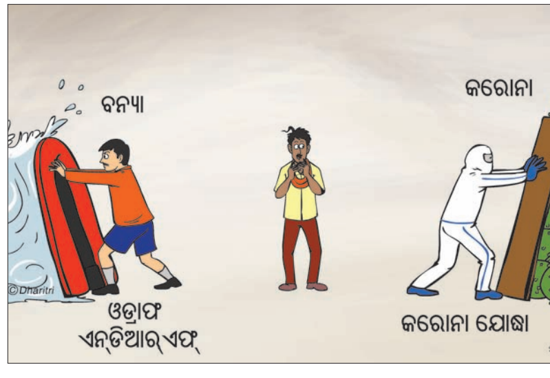
ବନ୍ୟା କରୋନା ଓଡ଼ାଏ ଏନ୍‌ଡିଆର ଏଫ୍ କରୋନା ଯୋଗା

ଶ୍ରେଣୀ ପର୍ଯ୍ୟନ୍ତ ଛାତ୍ରଛାତ୍ରୀଙ୍କୁ ଯାଇପାରିବେ। ଅନୁଲକ୍ ୪ରେ ଆନ୍ତରାଜ୍ୟ କ୍ରିୟା ରାଜ୍ୟ ଭିତରେ ଗମନାଗମନ ଓ ମାଲ୍ ୧୨୫-୪