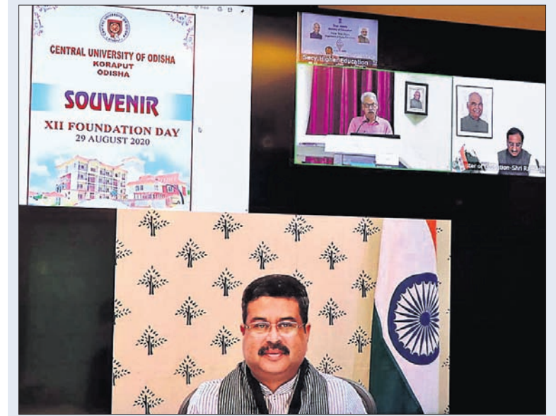
କେନ୍ଦ୍ରୀୟ ଧର୍ମେନ୍ଦ୍ର ପ୍ରଧାନ ଭିତ୍ତି କନଫରେନ୍ସ କରିଆରେ କୋରାପୁଟର ଓଡ଼ିଶା କେନ୍ଦ୍ରୀୟ ବିଶ୍ୱବିଦ୍ୟାଳୟର ଦ୍ୱାଦଶତମ ପ୍ରତିଷ୍ଠା ଦିବସ କାର୍ଯ୍ୟକ୍ରମରେ ଉଦ୍‌ବୋଧନ ଦେଉଛନ୍ତି।

ଭୁବନେଶ୍ୱର, ୨୯।୮ (ବ୍ୟବହାର) ନିର୍ମାଣରେ ଅଗ୍ରଣୀ ଭୂମିକା ନିର୍ବାହ କରିବ ବୋଲି କେନ୍ଦ୍ରୀୟ ଧର୍ମେନ୍ଦ୍ର ପ୍ରଧାନ କହିଛନ୍ତି। ଶନିବାର ଭିତ୍ତି କନଫରେନ୍ସ କରିଆରେ କୋରାପୁଟର ଓଡ଼ିଶା କେନ୍ଦ୍ରୀୟ ବିଶ୍ୱବିଦ୍ୟାଳୟର ଦ୍ୱାଦଶତମ ପ୍ରତିଷ୍ଠା ଦିବସରେ ଆୟୋଜିତ ଶିଳାନ୍ୟାସ କାର୍ଯ୍ୟକ୍ରମରେ ଯୋଗଦେଇ କେନ୍ଦ୍ରୀୟ ପ୍ରଧାନ ଏହା କହିଛନ୍ତି।