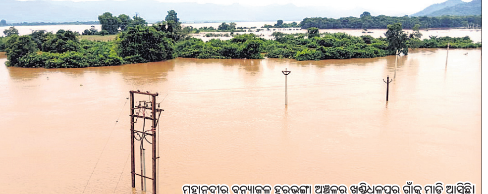
ମହାନଦୀର ବନ୍ୟାଜଳ ହରଭଙ୍ଗା ଅଞ୍ଚଳର ଖଣ୍ଡିଧଳପୁର ଗାଁକୁ ମାଡି ଆସିଛି।

ଲତୁରାପ ପ୍ରଭାବରେ ଉପରପୁଞ୍ଜରେ ତିନିଦିନ ଧରି ଲଗାଣ ବର୍ଷା ଯୋଗୁ ମହାନଦୀରେ ଏକ ବଡ଼ଧରଣର ବନ୍ୟା ଆସିବା ଆଶଙ୍କା ସୃଷ୍ଟି ହୋଇଛି। ଏଥିଯୋଗୁ ବୌଦ୍ଧ ଜିଲ୍ଲା ହରଭଙ୍ଗା ତହସିଲ ଅଧୀନରେ ଥିବା କୁଶଙ୍ଗ, ହରଭଙ୍ଗା, ଶଙ୍କୁଳକ, ଧଳପୁର, ରାମଗଡ, ବୀରନରସିଂହପୁର, ସାମୋଡ, ସରସରୀ ସମେତ ୯ଟି ପଞ୍ଚାୟତର ପ୍ରାୟ ୫୦ରୁ ଉର୍ଦ୍ଧ୍ୱ ନଦୀକୂଳିଆ ଗାଁ ବନ୍ୟାରେ ପ୍ରଭାବିତ ହୋଇଛି। ପରିସ୍ଥିତିକୁ ଦୃଷ୍ଟିରେ ରଖି ଜିଲ୍ଲା ପ୍ରଶାସନ ପକ୍ଷରୁ ତଳିଆ ଅଞ୍ଚଳ ଲୋକଙ୍କୁ ଉଦ୍ଧାରଣ ବନ୍ୟା ଆଶ୍ରୟଘୁମ୍ଫାକୁ ଚାଲିଯିବା