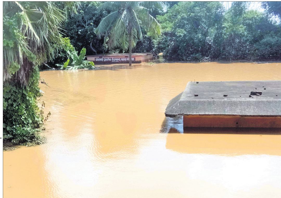
ବିରୁପା ନଦୀ ବନ୍ୟାଜଳରେ ଯାଜପୁର ଜିଲ୍ଲା ବଡ଼ଚଣା ବ୍ଲକ୍ ବାଲିପଡ଼ିଆ ପଞ୍ଚାୟତର ଉତ୍ତରଦେପୁରୀ ଗ୍ରାମର ପ୍ରାଥମିକ ବିଦ୍ୟାଳୟ ବୁଡ଼ିଯାଇଛି।

ପଶିଥିବା ବନ୍ୟାଜଳକୁ ପମ୍ପ ସାହାଯ୍ୟରେ ନିଷ୍କାସନ କରାଯାଇଛି। ଅଗ୍ନିଶମ ବିଭାଗ, ସ୍ୱାସ୍ଥ୍ୟ ବିଭାଗ ଓ ଅନ୍ୟାନ୍ୟ ବିଭାଗର ଅଧିକାରୀମାନେ ବନ୍ୟା ପରିସ୍ଥିତିର ପୂର୍ବାପାଳି ପାଇଁ ନିୟୋଜିତ ରହିଛନ୍ତି।