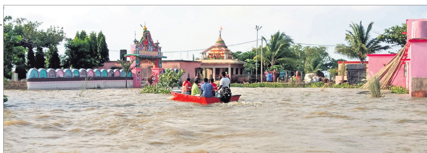
ପୁରୀ ଜିଲ୍ଲା କଣାସ ବ୍ଲକ୍‌ର ବଡ଼ାସ ଅଞ୍ଚଳରେ ପ୍ରବେଶ କରିଥିବା ବନ୍ୟା ନଦୀର ବନ୍ୟାଜଳ।