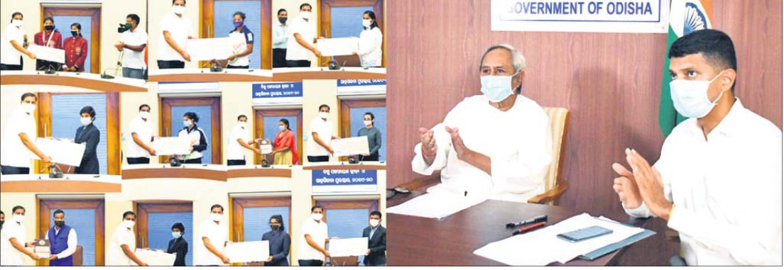
ପୁରସ୍କାର ନବୀନ ପଟ୍ଟନାୟକ, ମୁଖ୍ୟମନ୍ତ୍ରୀଙ୍କ ସହିତ (୫-ତଂ) ଡି.କେ. ପାଣ୍ଡିଆନଙ୍କ ଉପସ୍ଥିତିରେ କ୍ରୀଡ଼ାମନ୍ତ୍ରୀ ଦୁର୍ଗାଧର କୁମାର ପୁରସ୍କାର ପ୍ରଦାନ କରୁଛନ୍ତି।