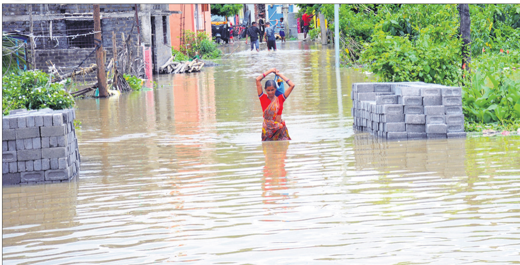
ହାରାକୁଦରୁ ଜଳ ନିଷ୍କାସନ ପରେ ସମ୍ବଲପୁର ଚନ୍ଦନନଗରରେ ପାଣି ପଶିବା ଫଳରେ କଣେ ମହିଳା ଭଳ ଗୁମ୍ଫାକୁ ଆସୁଛନ୍ତି।