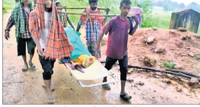
ତମେଇକ୍ ଷ୍ଟେଡିଂରେ ବୋହି ଆହୁଲାନ୍ତ ନିଆଯାଇଛି।

ଅଦିବାସୀ ଅଧିଷ୍ଠିତ ନବରଙ୍ଗପୁର ଜିଲ୍ଲାରେ ଏବେ ବି ଅନେକ ଗ୍ରାମକୁ ଯାବାଯାବତ ଅପହଞ୍ଚ ହୋଇରହିଛି।