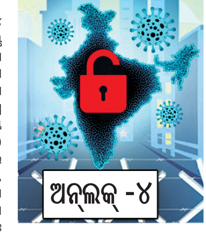
ଅନୁଲକ୍ - ୪

ବୃଥାବିଳା, ୨୯।୮ ସେପ୍ଟେମ୍ବର ପହିଲାକୁ ଦେଶରେ ଅନୁଲକ୍ ୪ ଆରମ୍ଭ ହେଉଥିଲାବେଳେ ଏଥିପାଇଁ ସ୍ୱରାଷ୍ଟ୍ର ମନ୍ତ୍ରଣାଳୟ ପକ୍ଷରୁ ଶନିବାର ମାର୍ଗଦର୍ଶିକା ଜାରି ହୋଇଛି। ଏହି ଗାଇଡ଼ଲାଇନ ଅନୁଯାୟୀ ସେପ୍ଟେମ୍ବର ୭ରୁ ପର୍ଯ୍ୟାୟକ୍ରମେ ମେଟ୍ରୋ ରେଳସେବା ଆରମ୍ଭ ହେବ। ଏଥିପାଇଁ ଖୁବ୍‌ଶୀଘ୍ର ଗୃହନିର୍ମାଣ ଓ ସହରାଞ୍ଚଳ ବ୍ୟାପାର ମନ୍ତ୍ରଣାଳୟ ଶ୍ଯାଞ୍ଚର୍ତ୍ତ ଅପରେଟିଂ ପ୍ରୋସିଜର (ଏସ୍‌ଓପି) ଜାରି କରିବେ। ଚତୁର୍ଥ ପର୍ଯ୍ୟାୟ ଅନୁଲକ୍‌ରେ ସେପ୍ଟେମ୍ବର ୨୧ରୁ ସାମାଜିକ, ରାଜନୈତିକ, ଶୈକ୍ଷିକ, କ୍ରୀଡ଼ା, ଧର୍ମୀୟ ତଥା ଅନ୍ୟାନ୍ୟ ଉତ୍ସବରେ ୧୦୦ ଜଣ ଲୋକଙ୍କୁ ଭାଗନେବା ଲାଗି ଅନୁମତି ମିଳିବ। ସେପ୍ଟେମ୍ବର ୩୦ ପର୍ଯ୍ୟନ୍ତ ଶିକ୍ଷାନୁଷ୍ଠାନ ବନ୍ଦ ରଖିବାକୁ କୁହାଯାଇଛି। ତେବେ ସ୍କୁଲକୁ ୫୦ ପ୍ରତିଶତ ଶିକ୍ଷକ ଆସିବେ। ଏହି