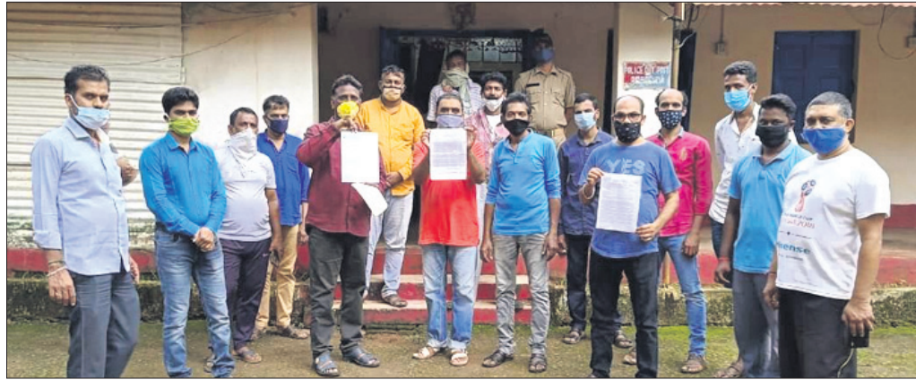
ଅଭିଯୋଗ କରିବାକୁ ଆସିଥିବା ଗ୍ରାମବାସୀ।