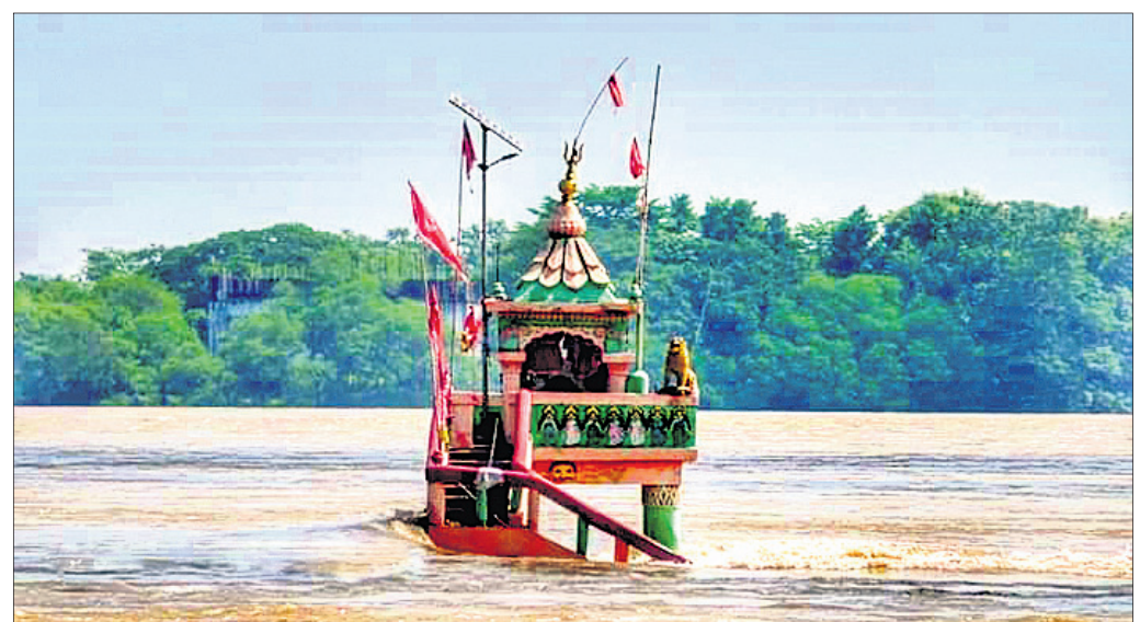
ମହାନଦୀ ଉତ୍ତୁଳିବା ଯୋଗୁ ମହାନଦୀ ଗର୍ଭରେ ଥିବା ଲକ୍ଷ୍ମଣା ପୀଠ।

ଭୁବନେଶ୍ୱର ଜିଲ୍ଲାର ମହାନଦୀ କୂଳିଆ ଅଞ୍ଚଳରେ ବନ୍ୟା ସ୍ଥିତି ଧୀରେ ଧୀରେ ଗଢ଼ା ହେବାରେ ଲାଗିଛି। ଲତୁରାପ ଜନିତ ଲଗାଣ ବର୍ଷା ଥିବା ପରେ ତେଜ ନଦୀ ଓ ଅନ୍ୟ ଛୋଟ ଛୋଟ ନଦୀ, ନାଳର ଜଳସ୍ତର କମିଛି। ତେବେ ମହାନଦୀର ଜଳସ୍ତର ଜ୍ରମାଗତ ଭାବେ ବୃଦ୍ଧି ପାଇଛି। ଶନିବାର ବିନିକା ଓ ସୋନପୁର ସହରକୁ ବନ୍ୟା ପାଣି ପ୍ରବେଶ କରିଛି। ବିନିକାର ଚୁଲପତା ଓ ମନହରିପତା ପାଣି ଘେରରେ ରହିଛି। ଲୋକେ ତଙ୍ଗାରେ ଯାତାୟାତ କରୁଛନ୍ତି। ପୁଞ୍ଜ୍ୟ ରାସ୍ତା ପାର୍ଶ୍ୱ କଲେଜ ଛକ ଠାରେ ଥିବା ନୀଳକଣ୍ଠେଶ୍ୱର ମନ୍ଦିର ଭିତରେ ଆଶୁପ ପାଣି ରହିଛି। ପାଟିକାରପତା, ମନହରିପତା ଓ ନୀଳକଣ୍ଠ ନଗରକୁ ମହାନଦୀର ବନ୍ୟାଜଳ ଛୁଇଁଲାଣି। ସୋନପୁର ସହରର ତରିଆପତାରେ ବନ୍ୟାଜଳ ପ୍ରବେଶ କରିଛି। ଲୋକେ ପାଣି ଘେରରେ ରହିଛନ୍ତି। ସୋନପୁର-ସମ୍ବଲପୁର ରାସ୍ତାର ଏସ୍.ପତ୍ରାପାଳି ଠାରେ ରାସ୍ତା ଉପରେ ଶନିବାର ବନ୍ୟାଜଳ ପ୍ରବାହିତ ହେଉଛି। ଉଲୁଣ୍ଡା ବ୍ଲକ୍ ପୁଞ୍ଜ୍ୟାପାଟ-ପଞ୍ଚାୟତର ମୁଣ୍ଡୋଘାଟ, ବେଜପୁର ଓ ହିକୁଡି ଗାଁ ଏବେ ଜଳ ଘେରରେ ରହିଛି। ନଦୀକୂଳିଆ ଅପଟ ନୂଆଗଡ, ନୂଆପାଳି, ବୁରୋଘାଟ, ଖଣ୍ଡେଶ୍ୱରୀପାଳି, ଦେଉଳି, ପୁଲୁଚରା, ନୂଆଗଡ ଓ ତେଲଗାଁର ଅଧିବାସୀ ଏବେ ଆତଙ୍କିତ ଅବସ୍ଥାରେ