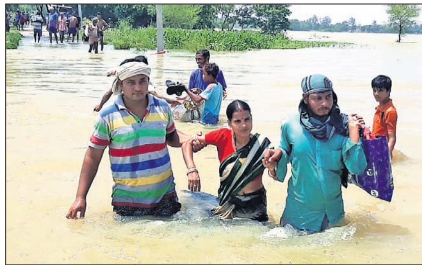
ଭଦ୍ରକ ଜିଲା ଚିହିଡ଼ି-କାଁପଡ଼ା ରାସ୍ତାରେ ଲୋକେ ପାଣିରେ ପଶି ଯାଉଛନ୍ତି ।