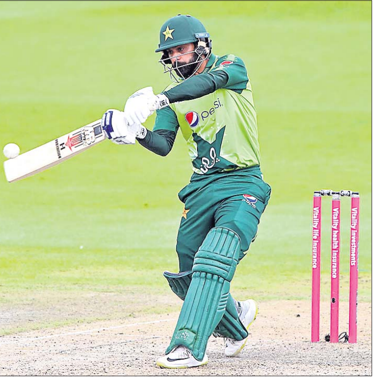
ଦ୍ରୁତ ଅର୍ଦ୍ଧଶତକୀୟ ଇନିଂସ୍ ଅବସରରେ ମହମ୍ମଦ ହାଫିଜ । ଏହାପରେ ବାବର ୪୪ ବଲରୁ ୬ ଚୌକା ସହ ୫୬ ରନର ଅର୍ଦ୍ଧଶତକୀୟ ପାକି ଖେଳି ପ୍ୟାଭିଲିୟନ ଫେରିଥିଲେ । ଅଭିଜ୍ଞ ସୋଏବ ମଲିକ ୧୪ ରନ କରି ଆଉଟ ହୋଇଥିଲେ । ଇଫ୍‌ତିକାର ଅହମ୍ମଦ ୮ ରନ କରି ଅପରାଜିତ ରହିଥିଲେ । ହାଫିଜ୍ ଦ୍ରୁତଗତିରେ ରନ ସଂଗ୍ରହ କରିଥିଲେ । ସେ ମାତ୍ର ୩୨ଟି ବଲର ସମ୍ମୁଖୀନ ହୋଇ ୫ ଚୌକା ଓ ୪ ଛକା ସହ ୬୯ ରନ କରିଥିବା ବେଳେ ଚମ୍ପ କୁରାନଙ୍କ ବଲରେ ଇଆନ ମୋର୍ଗାନଙ୍କୁ କ୍ୟାଚ୍ ଦେଇ ପ୍ୟାଭିଲିୟନ ଫେରିଥିଲେ । ବୋଲିଂରେ ଇଂଲଣ୍ଡ ତରଫରୁ ଲେଗ୍ ସ୍ପିନର ଆଦିଲ ରସିଦ୍ ୨, କିଏ କୋର୍ଡାନ ଓ ଚମ୍ପ କୁରାନ ଗୋଟିଏ ଲେଖାଏ ଉଇକେଟ ଅକ୍ତିଆର କରିଥିଲେ ।

ମାଷ୍ଟେଷ୍ଟର, ୩୦।୮ (ପି.ଟି.) ସ୍ଥାନୀୟ ଓଲ୍ ଟ୍ରାଫୋର୍ଟ ଗ୍ରାଉଣ୍ଡରେ ରବିବାର ଅନୁଷ୍ଠିତ ପାକିସ୍ତାନ ବିପକ୍ଷ ଦ୍ୱିତୀୟ ଟି୨୦ ମ୍ୟାଚ୍‌ରେ ଯଦିବଦ୍ ଇଂଲଣ୍ଡ ୫ ଉଇକେଟରେ ବିଜୟ ହାସଲ କରିଛି । ଫଳରେ ୩ ମ୍ୟାଚ୍ ବିଶିଷ୍ଟ ଏହି ସିରିଜରେ ଦଳ ୧-୦ରେ ଅଗ୍ରଣୀ ହାସଲ କରିଛି । ଚମ୍ପ ହାରି ବ୍ୟାଟ୍ ପାଇଁ ଆମନ୍ତ୍ରଣ ପାଇଥିବା ପାକିସ୍ତାନ ୪ ଉଇକେଟ ହରାଇ ୧୯୫ ରନ ସଂଗ୍ରହ କରିଥିଲା । ଜବାବରେ ଇଂଲଣ୍ଡ ୧୯୧ ଓଭରରେ ୫ ଉଇକେଟ ବିନିହୀନରେ ୧୯୯ ରନ କରି ବିଜୟ ହାସଲ କରିଛି । ଇଂଲଣ୍ଡ ତରଫରୁ ଅଧିନାୟକ ଇଆନ ମୋର୍ଗାନ ସର୍ବାଧିକ ୬୬ (୩୩ବଲ, ୬ ଚୌକା, ୪ ଛକା), ଜନୀ ବେୟାରଣ୍ଡେ ୪୪, ଚମ୍ପ ବାଣ୍ଟନ ୨୦, ସାମ ବିଲ୍‌ଜ୍‌ସ୍ ୧୦ ରନ କରି ଆଉଟ ହୋଇଥିବା ବେଳେ ଡେ଼଼଼ିଲ୍ ମଲାନ ୫୪ ରନ (୩୬ ବଲ, ୬ ଚୌକା, ୧ ଛକା) ରନ କରି ଅପରାଜିତ ରହିଥିଲେ । ବୋଲିଂରେ ପାକିସ୍ତାନ ତରଫରୁ ସଦାବ ଖାନ ୩୦ ହାରିସ ରୌଫ ୨ ଉଇକେଟ ଅକ୍ତିଆର କରିଥିଲେ । ପୂର୍ବରୁ ପାକିସ୍ତାନ ତରଫରୁ ବାବର ଓ ଅନ୍ୟତମ ଓପନର ଫଖର ଜମାନ ଧୂଆଁଧାର ଆରମ୍ଭ କରିଥିଲେ । ଜମାନ ୨୨ ବଲରୁ ୫ ଚୌକା ଓ ୧ ଛକା ସହ ୩୬ ରନ କରି ପ୍ରଥମେ ଆଉଟ ହୋଇଥିଲେ । ପ୍ରଥମ ଉଇକେଟରେ ଏହି ଦୁଇ ବ୍ୟାଟ୍‌ମ୍ୟାନ ୫୨ ବଲରୁ ୨୨ ରନ ସଂଗ୍ରହ କରିଥିଲେ ।