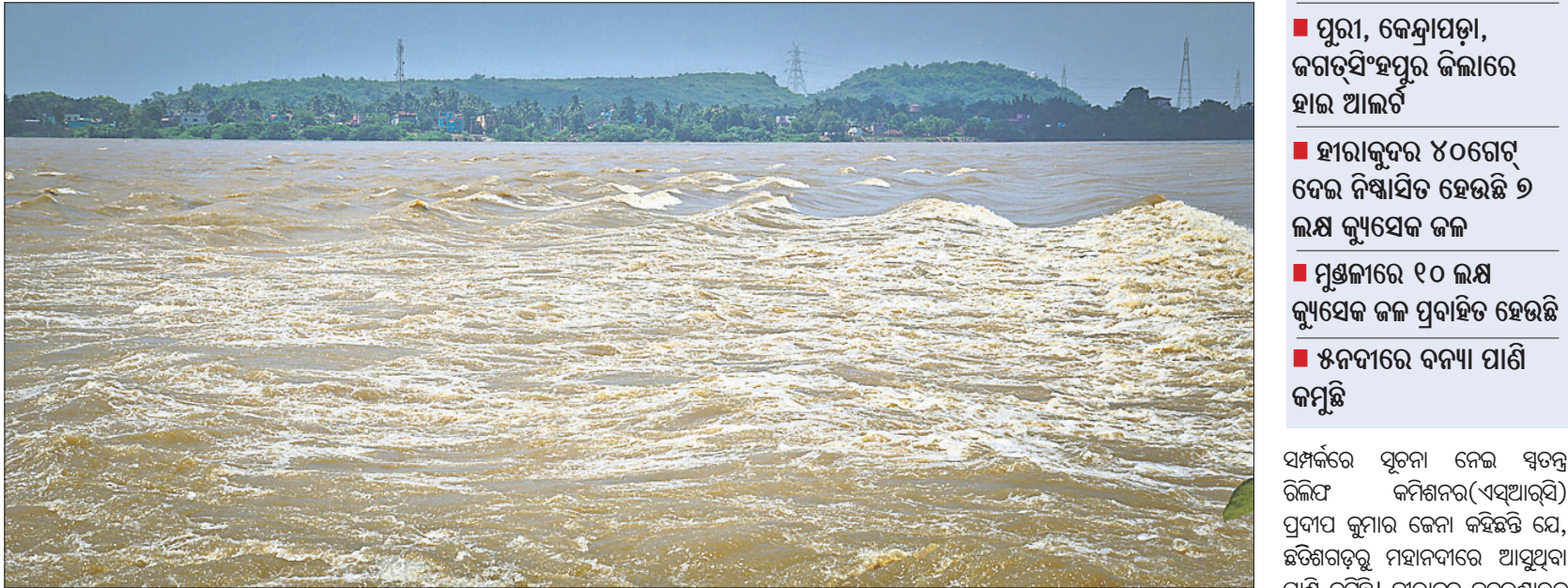
କଟକ ଜିଲ୍ଲା ମୁଖଳାଠାରେ ରବିବାର ମହାନଦୀରେ ପ୍ରବାହିତ ବନ୍ୟାଜଳ।

ଭୁବନେଶ୍ୱର, ୩୦/୮ (ବ୍ୟୁରୋ) ରାଜ୍ୟରେ ଦୁଇ ତିନି ଦିନ ହେବ ବର୍ଷା ନାହିଁ। ତେବେ ଗତ କାନ୍ଥାପତକିତ ବର୍ଷା ଉତ୍ତର ଓ ଉପକୂଳ ଓଡ଼ିଶା ପାଇଁ ଭୟଙ୍କର ବିପଦ ରହିଛି। ଏହି ଜିଲ୍ଲାଗୁଡ଼ିକୁ ହାଇ ଆଲଟ ଜାରି କରାଯାଇଛି। ଏହି ସମୟରେ ମହାନଦୀରେ ୧୦ଲକ୍ଷ କ୍ୟୁସେକ ଜଳ ପ୍ରବାହିତ ହେବା ଆପତ୍ତା ବୃଧ୍ୱର ଆପତ୍ତା ବୃଧ୍ୱର ଆପତ୍ତା ପୂର୍ଣ୍ଣମା ମହାନଦୀ ଓ ଏହାର ଶାଖା ନଦୀରୁ ଜଳ ନିଷ୍କାସନ ବିଳମ୍ବ ହେବା ସମ୍ଭାବନା ରହିଛି। ମହାନଦୀରେ ପ୍ରବାହିତ ୧୦ଲକ୍ଷ କ୍ୟୁସେକରୁ ଉର୍ଦ୍ଧ୍ୱ ଜଳ ବନ୍ୟା ବିପଦଙ୍କ ପାଇଁ ବିପ୍ଳବ ସୃଷ୍ଟି କରିବ ବୋଲି ଆଶଙ୍କା କରାଯାଉଛି। ଏନେଇ ଉପକୂଳବାସୀ ଆଡ଼ିକିତ ଅବସ୍ଥାରେ ରହିଛନ୍ତି। ବନ୍ୟା ପରିସ୍ଥିତି ମୁକାବିଲା କରିବାକୁ ରାଜ୍ୟ ଓ ଜିଲ୍ଲା ପ୍ରଶାସନ ସମ୍ମାନ ରହିଛନ୍ତି। ବନ୍ୟା ବନ୍ୟା ବିପଦରେ ଉପରେ ଜଳ ସମ୍ପଦ ବିଭାଗ ବରିଷ୍ଠ ଯନ୍ତ୍ରାମାନେ ଡାଇନମାଇଟ୍ ହାସଲ କରିଛନ୍ତି। ୨୪ ଘଣ୍ଟା ପାଣ୍ଡାଲି କରାଯାଉଛି। ଅତି ସମ୍ବେଦନଶୀଳ ସ୍ଥାନରେ ଏନ୍ଡିଆରଏଫ୍, ଓଡ଼ିଆ ଓ ଅଗ୍ନିଶମ ବାହିନୀକୁ ମୁତୟନ କରାଯାଇଛି। ରାଜ୍ୟର ବନ୍ୟା ପରିସ୍ଥିତି