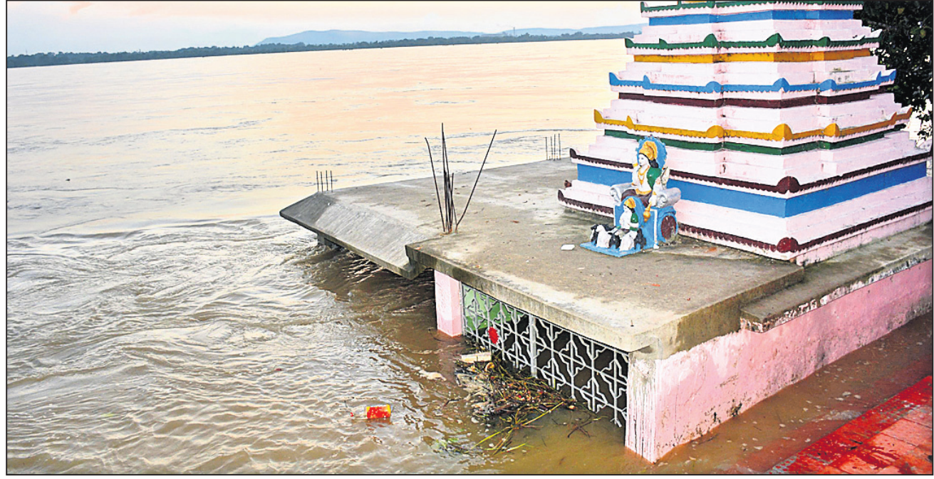
ସମ୍ବଲପୁର ମାରଖଡ଼ି ପଡ଼ାଘାଟସ୍ଥିତ ସୂର୍ଯ୍ୟ ମନ୍ଦିର ବନ୍ୟାଜଳରେ ବୁଡ଼ିଛି ।