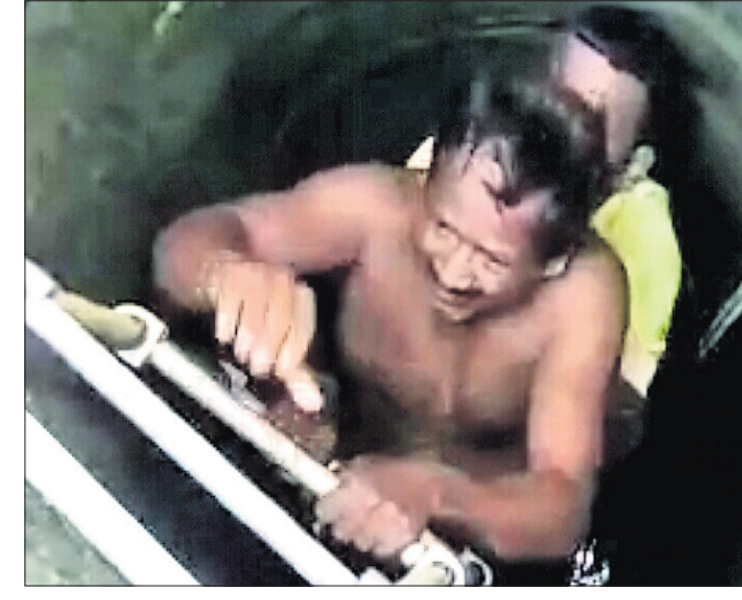
କୁଅରୁ ତିରୁପତିକୁ ଉଦ୍ଧାର କରାଯାଇଛି।

ଅଧାଦିନ ତାକୁ ବୁଝା ମା' କୁଅରେ ପଡ଼ି ଯାଇଥିଲେ। ତାଙ୍କୁ ଉଦ୍ଧାର କରିବା ପାଇଁ ପୁଅ ତୁରନ୍ତ କୁଅକୁ ଡେଇଁ ପଡ଼ିଥିଲେ।