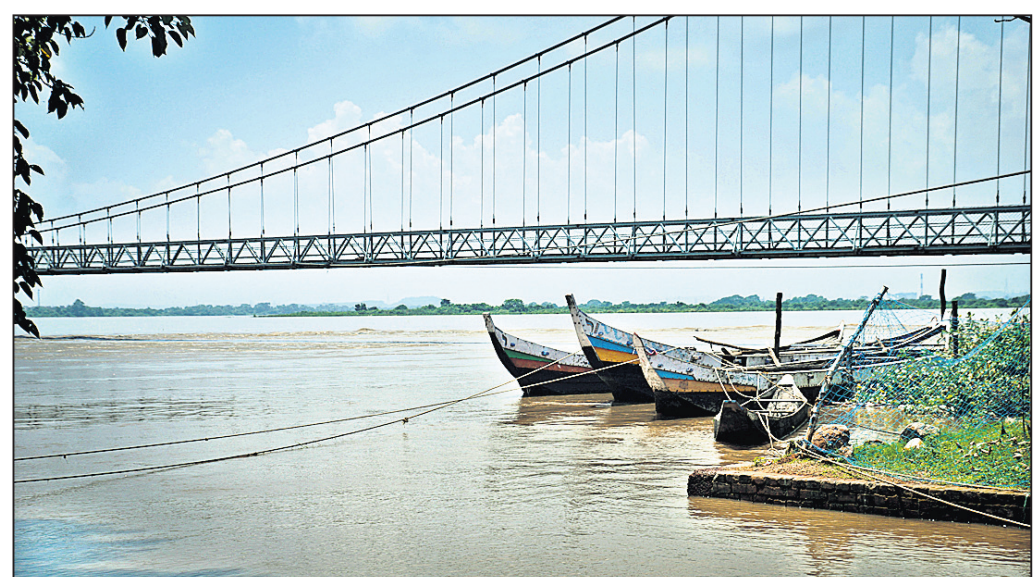
କଟକ ଜିଲାର ପ୍ରସିଦ୍ଧ ଧବଳେଶ୍ଵର ପୀଠସ୍ଥିତ ମହାନଦୀରେ ପ୍ରବାହିତ ବନ୍ୟାଜଳ ।