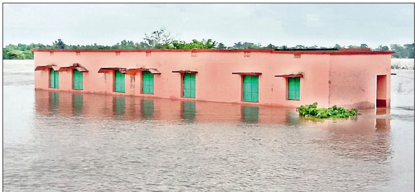
ଖୋର୍ଦ୍ଧା ଜିଲା ଜଟଣୀ ବ୍ଲକର ପଞ୍ଚିଆଦିଲି ସ୍କୁଲ ପାଣି ଘେରରେ ।