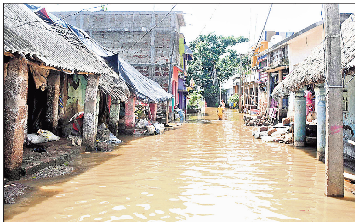
ପୁରୀ ଜିଲା କଣାସ ବ୍ଲକର ଦୋକନ୍ଦା ଗ୍ରାମରେ ବନ୍ୟାଜଳ ।