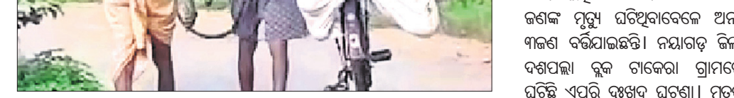
ଅଖା ବସ୍ତାରେ ମୃତଦେହ ଭରି କରି ସାଇକେଲରେ ନିଆଯାଇଛି।

କରି ସାଇକେଲ କ୍ୟାରିୟରରେ ବାନ୍ଧି ପୁଅ ଖବର ପାଇବା ପାଇଁ ନେଇଥିବା ଭିଡ଼ିଓ ସୋସିଆଲ ମିଡ଼ିଆରେ ଭାଇରାଲ ହୋଇଛି।