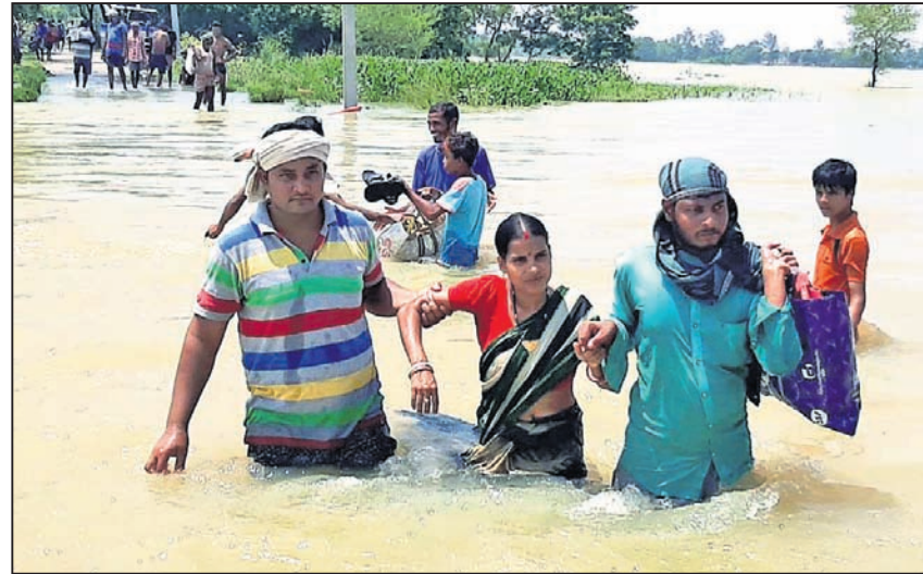
ଭଦ୍ରକ ଜିଲା ଚିହିଡ଼ି-କାଁପଡ଼ା ରାସ୍ତାରେ ଲୋକେ ପାଣିରେ ପଶି ଯାଉଛନ୍ତି ।