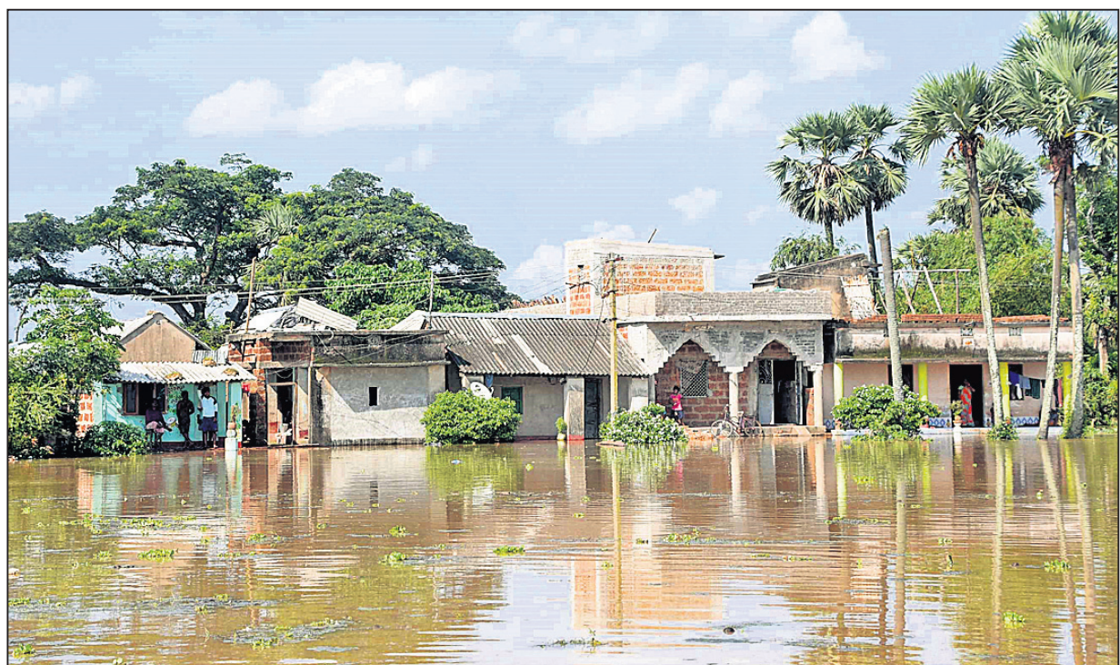
ପାଣି ଘେରରେ ଥିବା ପୁରୀ ଜିଲା କଣାସ ବ୍ଲକର ବାଲିପାଟଣା ଗ୍ରାମ ।