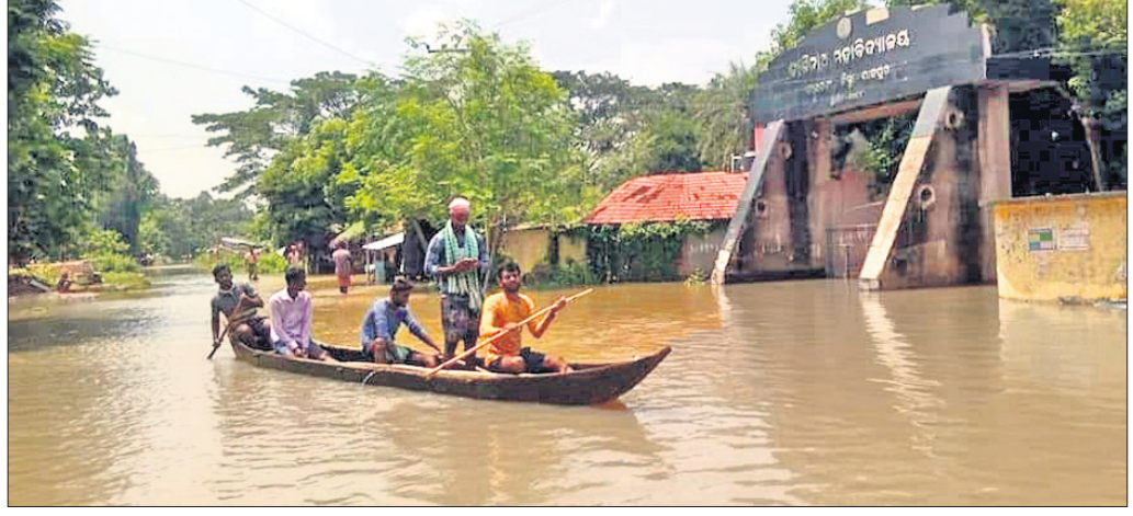
ବରା ବୁକ କାଳପତାସ୍ଥିତ କାଶୀନାଥ ମହାବିଦ୍ୟାଳୟ ସମ୍ମୁଖରେ ଲୋକମାନେ ବଜାରରେ ଯାତାଯାତ କରୁଛନ୍ତି।

ଝଟପୁର, ୩୦ (ଡି.ଏନ.ଏ.) ଖବରପାଇଁ ଝଟପୁର ଅଗ୍ନିଶମ ବାହିନୀ କର୍ମଚାରୀମାନେ ଘଟଣାସ୍ଥଳରେ ପହଞ୍ଚି ଗ୍ରାମବାସୀଙ୍କ ସହାୟତାରେ ସୁରକ୍ଷିତ ଭାବେ ମା', ପୁଅକୁ ଉଦ୍ଧାର କରିଥିଲେ।