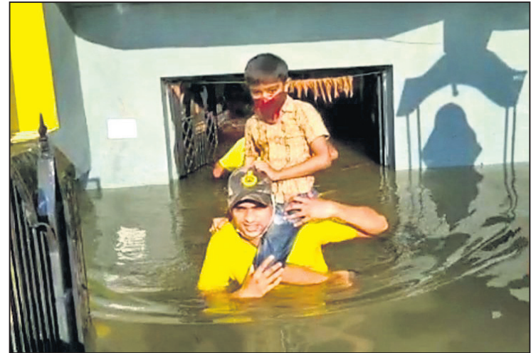
ରବିବାର ସମ୍ବଲପୁର ଭଡ଼ରା ନିକଟସ୍ଥ ଭୂରିପଡ଼ା ବନ୍ୟା ଘେରରେ ରହିଥିବା ବେଳେ ଜଣେ ଶିଶୁକୁ ସୁରକ୍ଷିତ ସ୍ଥାନକୁ ନିଆଯାଇଛି ।