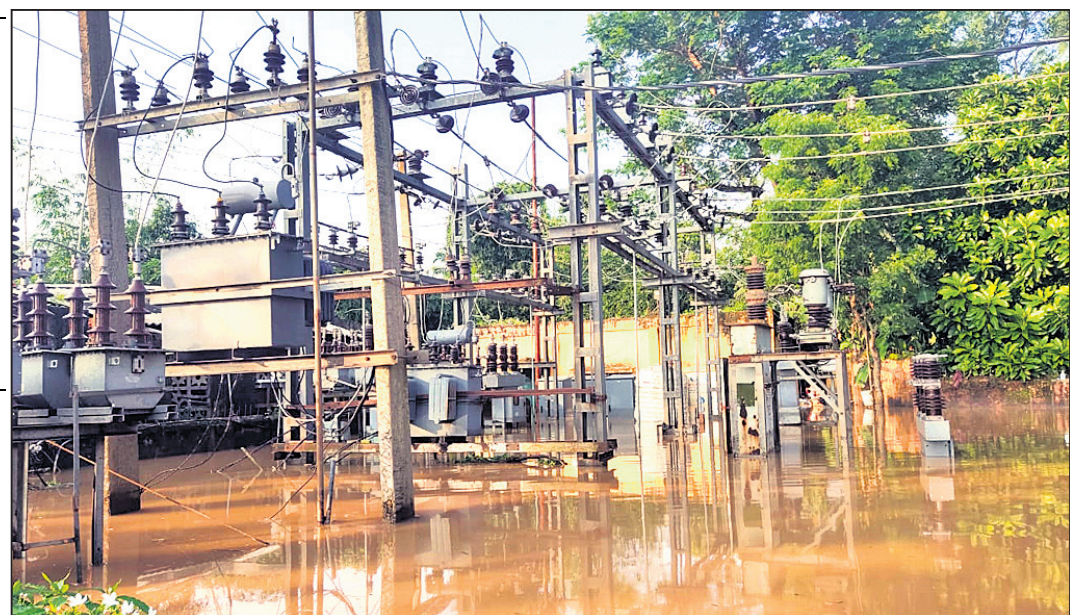
ବନ୍ୟା ଜଳରେ ବୁଡ଼ି ରହିଛି ଯାକପୁର ଜିଲା ବରା ବିଦ୍ୟୁତ୍ ଉପଖଣ୍ଡ ସ୍ତୂପ ।