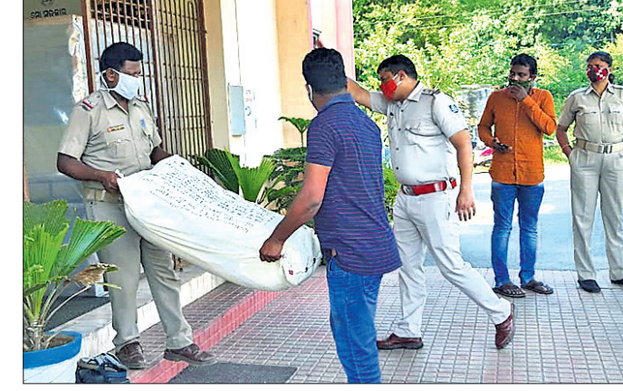
କଟକ ଗଞ୍ଜେଇକୁ ପୋଲିସ୍ ଥାନାକୁ ନେଇଛି।

ସାଧାରଣ ବୋଲେରୋ ନ ଥିଲା। ଖୋର୍ଦ୍ଧା ଜିଆର୍ପିର ଜଣେ ଅଧିକାରୀ ବ୍ୟବହାର କରୁଥିବା ଗାଡ଼ି ଥିଲା।