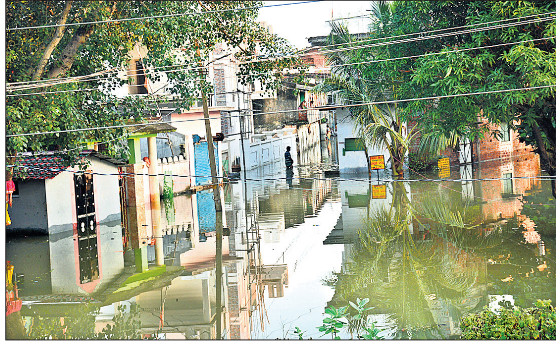
ରବିବାର ସମ୍ବଲପୁର ଗୋବିନ୍ଦଗୋଲା ଡ୍ରାଇଭର କଲୋନୀ ବନ୍ୟାଜଳ ଘେରରେ ।