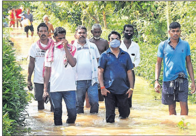
ପୁରୀ ସତ୍ୟବାଦୀ ବିଧାନକ ଭମାକାତ ସାମନ୍ତରାୟ ବନ୍ୟା ପ୍ରଭାବିତ ଅଞ୍ଚଳ ପରିଦର୍ଶନ କରୁଛନ୍ତି ।