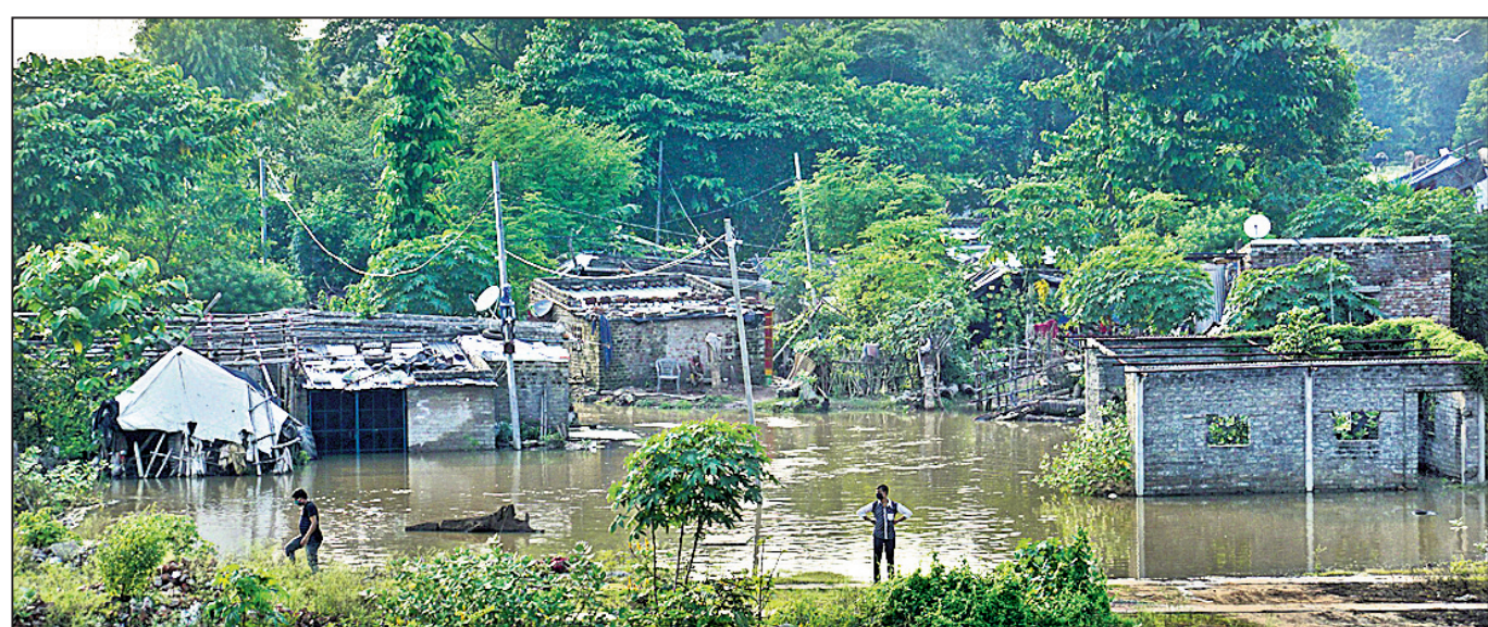
କଟକ ସହରସ୍ଥିତ ଚାନ୍ଦିନୀଚୌକ ଗୁଣ୍ଡିଚାମନ୍ଦିର ପାର୍ଶ୍ଵସ୍ଥ ବସ୍ତ୍ରରେ ବନ୍ୟାଜଳ ପଶିଛି ।