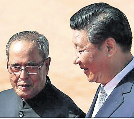
ଚାଇନା ରାଷ୍ଟ୍ରପତି ସି ଜିଫିଞ୍ଗଙ୍କ ସହ ଆଲୋଚନାରେ।