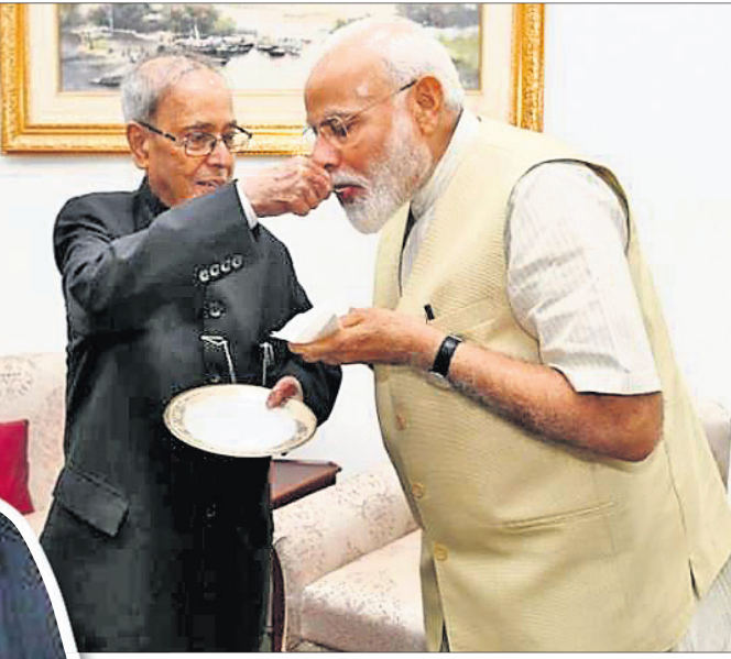
ପ୍ରଧାନମନ୍ତ୍ରୀ ନରେନ୍ଦ୍ର ମୋଦିଙ୍କ ସହ ଅଭରଙ୍ଗ ମୁହୂର୍ତ୍ତରେ