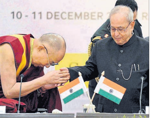
ତିବତୀୟ ଧର୍ମଗୁରୁ ଦଲାଇ ଲାମାଙ୍କ ସହ କରମର୍ଦ୍ଦନ କରୁଛନ୍ତି ପ୍ରଣବ।