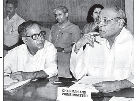
ପୂର୍ବତନ ପ୍ରଧାନମନ୍ତ୍ରୀ ପି.ଏ. ନରସିଂହରାଓଙ୍କ ସହ