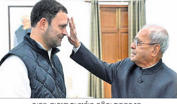
ରାହୁଲ ଗାନ୍ଧୀଙ୍କୁ ଆଶୀର୍ବାଦ କରିବା ଅବସରରେ