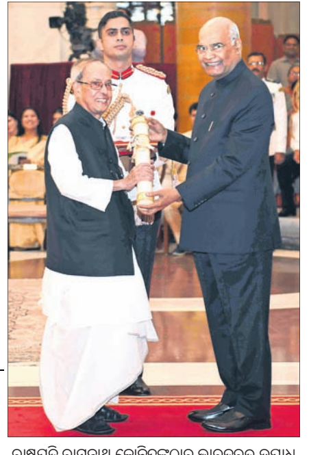
ରାଷ୍ଟ୍ରପତି ରାମନାଥ କୋବିନ୍ଦଙ୍କଠାରୁ ଭାରତର ଉପାଧି ଗ୍ରହଣ କରିବା ଅବସରରେ

ମିଦ୍ନାପୁର ଉପନିର୍ବାଚନରେ ସ୍ୱାଧୀନ ପ୍ରାର୍ଥୀ ଭି.କେ. କ୍ରିଷ୍ଣା ମେନନ୍‌ଙ୍କ ଲାଗି ୧୯୬୯ରେ ପ୍ରଚାର ଆରମ୍ଭ କରି ସଫଳ ହୋଇଥିଲେ। ପରେ ସେ ନିଜ ଦକ୍ଷତା ଓ ପ୍ରତିଭା ବଳରେ ତତ୍କାଳୀନ ପ୍ରଧାନମନ୍ତ୍ରୀ ଇନ୍ଦିରା ଗାନ୍ଧୀଙ୍କ ଦୃଷ୍ଟି ଆକର୍ଷଣ କରିପାରିଥିଲେ। ଭାରତୀୟ ଜାତୀୟ କଂଗ୍ରେସରେ ସେ ଯୋଗଦେବା ପରେ ମୁଖାର୍ଜୀଙ୍କୁ ସେଇବର୍ଷ ରାଜ୍ୟ ସଭାକୁ ପଠାଯାଇଥିଲା। ୧୯୭୫, ୧୯୮୧, ୧୯୯୩, ୧୯୯୯ରେ ସେ ରାଜ୍ୟ ସଭାକୁ ପୁନଃ ନିର୍ବାଚିତ ହୋଇଥିଲେ। ୧୯୭୩ରେ ତାଙ୍କୁ ଇନ୍ଦିରା ଗାନ୍ଧୀଙ୍କ ମନ୍ତ୍ରଣାଳୟରେ ସ୍ଥାନ ମିଳିଥିଲା। ୧୯୭୭ ସାଧାରଣ ନିର୍ବାଚନରେ କଂଗ୍ରେସକୁ ପରାଜୟର ରାସ୍ତା ଦେଖିବାକୁ ପଡ଼ିଥିଲେ ହେଁ ପରବର୍ତ୍ତୀ ମୁହୂର୍ତ୍ତ (୧୯୮୨)ରେ ସେ ଦେଶର ଅର୍ଥମନ୍ତ୍ରୀ ହେବାର ସୌଭାଗ୍ୟ ଅର୍ଜନ କରିଥିଲେ। ମନମୋହନ ସିଂଙ୍କୁ ଆର୍ବିଆଇ ଗଭର୍ନର କରିବା ପଛରେ ତାଙ୍କର ପ୍ରଚ୍ଛନ୍ନ ହାତ ଥିଲା। ପଶ୍ଚିମବଙ୍ଗ ପ୍ରଦେଶ କଂଗ୍ରେସ ସଭାପତି, ଭାରତୀୟ ଯୋଜନା କମିଶନର ଉପାଧ୍ୟକ୍ଷ, ଏଆଇସିସି ସାଧାରଣ ସମ୍ପାଦକ, ଦେଶର ବହିର୍ବ୍ୟାପାର ମନ୍ତ୍ରୀ, ଶିଳ୍ପ ଓ ବାଣିଜ୍ୟ ମନ୍ତ୍ରୀ, ପ୍ରତିରକ୍ଷା ମନ୍ତ୍ରୀ ହେବାରେ ସେ ସଫଳ ହୋଇଥିଲେ। ୨୦୦୪ରେ ସେ ଦେଶର ପ୍ରଧାନମନ୍ତ୍ରୀ ହେବେ ବୋଲି ଅନୁମାନ କରାଯାଇଥିବାବେଳେ ମନମୋହନଙ୍କ ପ୍ରତି ବକାୟ ନେତୃତ୍ୱରୁ ସମର୍ଥନ ମିଳିଥିଲା। ୧୯୯୩ରେ ରାଜନୀତିରୁ ଦୂରରେଇବା ଲାଗି ମନ ବଳାଇଥିବା ପ୍ରଣବ ୨୦୧୨ରେ ଦେଶର ରାଷ୍ଟ୍ରପତି ହେବାର ସୌଭାଗ୍ୟ ଅର୍ଜନ କରିଥିଲେ।