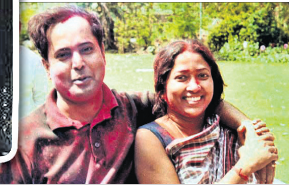
ସ୍ତ୍ରୀ ଶୁଭ୍ରାଙ୍କ ସହ ବିଶେଷ ମୁହୂର୍ତ୍ତରେ