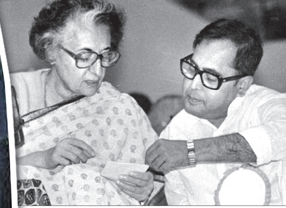
ଆଲୋଚନା ବେଳେ ପୂର୍ବତନ ପ୍ରଧାନମନ୍ତ୍ରୀ ଇନ୍ଦିରା ଗାନ୍ଧୀଙ୍କ ସହ ପ୍ରଣବ ମୁଖାର୍ଜୀ