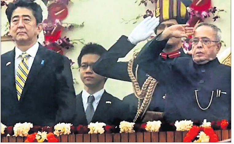
ଜାପାନର ପୂର୍ବତନ ପ୍ରଧାନମନ୍ତ୍ରୀ ସିଞ୍ଜୋ ଆବେଙ୍କ ସହ।