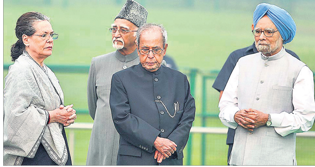
ପୂର୍ବତନ ପ୍ରଧାନମନ୍ତ୍ରୀ ମନମୋହନ ସିଂହ, ପୂର୍ବତନ ଉପରାଷ୍ଟ୍ରପତି ହମିଦ୍ ଅନ୍ସାରୀ ଓ କଂଗ୍ରେସ ନେତ୍ରୀ ସୋନିଆ ଗାନ୍ଧୀଙ୍କ ସହ