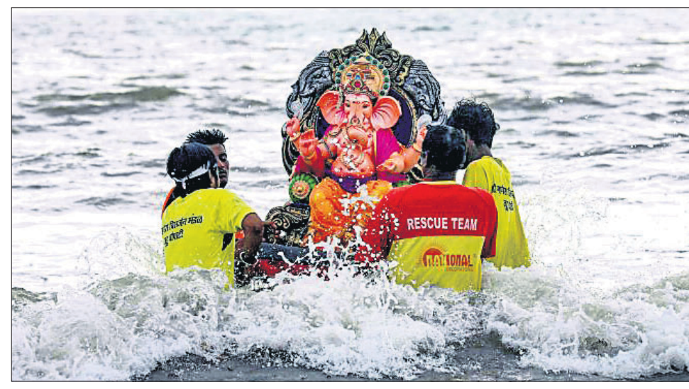
ମୁମ୍ବାଇର କୁହୁ ବିଦେର ଗଣେଶ ମୂର୍ତ୍ତି ବିସର୍ଜନ କରୁଛନ୍ତି ଭୋଲ୍‌ସ୍‌କିୟର।

ନୂଆଦିଲ୍ଲୀ, ୧୯: ଦେଶର ଅଭିଭୂତି ହାର ପ୍ରତିଶତ ପ୍ରତିଶତ ପହଞ୍ଚିବାବେଳେ ଏହାକୁ ନେଇ କଂଗ୍ରେସ ପକ୍ଷରୁ କେନ୍ଦ୍ର ସରକାରଙ୍କୁ ଡାକ୍ତରୀ ସମାଲୋଚନା କରାଯାଇଛି।