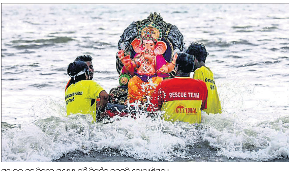
ମୁମ୍ବାଇର କୁହୁ ବିବେର ଗଣେଶ ମୂର୍ତ୍ତି ବିସର୍ଜନ କରୁଛନ୍ତି ଭୋଲ୍‌ସ୍ତ୍ରୀୟର।