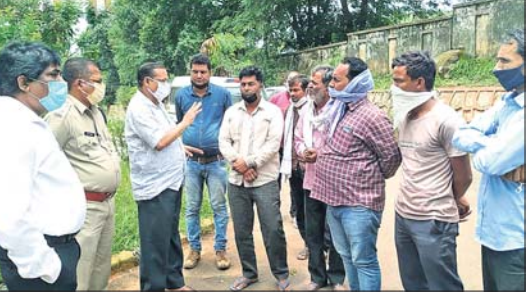
ରାଜସ୍ଥାନରୁ ଆସିଥିବା ପରିବାର ଲୋକଙ୍କ ସହ ଅଧିକାରୀମାନେ ଆଲୋଚନା କରୁଛନ୍ତି।