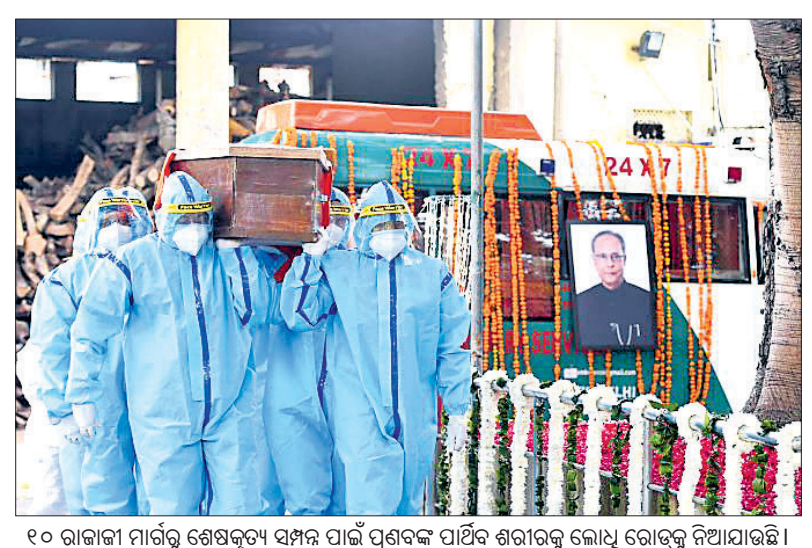
୧୦ ରାଜାଜା ମାର୍ଗରେ ପୂର୍ବତନ ରାଷ୍ଟ୍ରପତି ପ୍ରଣବ ମୁଖାର୍ଜୀଙ୍କୁ ରାଷ୍ଟ୍ରପତି ରାମନାଥ କୋବିନ୍ଦ ଶ୍ରଦ୍ଧାଞ୍ଜଳି ଦେଉଛନ୍ତି। ସ୍ମରଣ ପ୍ରଣବ ମୁଖାର୍ଜୀଙ୍କୁ ପ୍ରଧାନମନ୍ତ୍ରୀ ନରେନ୍ଦ୍ର ମୋଦି ଶେଷଦର୍ଶନ କରି ଶ୍ରଦ୍ଧାଞ୍ଜଳି ଅର୍ପଣ କରୁଛନ୍ତି। ୧୦ ରାଜାଜା ମାର୍ଗରୁ ଶେଷକୃତ୍ୟ ସମ୍ପନ୍ନ ପାଇଁ ପ୍ରଣବଙ୍କ ପାଠିକ ଶରୀରକୁ ଲୋଧୁ ରୋଡ୍‌କୁ ନିଆଯାଇଛି।