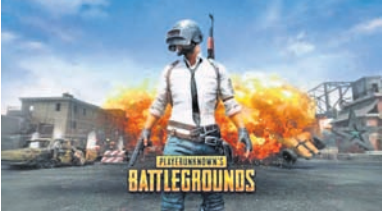
ଆପ୍ ବ୍ୟାନ କରିଦେଇଛନ୍ତି। ଏହା ମଧ୍ୟରେ ଲୋକପ୍ରିୟ ଗେମ୍ ଆପ୍‌କେଶନ ପବ୍‌ଜି (ପୂର୍ଣ୍ଣ ଉପାଦାନ ଅନୁମୋଦିତ ବ୍ୟାରେଲ ଗ୍ରାଉଣ୍ଡସ୍) ଏବଂ ଅନ୍ୟାନ୍ୟ ଆପ୍ ସାମିଲ ରହିଥିବା ଜଣାପଡ଼ିଛି। ଦେଶର ସାର୍ବଭୌମିକ୍ ଏବଂ ପ୍ରତିରକ୍ଷାକୁ ନଜରରେ ରଖି

ଭାରତ ଏବଂ ଚାଇନା ସୀମାରେ ଉଚ୍ଚେଦନା ଲାଗି ରହିଛି। ପୂର୍ବ ଲଦାଖର ଗଲ୍‌ଫ୍‌ସ୍‌ପିନ୍ ଉପତ୍ୟକାରେ ଚାଇନା ସେନା ଆକ୍ରମଣରେ ୨୦ ଭାରତୀୟ ଯବାନ ଶହୀଦ ହେବା ପରେ କେନ୍ଦ୍ର ସରକାର କଡ଼ା ଆଭିଯୁକ୍ତ ଗ୍ରହଣ କରିଛନ୍ତି। ପ୍ରାଥମିକ ପର୍ଯ୍ୟାୟରେ ଶତାଧିକ ଚାଇନା ଆପ୍ ଉପରେ କଟକଣା ଜାରି କରିବା ପରେ ସରକାର ରୁଧିରୀର ପୁଣି ମୋଟ ୧୧୮ ମୋବାଇଲ୍ ଆପ୍ ବ୍ୟାନ କରିଦେଇଛନ୍ତି। ଏହା ମଧ୍ୟରେ ଲୋକପ୍ରିୟ ଗେମ୍ ଆପ୍‌କେଶନ ପବ୍‌ଜି (ପୂର୍ଣ୍ଣ ଉପାଦାନ ଅନୁମୋଦିତ ବ୍ୟାରେଲ ଗ୍ରାଉଣ୍ଡସ୍) ଏବଂ ଅନ୍ୟାନ୍ୟ ଆପ୍ ସାମିଲ ରହିଥିବା ଜଣାପଡ଼ିଛି। ଦେଶର ସାର୍ବଭୌମିକ୍ ଏବଂ ପ୍ରତିରକ୍ଷାକୁ ନଜରରେ ରଖି