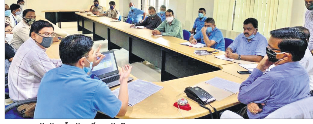
ବାୟୁସେନାରେ ନିଯୁକ୍ତି ପାଇଁ ରାଲି ସମ୍ପର୍କିତ ପ୍ରସ୍ତୁତି ବୈଠକ।

ଅନୁଗୋଳ ଅଫିସ୍, ୨୧୯: ଅନୁଗୋଳରେ ଭାରତୀୟ ବାୟୁସେନାର ନିଯୁକ୍ତି ରାଲି ଅନୁଷ୍ଠିତ ହେବ। ରାଜ୍ୟର ୩୦ଟି ଜିଲ୍ଲାକୁ ଆଶାଯାଇ ନେଇ ଆସନ୍ତା ୨୩ ତାରିଖରୁ ଅନୁଗୋଳର ୧୯ ପର୍ଯ୍ୟନ୍ତ ପୋଲିସ ଟ୍ରେନିଂ କଲେଜ(ପିଟିସି) ପଡିଆରେ ଏହି ରାଲି କରାଯିବ।