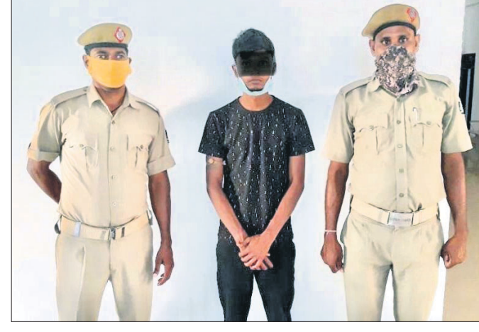
ଅତିରକ୍ତକ୍ତ ପୋଲିସ ହାଜର କରାଯାଇଛି।

ଅନୁଗୋଳ ଜିଲା କିଆକଟା ଥାନା ଓରତା କୋରାଣି ନାଳ ନିକଟରୁ ଗତ ସୋମବାର ଜଣେ ଯୁକ୍ତ ୨ ଛାତ୍ରୀଙ୍କ ମୃତଦେହ ଉଦ୍ଧାର ଘଟଣାର ପର୍ଯ୍ୟଟାଣ କରିଛି ପୋଲିସ।