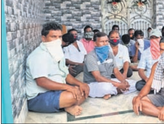
ବୈଠକରେ ଉପସ୍ଥିତ ପରିବା ବ୍ୟବସାୟୀମାନେ।

ପୂର୍ବରୁ ୧୧ଟାରେ ଦୋକାନ ବନ୍ଦ କରି ଫେରି ଯାଇଥିଲେ। ସମସ୍ୟାର ଘାୟା ପ୍ରତିକାର ନ କଲେ ଅନିଚ୍ଛିତକାଳ ପାଇଁ ବେପାର ବନ୍ଦ କରିବାକୁ ବୋଲି ଏକ ପତ୍ରିକାରେ ବ୍ୟବସାୟୀମାନେ ନିଷ୍ପତ୍ତି ନେଇଛନ୍ତି।