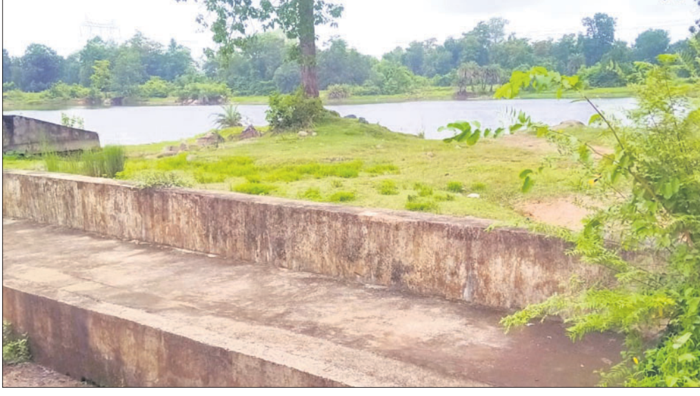
ଧଉଳଗୋପ ବାରବାଙ୍କିଆ ନାଳ

ଅନୁଗୋଳ ଜିଲା ଆଠମଲିକ ଉପଖଣ୍ଡର ଧଉଳଗୋପ ବାରବାଙ୍କିଆ ନାଳଠାରେ ହେବାକୁଥିବା ମଧ୍ୟମ ଜଳସେଚନ ପ୍ରକଳ୍ପର ଛୁଟି ଏଯାଏଁ ସମ୍ପୂର୍ଣ୍ଣ ହୋଇପାରି ନାହିଁ। ଏହି ପ୍ରକଳ୍ପକୁ ଆଠମଲିକ ଓ କିଶୋରନଗର ବ୍ଲକର ୨୧ ଖଣ୍ଡ ଗ୍ରାମବାସୀ ସମର୍ଥନ କରୁଥିବା ବେଳେ ୮ ଗାଁ ଲୋକେ ବିରୋଧ କରୁଛନ୍ତି।