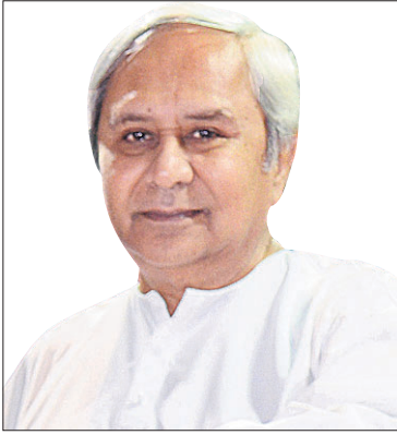
ପୁଖ୍ୟମନ୍ତ୍ରୀ ନବୀନ ପଟ୍ଟନାୟକ

ରାଜ୍ୟରେ ସମସ୍ତ ବିଶ୍ୱବିଦ୍ୟାଳୟ ପାଇଁ ଗୋଟିଏ ଆଇନ ହେବ। ପୂର୍ବରୁ ପ୍ରଚଳିତ ଓଡ଼ିଶା ବିଶ୍ୱବିଦ୍ୟାଳୟ ଆଇନ-୧୯୮୯କୁ ସଂଶୋଧନ କରାଯିବ। ଉଚ୍ଚଶିକ୍ଷା ବିଭାଗ ପକ୍ଷରୁ ଦିଆଯାଇଥିବା ଏହି ପ୍ରସ୍ତାବକୁ ରାଜ୍ୟ କ୍ୟାବିନେଟ୍ ଅନୁମୋଦନ କରିଛି। ରୁଧିର ଲୋକସେବା ଭବନରେ ପୁଖ୍ୟମନ୍ତ୍ରୀ ନବୀନ ପଟ୍ଟନାୟକଙ୍କ ଅଧ୍ୟକ୍ଷତାରେ କୁଳପତିଙ୍କ କାର୍ଯ୍ୟକାଳ ଅବଧିକୁ ୪ ବର୍ଷ କିମ୍ବା ସର୍ବୋଚ୍ଚ ବୟସ ସୀମା ୬୫ ବର୍ଷକୁ ବୃଦ୍ଧି କରାଯାଇଛି। ବିଶ୍ୱବିଦ୍ୟାଳୟର ପଞ୍ଜୀକୃତ ଶିକ୍ଷକ ଓ ସ୍ନାତକ ଦ୍ୟବସ୍ଥାକୁ ବନ୍ଦ କରିବାକୁ ନିଷ୍ପତ୍ତି ହୋଇଛି। ଏଣିକି ବିଶ୍ୱବିଦ୍ୟାଳୟର ଶିକ୍ଷକ ଓ ଅଣଶିକ୍ଷକମାନଙ୍କର ନିଯୁକ୍ତି ଓଡ଼ିଶା ସିନେଟ୍‌କୁ ସମ୍ପୂର୍ଣ୍ଣ ଉଚ୍ଚେଦ କରାଯିବ। ସିନେଟ୍‌ର କର୍ତ୍ତୃପକ୍ଷର ପୁନର୍ଗଠନ କରାଯିବ। ଏହାଦ୍ୱାରା ରାଜ୍ୟର ସମସ୍ତ ବିଶ୍ୱବିଦ୍ୟାଳୟର ଶିକ୍ଷାଗତ ଓ ପ୍ରଶାସନିକ କାର୍ଯ୍ୟକାରିତା ସୁଗଠନପ୍ରାପ୍ତ ହେବ। କୁଳପତି ଚୟନ କମିଟିର ପୁନର୍ଗଠନ କରାଯିବ। ଉଚ୍ଚ କମିଟିରେ ସିନେଟ୍‌ର ଏକ ଚୟନ ସଭା ପରିଚାଳନା ରାଜ୍ୟ ସରକାରଙ୍କର ଏକ ପ୍ରତିନିଧିତ୍ୱ ସାଧିବ।