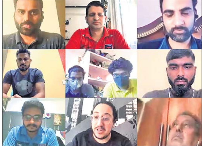
ଉଚ୍ଚିତ କର୍ମଚାରୀଙ୍କୁ ପ୍ରୋତ୍ସାହନ ଦେବାକୁ ହେବ। ଉଚ୍ଚିତ କର୍ମଚାରୀଙ୍କୁ ପ୍ରୋତ୍ସାହନ ଦେବାକୁ ହେବ। ଉଚ୍ଚିତ କର୍ମଚାରୀଙ୍କୁ ପ୍ରୋତ୍ସାହନ ଦେବାକୁ ହେବ।