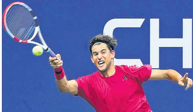
ଶର୍ ଖେଳିବା ଅବସରରେ ଧୂମ୍ ଧୂମ୍ ଖେଳିବା ଅବସରରେ ଧୂମ୍ ଧୂମ୍ ଖେଳିବା ଅବସରରେ ଧୂମ୍

ଧୂମ୍ ଓ ପସ୍ପିସିଲଙ୍କ ଲକ୍ଷ୍ୟରେ ବିଜୟ ହେବା ପାଇଁ ଅଗ୍ରଗତି ହେବା ଆବଶ୍ୟକ। ଧୂମ୍ ଓ ପସ୍ପିସିଲଙ୍କ ଲକ୍ଷ୍ୟରେ ବିଜୟ ହେବା ଆବଶ୍ୟକ। ଧୂମ୍ ଓ ପସ୍ପିସିଲଙ୍କ ଲକ୍ଷ୍ୟରେ ବିଜୟ ହେବା ଆବଶ୍ୟକ।