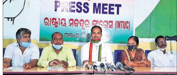
ଖବରଦାତା ସମିକନୀରେ ମହାଧାନ କଂଗ୍ରେସ କାର୍ଯ୍ୟକର୍ତ୍ତା ।

ଗଞ୍ଜାମରୁ ଶ୍ରମିକଙ୍କୁ ନେଇ ସୁରତ ଯାଉଥିବା ବସ୍ ଛତିଶଗଡ଼ର ରାୟପୁର ନିକଟରେ ଶନିବାର ଦୁର୍ଘଟଣାଗ୍ରସ୍ତ ହେବାକୁ ୮ ଜଣଙ୍କ ମୃତ୍ୟୁ ଘଟିଥିଲା ।