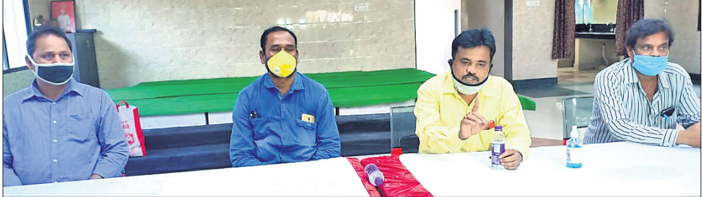
ଖବରଦାତା ସମିକନୀରେ ଟ୍ରାକ୍ଟର ମାଲିକ ସଂଘ ସଦସ୍ୟମାନେ ।

କୋରାପୁଟ ଜିଲ୍ଲା ଜୟପୁର ଟ୍ରାକ୍ଟର ମାଲିକ ସଂଘ ରୁଧିବାରରୁ ଉପକିଳାପାଳକ କାର୍ଯ୍ୟକାରୀ ଆଗରେ ଧାରଣା ଦେବ ।