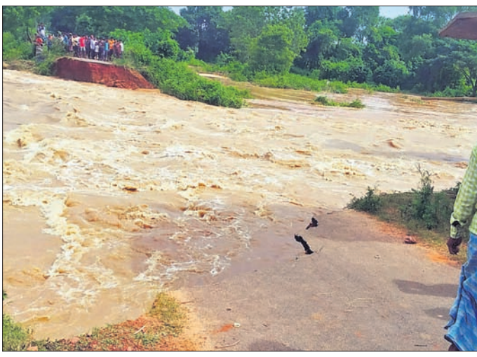
ବନ୍ୟା ରୁକ୍ମ ଅଧୀନ ଅଥୁଳ ନିକଟରେ ହୋଇଥିବା ଘାଇ ।

ଯାଜପୁର ଜିଲ୍ଲା ବ୍ରାହ୍ମଣୀ ଓ ଦୈତରଣୀ ନଦୀରେ ହୋଇଥିବା ବନ୍ୟାରେ ଜାରକା ଜଳସେଚନ ଡିଭିଜନ ଅଧୀନରେ ଥିବା ନଦୀବନ୍ଧରେ ୨୧ ଏକଠି ଯାଜପୁର ଜଳସେଚନ ଡିଭିଜନରେ ୪ଟି ଘାଇ ପୃଷ୍ଠି ହୋଇଛି । ଏସବୁର ପୁନରୁଦ୍ଧାର ପାଇଁ ୧୨ କୋଟି ୩୯ ଲକ୍ଷ ଟଙ୍କାର ବ୍ୟୟଅଟକଳ ପ୍ରସ୍ତୁତ ହୋଇଥିବା ଜଳସମ୍ପଦ ବିଭାଗ ପକ୍ଷରୁ ସୂଚନା ମିଳିଛି ।