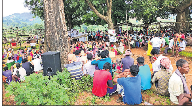
ପ୍ରକାଶନେତ୍ରରେ ସାମିଲ ହୋଇଥିବା ଆଦିବାସୀମାନେ ।

ମାଓବାଦୀଙ୍କ କାର୍ଯ୍ୟ କଳାପରେ ଅତିଷ୍ଠ ହୋଇ ରବିବାର ମାଲକାନଗିରି ଜିଲ୍ଲା ଚିତ୍ରକୋଣ୍ଡା ବ୍ଲକ୍ ଦାରାଇବେଡ଼ାରେ ଅଞ୍ଚଳବାସୀ ଆଦିବାସୀ ମେଳି ରାଜି କରିଛନ୍ତି ।