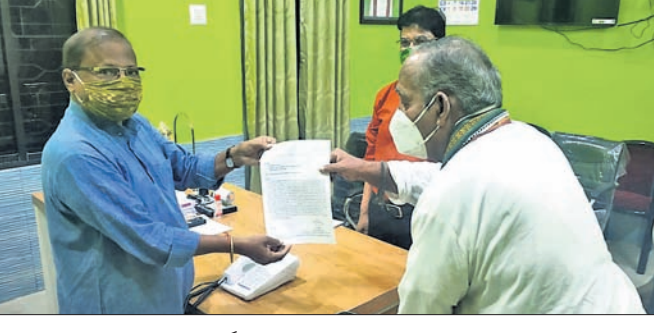
ମନ୍ତ୍ରୀଙ୍କୁ ପୂର୍ବତନ ବିଧାୟକ ଦାବିପତ୍ର ଦେଖାଇଛି ।