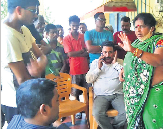
ସାହୁପଡ଼ା ଗ୍ରାମବାସୀ ତଦନ୍ତକାରୀ ଅଧିକାରୀଙ୍କୁ ବିରୋଧ କରୁଛନ୍ତି ।

ବନ୍ୟା ରୁକ୍ମରେ ବନ୍ୟା ଦ୍ଵାରା ପ୍ରଭାବିତ ଲୋକଙ୍କୁ ଚିହ୍ନଟ କରି ପଲିଥିନ ଯୋଗାଇ ଦେବାକୁ ପ୍ରଶାସନ ନେଇଥିବା ନିଷ୍ପତ୍ତିକୁ ଗ୍ରାମବାସୀ ବିରୋଧ କରି ତଦନ୍ତରେ ସହଯୋଗ କରିନାହାନ୍ତି ।