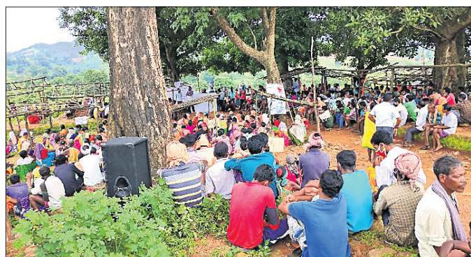
ପ୍ରକାଶନେତ୍ରରେ ସାମିଲ ହୋଇଥିବା ଆଦିବାସୀମାନେ ।

ମାଓବାଦୀଙ୍କ କାର୍ଯ୍ୟ କଳାପରେ ଅତିଷ୍ଠ ହୋଇ ରବିବାର ମାଲକାନଗିରି ଜିଲ୍ଲା ଚିତ୍ରକୋଣ୍ଡା ବ୍ଲକ୍ ଦାଋଲବେଡ଼ାରେ ଅଞ୍ଚଳବାସୀ ଆଦିବାସୀ ମେଳି ରାଜି କରିଛନ୍ତି ।