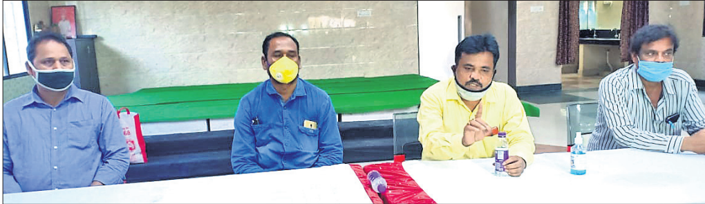
ଖବରଦାତା ସମିକନୀରେ ଟ୍ରାକ୍ଟର ମାଲିକ ସଂଘ ସଦସ୍ୟମାନେ ।

କୋରାପୁଟ ଜିଲ୍ଲା କନ୍ଧପୁର ଟ୍ରାକ୍ଟର ମାଲିକ ସଂଘ ରୁଧିବାରରୁ ଉପକ୍ରମାପାଳକ କାର୍ଯ୍ୟାଳୟ ଆଗରେ ଧାରଣା ଦେବ ।