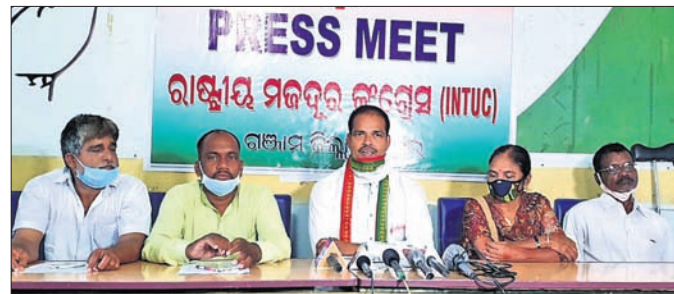
ଖବରଦାତା ସମିକନୀରେ ମଞ୍ଚାସୀନ କଂଗ୍ରେସ କାର୍ଯ୍ୟକର୍ତ୍ତା ।

ଗଞ୍ଜାମରୁ ଶ୍ରମିକଙ୍କୁ ନେଇ ସୁରତ ଯାଉଥିବା ବସ୍ ଛତିଶଗଡ଼ର ରାୟପୁର ନିକଟରେ ଶନିବାର ଦୁର୍ଘଟଣାଗ୍ରସ୍ତ ହେବାକୁ ୮ ଜଣଙ୍କ ମୃତ୍ୟୁ ଘଟିଥିଲା ।