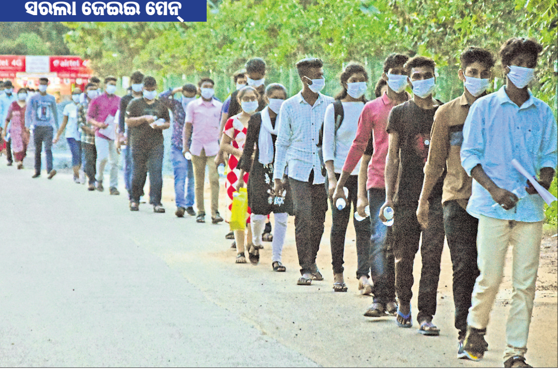
ଜେଇଲ ମେନ୍ ପରାମ୍ପାର ଶେଷଦିନରେ ରବିବାର ଭୁବନେଶ୍ୱରର କୌଣସି କଲେଜ କେନ୍ଦ୍ରକୁ ପରାମ୍ପା ସାରି ଛାତ୍ରାଛାତ୍ରୀମାନେ ବାହାରୁଛନ୍ତି।

ନବଗୁଣ୍ଡର ଆପଣା ମନେ ଆପେ ସୁନ୍ଦର । ସାଧାରଣତଃ ସମସ୍ତେ ନିଜକୁ ଭଲ ବୋଲି ଦେଖେଇ ହୁଅନ୍ତି ବା କହି ହୁଅନ୍ତି।