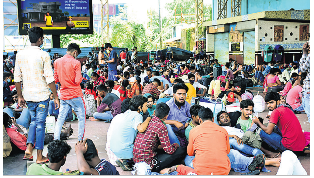
ରାଜ୍ୟରେ କରୋନା ସଂକ୍ରମଣ ସ୍ତୂର ହୋଇ ବହୁଥିବାବେଳେ ଭୁବନେଶ୍ୱର ରେଳ ଷ୍ଟେଶନ ବାହାରେ ବିଶ୍ରାମ ସ୍ଥଳରେ ଯାତ୍ରୀମାନେ କୋଭିଡ୍ ରିସ୍ତମକୁ ମାନ୍ୟ ନାହାନ୍ତି।